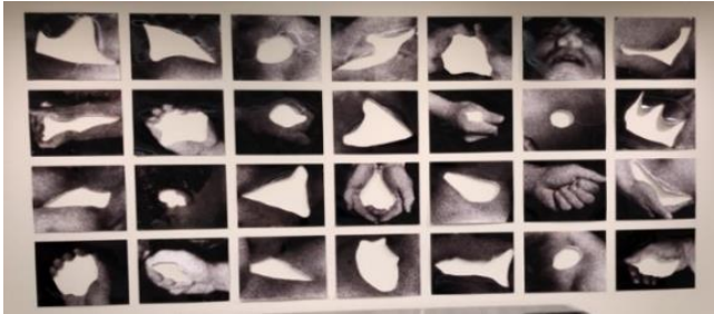
Fotoğraf-8: Going Dark Sergisi Guggenheim Müzesi New York 2023