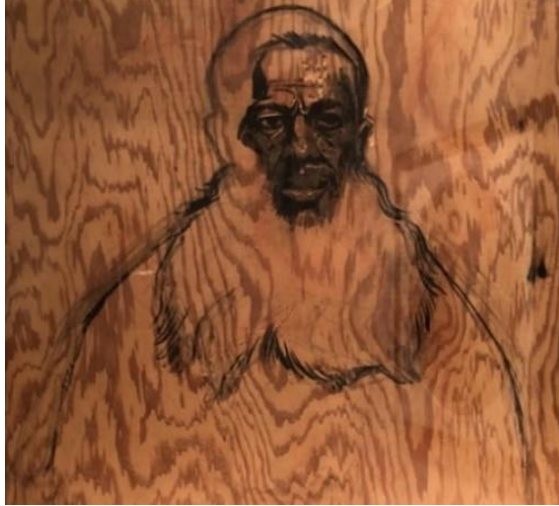
Fotoğraf-7: Going Dark Sergisi Guggenheim Müzesi New York 2023/ Fotoğraf: Şükran Bulut.