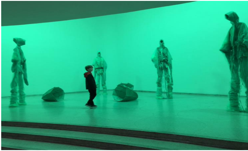
Fotoğraf-2: Going Dark Sergisi Guggenheim Müzesi New York 2023/ Şükran Bulut.

Sergide yer alan eserlerden bir kısmında, çağdaş sanatın sınırlarını zorlayan dijital teknoloji uygulamalarından biri olan kroma anahtarlı yeşil ve mavi ekran teknikleri kullanılmıştır. Bu teknoloji, özellikle film ve televizyon endüstrisinde yaygın olarak kullanılırken, sanat dünyasında da benzersiz bir ifade biçimi olarak kendine yer bulmuştur. Kroma anahtar tekniği, sanatçılara arka planı kolaylıkla