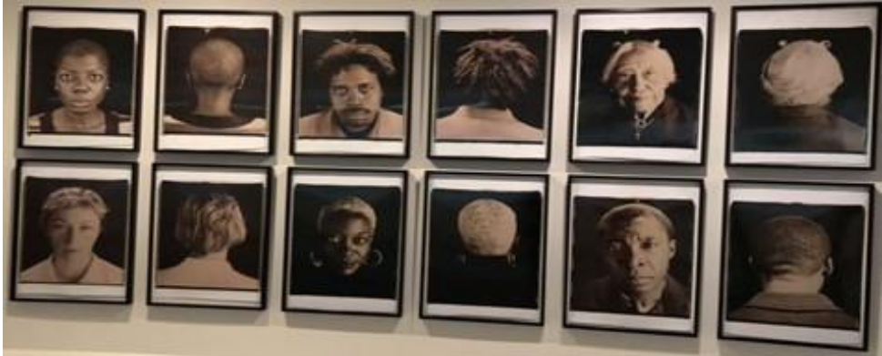
Fotoğraf-12: Going Dark Sergisi Guggenheim Müzesi New York 2023