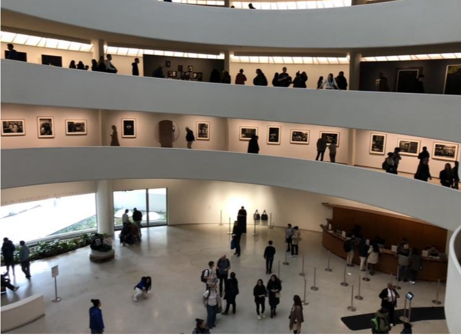
Fotoğraf-20: Going Dark Sergisi Guggenheim Müzesi New York 2023