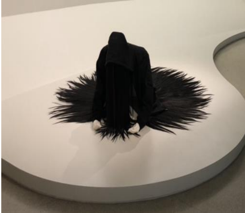
Fotoğraf-17: Going Dark Sergisi Guggenheim Müzesi New York 2023/ Fotoğraf: Şükran Bulut.

Eser, bu detaylarıyla, izleyiciyi sadece görsel bir izlenimle değil, aynı zamanda derinlemesine bir empati ile etkiler. Sanatseverler, bu heykeli incelediklerinde, sadece estetik bir nesne olarak değil, aynı zamanda bir insan deneyiminin somut bir yansıması olarak algırlar. Heykel, izleyicinin kendi iç dünyalarına dönük bir yolculuğa çıkmasına neden olur ve böylece sanatın, insan ruhunun en karanlık köşelerine ışık tutma gücünü sergiler (Li et al., 2024, s. 112).