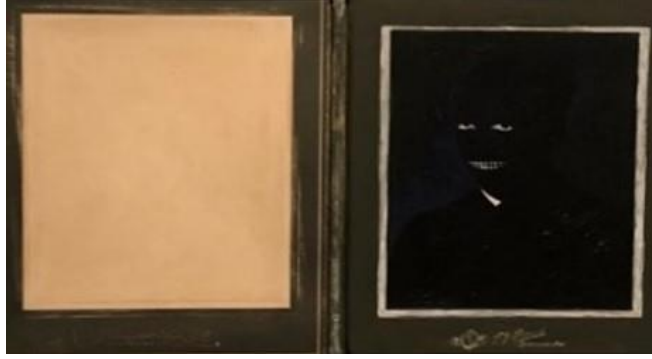
Fotoğraf-4: Going Dark Sergisi Guggenheim Müzesi New York 2023/ Fotoğraf: Şükran Bulut.

bakış atmaya davet eder (Li et al., 2024, s. 112). Bu, eserlerin çok katmanlı yorumlarını mümkün kılar ve sanatsal ifadenin sınırlarını zorlar. Dolayısıyla, bu sergide yer alan sanatçılar, karanlık ve gölgeleme gibi biçimsel stratejiler aracılığıyla, izleyicilerin algısını sadece görsel olarak değil, duygusal ve düşünsel olarak da etkileyen bir sanatsal dil geliştirirler. Bu eserler, karanlığın estetik ve anlam yükü taşıyan bir eleman olarak nasıl kullanılabileceğine dair zengin örnekler sunar ve sanatın evrensel dilinde yeni anlatım olanakları yaratır.