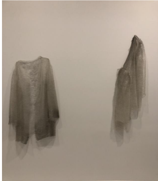
Fotoğraf-10: Going Dark Sergisi Guggenheim Müzesi New York 2023/ Fotoğraf: Şükran Bulut.