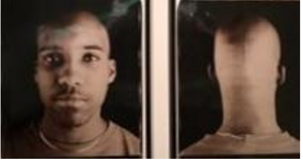
Fotoğraf-13: Going Dark Sergisi Guggenheim Müzesi New York 2023/ Fotoğraf:Şükran Bulut.