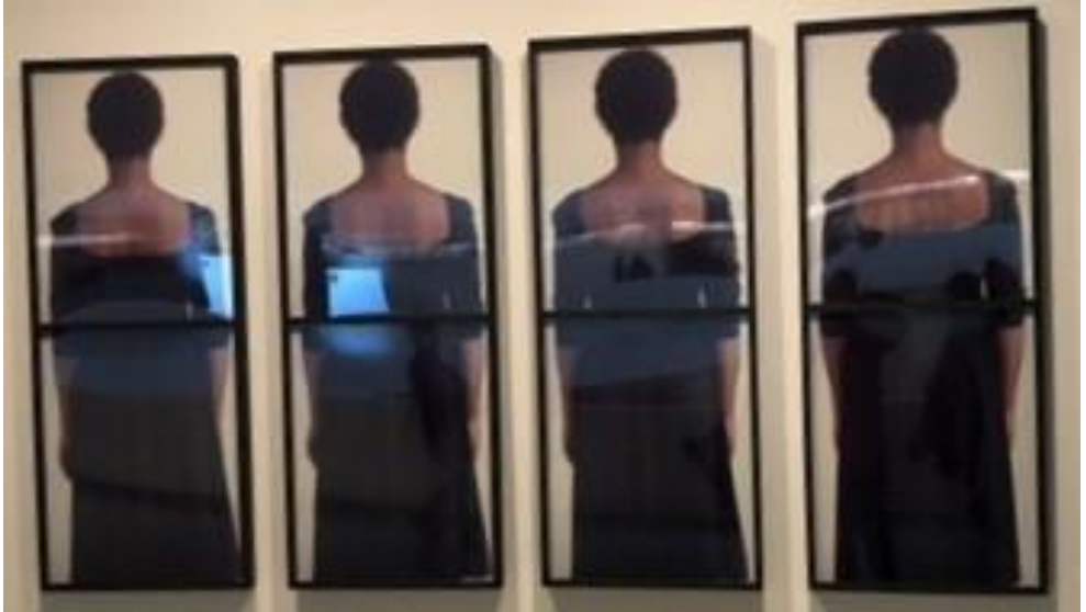
Fotoğraf-14: Doing Dark Sergisi Guggenheim Müzesi New York 2023