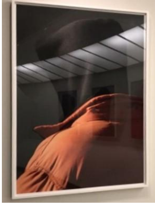
Fotoğraf-9: Going Dark Sergisi Guggenheim Müzesi New York 2023