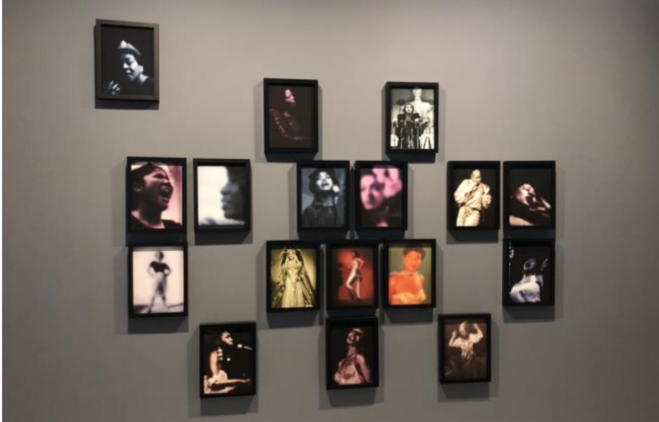
Fotoğraf-21: Going Dark Sergisi Guggenheim Müzesi New York 2023/ Fotoğraf: Şükran Bulut.