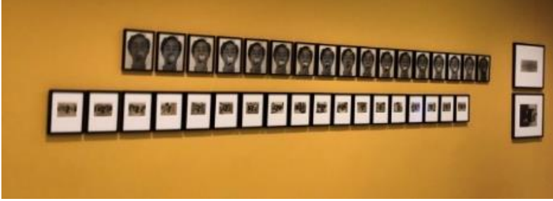
Fotoğraf-18: Going Dark Sergisi Guggenheim Müzesi New York 2023

deneyiminin derinliklerini keşfetme ve paylaşma arzusunu yansıttığı için de önemlidir.