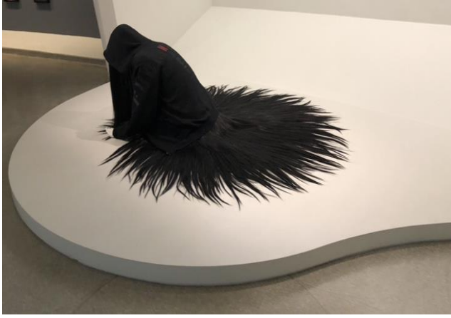
Fotoğraf-16: Going Dark Sergisi Guggenheim Müzesi New York 2023/ Fotoğraf: Şükran Bulut.

Fotoğraf 17. Bu eser, içsel bir dünya ile fiziksel gerçeklik arasındaki çarpıcı tezatı ortaya koyar. Yerde oturan ve öne doğru kapanmış bir pozisyonda bulunan figür, acı çeken ve kendi iç dünyasına çekilmiş bir hali temsil eder (Mandour, 2024, s. 112). Bu figür, başının öne eğik oluşuyla, yalnızlık ve ıssızlık hislerini derinden yaşadığını gösterir. Simsiyah giysiler içindeki figür, realist bir heykel çalışması olarak, insan boyutlarında ve detaylarında üretilmiş olup, sanatın gerçekçilikle soyut duygusal ifadeyi nasıl harmanlayabileceğinin bir örneğini sunar.