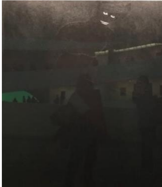
Fotoğraf-5: Going Dark Sergisi Guggenheim Müzesi New York 2023

Genel olarak, bu sanatçılar, yeni malzeme kullanımları ve baskı tekniklerinin yanı sıra, post prodüksiyon araçlarıyla görsel bir yenilik ve estetik çeşitlilik sunarak, sanatın sınırlarını genişletmekte ve izleyicilere unutulmaz sanatsal deneyimler sunmaktadırlar. Bu tür yenilikler, sanatsal ifadenin gelecekteki yönünü şekillendirmede önemli bir rol oynar ve sanatın teknoloji ile olan etkileşimini ön plana çıkarır.