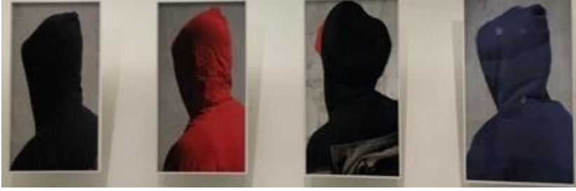
Fotoğraf-15: Going Dark Sergisi Guggenheim Müzesi New York 2023