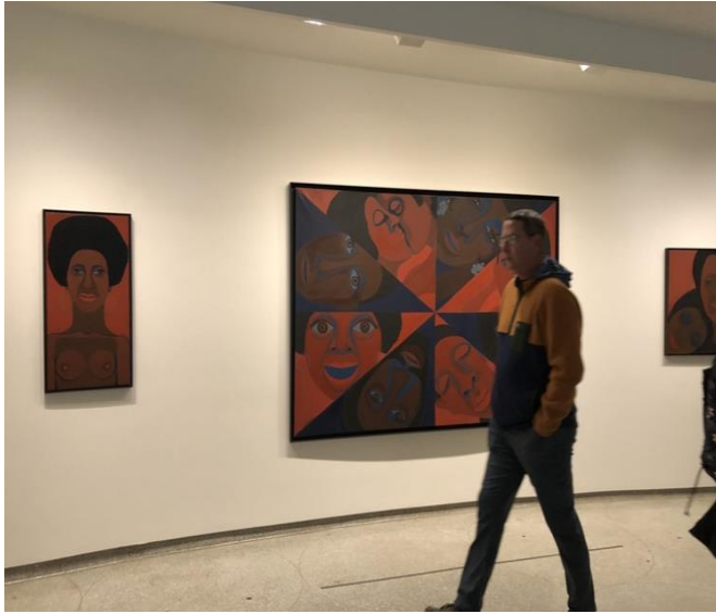
Fotoğraf-3: Going Dark Sergisi Guggenheim Müzesi New York 2023

Bu sergide yer alan eserler, sanatçıların karanlığı keşfetme biçimlerini ve bu temayı ifade etmek için kullandıkları çeşitli biçimsel stratejileri vurgulamaktadır (Hang, 2023, s. 102). Sergilenen eserler arasında, gölgeleme teknikleri başta olmak üzere, gerçek anlamda karartma yöntemlerini kapsayan çeşitli yaklaşımlar göze çarpmaktadır. Bu teknikler, sanatçıların karanlığa olan yolculuklarını sembolize eder ve izleyicilere, görsel olarak yoğun ve duygusal açıdan etkileyici bir deneyim sunar. Sanatçılar, gölgeleme kullanarak ışık ve karanlık arasındaki kontrastı artırırken, bu kontrastı derinleştirmek ve eserlerine dramatik bir hava katmak için koyu tonlar ve yoğun karartmaları tercih ederler (Haseli, Ghazizadeh & Afshari, 2023, s. 58). Gölgeleme, yalnızca form ve hacim yaratmada değil, aynı zamanda eserin genel duygusal tonunu belirlemede de kritik bir rol oynar. Karanlığın ve gölgelerin yoğun kullanımı, eserlerin atmosferini zenginleştirir ve izleyicilerin duygusal tepkilerini derinleştirir. Bu sanatçılar, aynı zamanda karanlığı, metaforik anlamda içsel dünyalar, bilinçaltı düşünceler ve gizli duygular gibi konuları araştırmak için bir araç olarak kullanırlar. Eserlerdeki karanlık, sadece fiziksel bir özellik olmanın ötesine geçer ve izleyicileri, sanatçının psikolojik ve duygusal dünyasına daha derin bir