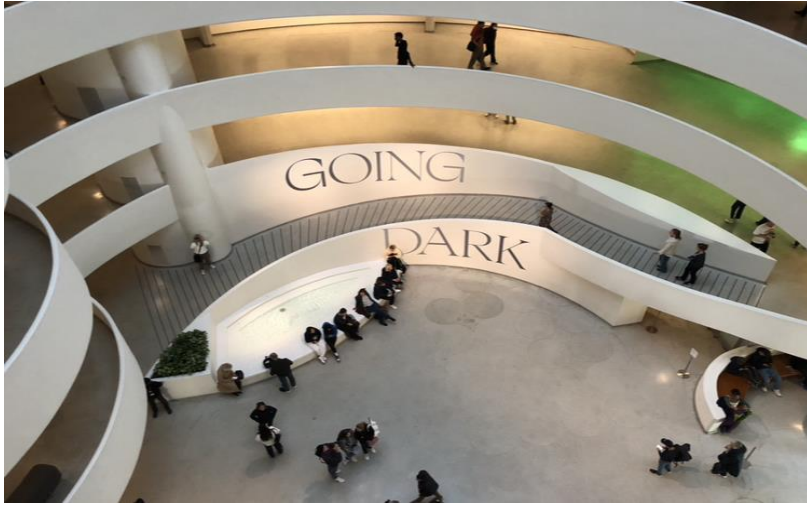
Fotoğraf-1: Going Dark Sergisi Guggenheim Müzesi New York 2023