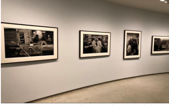
Fotoğraf-6: Going Dark Sergisi Guggenheim Müzesi New York 2023/ Fotoğraf: Şükran Bulut.