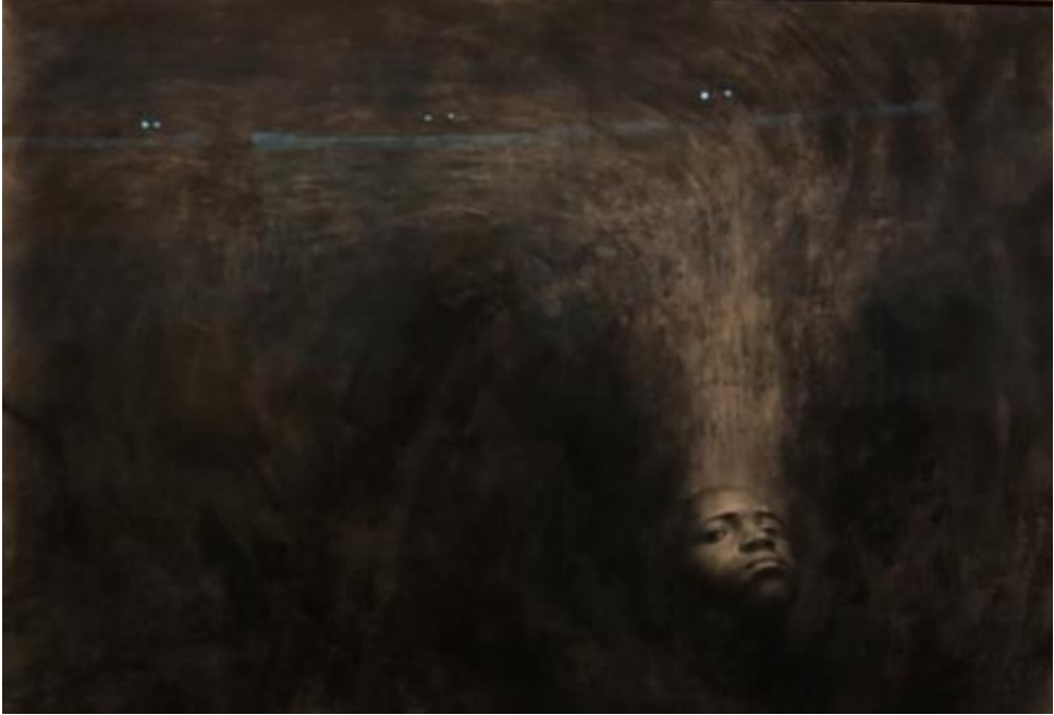
Fotoğraf-19: Going Dark Sergisi Guggenheim Müzesi New York 2023/ Fotoğraf: Şükran Bulut.