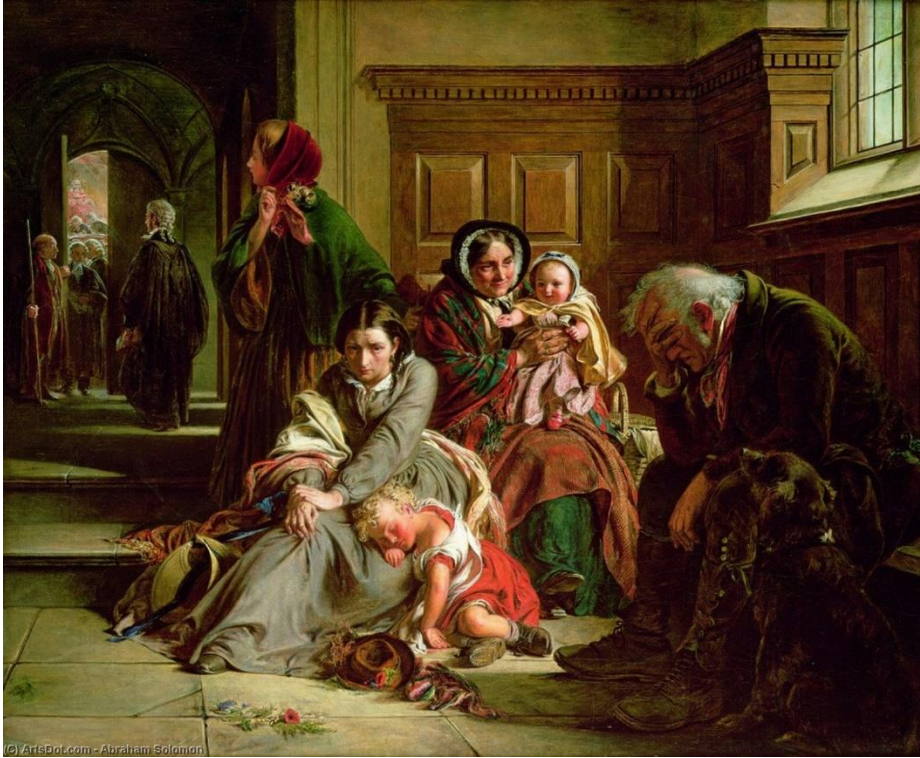
Tablo 1, Abraham Solomon, Kararı Beklerken, Tuval Üzerine yağlıboya, 63.8x88.9 cm, 1859

Abraham Solomon, zengin ahşap panellere sahip oldukça kasvetli bir bekleme odası ortamında davalının ailesinin duruşmanın sonundaki gözle görülür kaygısını tasvir etmektedir. Eserde, yaşlı bir babanın hayatlarında zor bir dönem olması etrafında şekillenmektedir. Bu nedenle bunun bir köpeği yaşlı adamı sanki onu teselli etmeye çalışıyormuş gibi beklentiyle izliyor. Genç kadın arka planda mahkeme salonuna beklentiyle bakıyor. Açık kapı ve koridorun diğer ucunda sohbet eden avukatlar görülmektedir. Sanığın suçlu değil 'de aşikar bir şekilde aklanmasının ardından büyük bir rahatlamanın tasviri var. Solomon, yakın zamanda beraat eden adamın gözlerindeki rahatlama ustalıkla yakaladı. Çoğu köpek gibi kendisinin de dahil olmasını sağlayan bu aile ve tatlı köpek için büyük bir rahatlama hissetmeden edemiyoruz. Arka planda baba, oğlunun avukatına yürekte şükranlarını sunarken görülüyor. Dışardaki parlak ışıklar, sadece adam için değil ailesi için de önümüzdeki yeni bölümün habercisi. Lobide bekleyenler, kaderi hukuki sürece emanet edilenlerin yeni bir bekleme ve umut döngüsünün göstergesi.