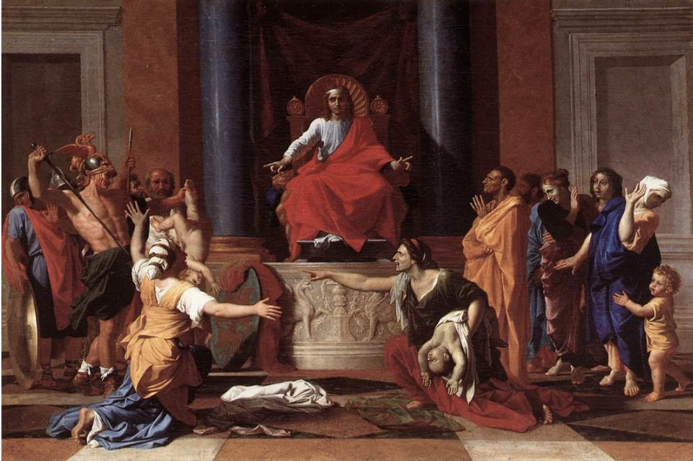
Tablo 2, Nicolas Poussin, Süleyman'ın Yargısı, tuval üzerine yağlıboya, 101 x 150 cm, 1649

Süleyman'ın hafifçe kaldırdığı kollarındaki son derece titiz geometri, aynı zamanda denge tepsilerini, adalet sembollerini ve aynı zamanda klasik trajedilerin dekorasyonlarını da çağırıştırıyor. Kralı, bilgisi sayesinde bu işi çözerek, yani gerçeği bulup suçluyu cezalandırarak ahengi sağlayan bir orkestra şefine benzetebiliriz. Merkezi karakter olarak kral, resmi ikiye ayıran bir simetri eksenini oluşturmaktadır. Sağdaki karakter grubu görsel olarak soldaki diğergrupa cevap veriyor gibi görünmektedir.