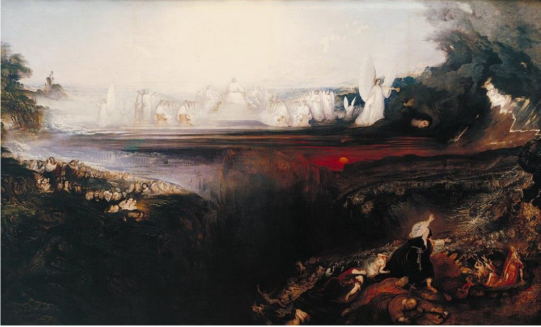
Tablo 4, John Martin, Son Yargı Tuval üzerine yağlıboya, 196,8 x G 325,8 cm, 1853

John Martin belki de çalışmalarının çoğu, Son Yargı da dahil olmak üzere kutsal kitapta geçen temalara odaklanmıştır. Onun Kıyamet günü hakkındaki yorumunda Tanrı, dört meleğin Cennette bir tahtta otururken tasvir edilmiştir. Yine cennet/cehennemin iki gruba ayrılması, resminde gerçek hayattaki insanlara yer vermesi, mahşeri dünyadaki varlıklar olarak tanımladığını göstermektedir. Triptik bir eser olan “Son Yargı” Resminin arka planında, tarihi ve mimari unsurlar içermektedir.