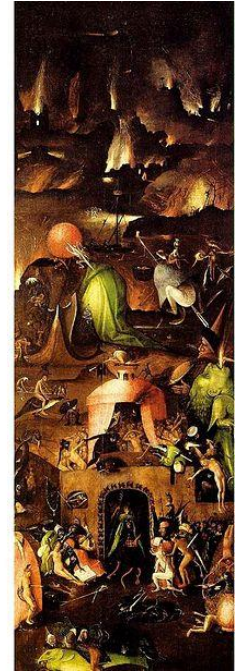
Tablo 3, Hieronymus Bosch, Son Yargı, Ahşap üzerine yağlıboya triptik, 163,7 cm × 242 cm, 1482