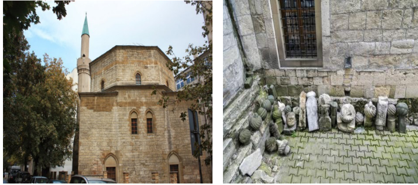
Resim 5-6: Bugün Ayakta Kalan Ve İbadete Açık Bayraklı Camii Caminin Hemen Kenarında Bulunan Osmanlı Mezar Taşları

pija ‘kapı’, baksuz ‘bahtsız’, ugusruz ‘uğursuz’, kula ‘kule’, komšija ‘komşu’, imam ‘imam’, ‘muftija müftü’, džamija ‘cami’ vb.” (Marinkoviç, 2009, s.388-389).