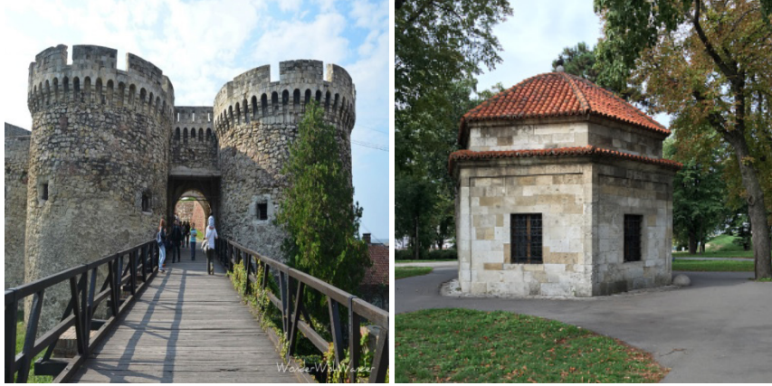
RESİM 1-2: Kale Meydan Olarak Anılan Belgrat Kalesi (Zindan Kapı Giriş) ve Kale İçinde yer alan; Silahdar Damat Ali Paşa Türbesi

Teraziye Caddesi, bugünde Osmanlılar döneminden kalan şehre su dağıtımını sağlayan su terazisinden alır. Bu günde Belgrad'ın caddesi olma özelliğini korumaktadır.