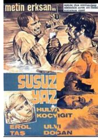
Görsel 1: Susuz Yaz film afişi

Yönetmen: Metin Erksan, Senaryo: M. Erksan, İ. Soydan, Oyuncular: Erol Taş, Hülya Koçyiğit, Ulvi Doğan.