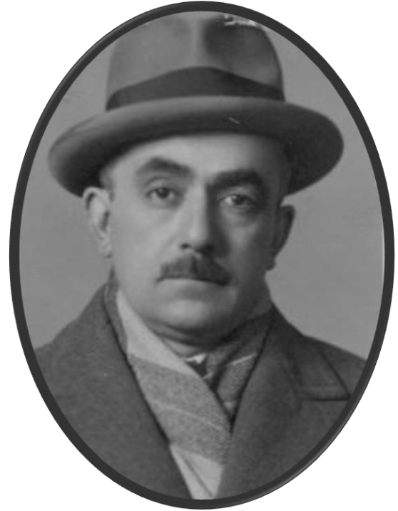
Yakup Kadri Karaosmanoğlu

Y akup Kadri'nin Ağustos-Eylül 1913'te kısa bir süreliğine hikâyelerini yayımlamasıyla başlayan İkdam 'daki yazı serüveni 1 , Temmuz-Ağustos 1916'da yine hikâyeleri vesilesiyle ve yine kısa süreliğine kendini gösterir. Gazetede ki asıl yazı faaliyeti ise Kasım 1919'da İsviçre'deki tedavisinden döndükten sonra başlar ve 1923 Temmuz'una kadar devam eder. Yaklaşık dört yıllık bu yazı serüveni, diyebiliriz ki Yakup Kadri'nin gazete yazarlığının en yoğun dönemlerindedir 2 Yazıları genellikle ikinci, kimi zaman da birinci ve üçüncü sayfalarda yer almakla birlikte Yakup Kadri hatıralarında kendini İkdam 'ın başyazarı olarak takdim etmekte ve "sahipsiz ve mesleksiz" kaldığını düşündüğü bu gazeteyi Millî Mücadele davasının emrine dâhil ettiğini bildirmektedir. Gazetenin başına geçtikten sonra, kendi deyimiyle, "bir alay Hürriyet ve İtilafçı'yı kapı dışarı etmiş", onların yerine "vatanseverlik ve milliyetçilik duygularından emin bulunduğu arkadaşları[nı]" (Karaosmanoğlu, 2019, s.48) getirmiştir. 1957 tarihli Vatan Yolunda 'dan alınan bu ifadeler bir tarafa, Yakup Kadri'nin 1927'de tefrika ettiği Hüküm Gecesi 'nin başkarakteri Ahmet Kerim, "kapı dışarı