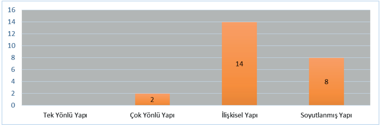
Şekil 4. 2024 Ortaöğretim 12. Sınıf Kimya Dersi Öğrenme Çıktılarının SOLO Taksonomisinin Düzeylerine Göre Dağılımı

3.4. Araştırmanın “2024 Ortaöğretim 12. sınıf kimya dersi öğrenme çıktıların SOLO taksonomisinin düzeylerine göre dağılımı nasıldır? şeklinde ifade edilen alt problemine ait bulgular aşağıda sunulmuştur: