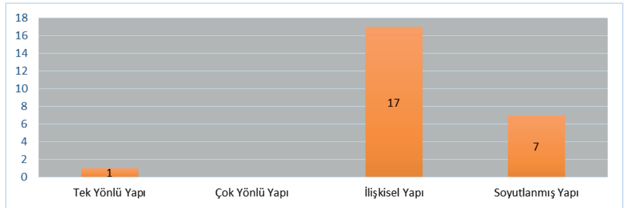
Şekil 3. 2024 Ortaöğretim 11. Sınıf Kimya Dersi Öğrenme Çıktılarının SOLO Taksonomisinin Düzeylerine Göre Dağılımı

3.3. Araştırmanın “2024 Ortaöğretim 11. sınıf kimya dersi öğrenme çıktılarının SOLO taksonomisinin düzeylerine göre dağılımı nasıldır?” şeklinde ifade edilen alt problemine ait bulgular aşağıda sunulmuştur: