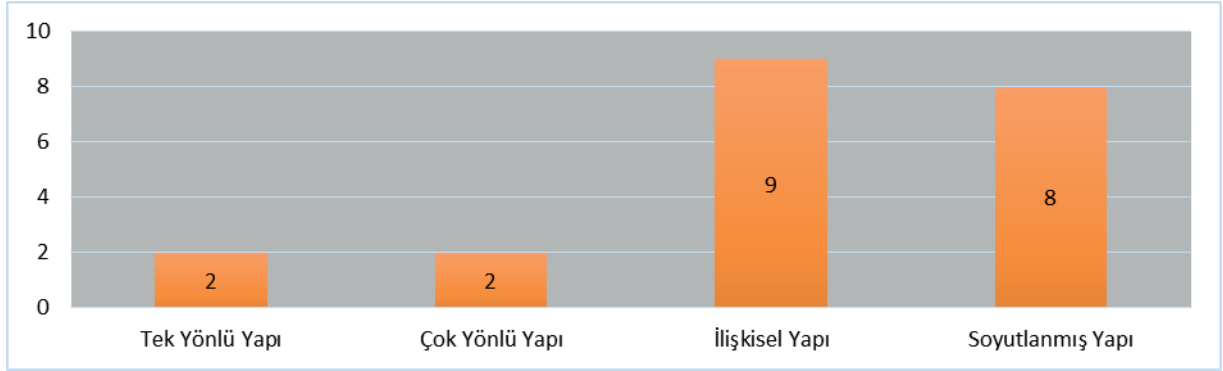
Şekil 2. 2024 Ortaöğretim 10. Sınıf Kimya Dersi Öğrenme Çıktılarının SOLO Taksonomisinin Düzeylerine Göre Dağılımı

3.2. Araştırmanın “2024 Ortaöğretim 10. sınıf kimya dersi öğrenme çıktılarının SOLO taksonomisinin düzeylerine göre dağılımı nasıldır?” şeklinde ifade edilen alt problemine ait bulgular aşağıda sunulmuştur: