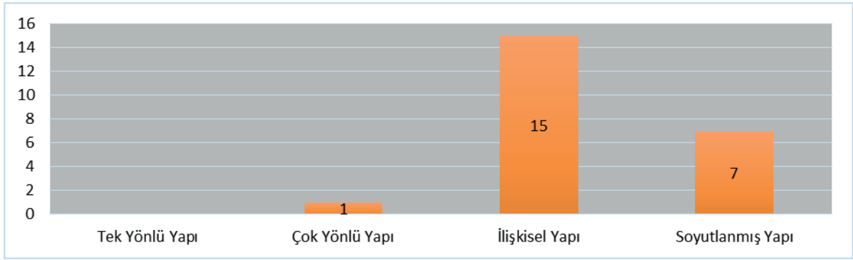
Şekil 1. 2024 Ortaöğretim 9. Sınıf Kimya Dersi Öğrenme Çıktılarının SOLO Taksonomisinin Düzeylerine Göre Dağılımı

3.1. Araştırmanın “2024 Ortaöğretim 9. sınıf kimya dersi öğrenme çıktılarının SOLO taksonomisinin düzeylerine göre dağılımı nasıldır?” şeklinde ifade edilen alt problemine ait bulgular aşağıda sunulmuştur: