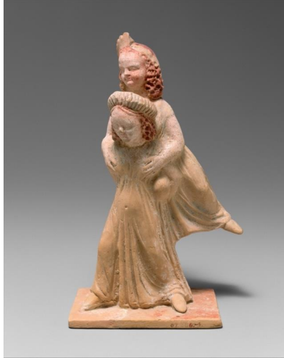
Görsel 2. 'Ephedrismos Oynayan Kızlar' terakota heykel MÖ 3. Yüzyıl Metropolitan Müzesi, New York.

Günümüz çocukluk ölçütleri açısından Antik Yunan toplumu ile aramızda çeşitli farklılıklar olmasına rağmen çocuk mekânları konusunda eğitim yönünden güncel paralellikler söz konusudur. Antik Yunan toplumunun okul düşüncesini icat etikleri, okul için 'leisure' (boş ya da serbest zaman) sözcüğünü kullandıkları bilinmektedir (Postman, 1995). Çocuklar belirli bir yaşa ulaşana kadar, evlerinde 'paidagogos' adı verilen özel öğretmenlerden eğitim almakla beraber, okula gönderilme yaşları geldiğinde evden farklı bir mekânda gymnasium ve palaistra alanlarında eğitimlerine devam etmektedirler (Coşkun, 2011). Öte yandan Frost (2010) Antik Yunan döneminde çocukların istedikleri kadar oyun oynamalarına izin verildiğini belirtmektedir (Görsel 2).