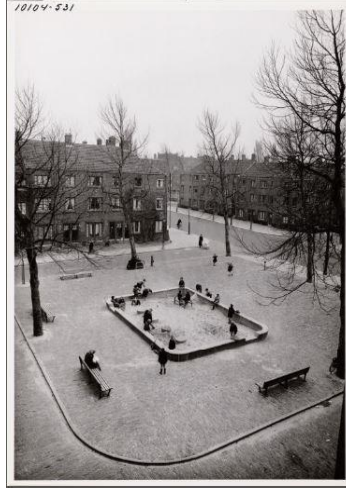
Görsel 17. Bertelmanplein'deki çocuk oyun alanı, Amsterdam, 1956

fikrin ilk olarak, Amsterdam'ın güneybatısında bulunan Bertelmanplein kentinde uygulanmaya koyulduğu ve seçilen alanın üç tarafı konutlar ile çevrelenen yüzeylere sahip olduğu vurgulanmaktadır (Solomon, 2005). Halka açık olarak inşa edilen bu oyun alanı (1947, 1974'te yenilediği belirtilmektedir), dikdörtgen bir forma sahip olarak alçak sınırlayıcılar yardımıyla çevrelenmekte böylece hem mekânsal boşluğu doldurması hedeflenirken hem de oyun alanının çocuk ölçeğini aşan herhangi bir bariyer kullanılmadan kentten ayrılabilmesi gösterilmektedir (Solomon, 2005). Ayrıca, oyun alanının çevresinde herhangi bir bariyer kullanmak yerine insan duvarı niteliğinde ahşap bankların kullanılmasının, ebeveynlerin hem çocuklarını gözlemlemelerine olanak tanıdığı hem de sosyalleşmelerini sağladığı düşünülmektedir (Solomon, 2005) (Görsel 17).