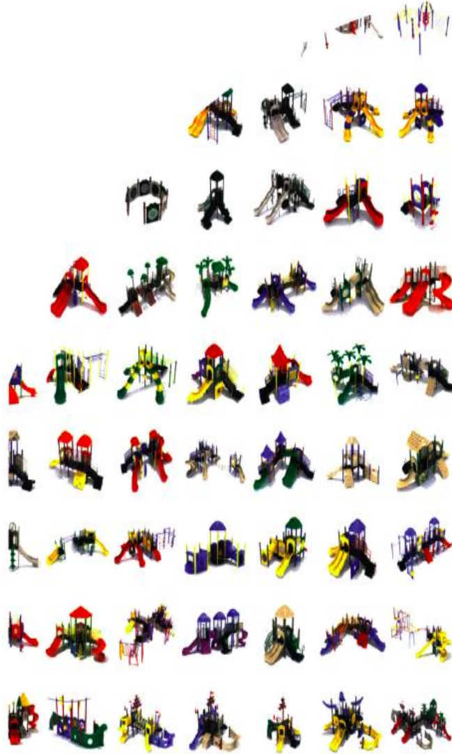
Görsel 19. Standartlaştırılmış Oyun Alanı Ekipmanları

Oyun alanlarında çocuğun bilişsel gelişimini arttırmaya yönelik çeşitli oyun materyalleri bulunmasına rağmen, 20. yüzyıl başlarında özellikle Amerika'daki devlet okullarında bulunan birçok oyun alanının, çocuklara yönelik tehlike barındırmasının yanında herhangi bir yararının da bulunmadığı ABD Eğitim Bülteni Bürosu tarafından iddia edilmektedir (Albert, 2017). Bu eleştiriler üzerine oyun alanı ekipmanı kavramının, çocukların olası yaralanma ve zarar görme ihtimallerinin en aza indirilmesi amacı ile ortaya çıktığı, düzenlenebilir ve tasarlanabilir somut birer proje haline getirilerek standartlaştırıldığı bilinmektedir (Albert, 2017).