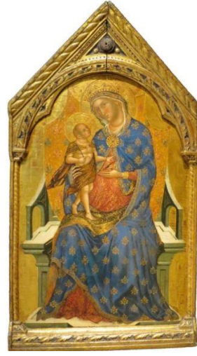
Madonna ve Çocuk, Paolo Veneziano 1340-45, Norton Simon Müzesi, Pasadena.