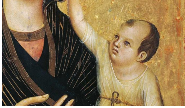
Görsel 5. Madonna, Çocuk ve İki Meleğin Detayı, Duccio di Buoninsegna, 1283-84, Opera del Duomo Müzesi, Siena, Web Sanat Galerisi, Washington D.C.

14. yüzyıla ait bir sanat eserinde temsil edilen üç çocuk, yetişkinlerden hiçbir farklılık gözetilmeksizin yetişkin adam boyutlarından daha küçük ölçeğe indirgenerek, minyatür yetişkinler olarak resmedilmektedirler (Görsel 6). Sanatçı, ortaya koymuş olduğu bu eserde çocukları, ancak yetişkinlerin sahip olabilecekleri gelişmiş kas yapılarıyla ve çıplak bedenleriyle tasvir etmekten kaçınmamaktadır. Sanatçılar çocuk tasvirlerinde yetişkin bir adam imgesi yaratmakta ve bu resim çocuğa benzemekle birlikte çocuğun yetişkinliğine atıfta bulunmaktadır.