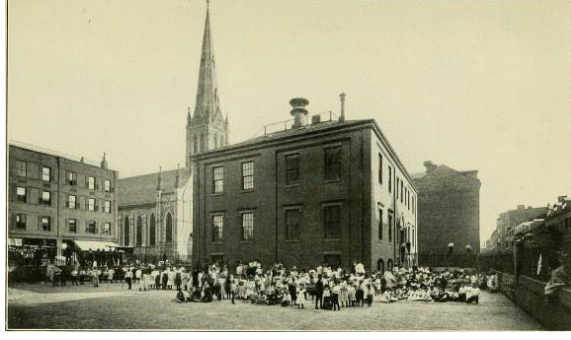
Görsel 13. Organize edilen bahçeli 'model oyun alanı', Boston (Kaynak: Rainwater, 1922)

Yaklaşık 1895'te başladığı belirtilen model oyun alanı fikri ile çocukları ve gençleri cezbetmek, yönlendirmek, canlandırmak ve ihtiyaçlarını karşılayabilmek adına çocuğun doğasının gerektirdiği unsurlarla donatılan ve böylece ev, okul gibi mekânların çocuklar ile arasında bir bağlantı halkası olarak hizmet edebilen, yeterli sayıda ve boyutta açık alanlar kastedilmektedir (Tsanoff, 1897). Görsel 14'te Hull House tarafından hayata geçirilen model oyun alanları gösterilmektedir.