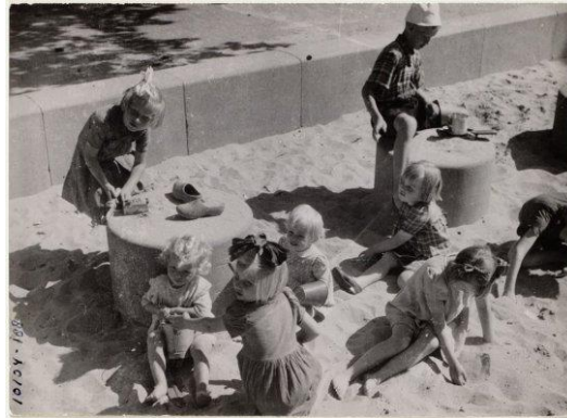
Görsel 16. Kum havuzunda oyun oynayan çocuklar, Amsterdam Bertelmanplein, Amsterdam Şehir Arşivi (Kaynak: URL-14)

Son yıllardaki şehirlerin 'çocuk dostu kent' olma fikri üzerinde yoğunlaştığını belirten Chermayeff (2009), bu düşünceye ilişkin, 1947-1978 yılları arasında birçok şehir için yüzlerce oyun alanı tasarlayan Hollandalı mimar Aldo van Eyck'ın (1918-1999) katkısının yadsınamaz olduğunu belirtmektedir. II. Dünya Savaşı sonrasında, savaşın yıkıcı etkilerinden biri olarak boşalan arazilerin, çocuklar ile dolup taştağını gören van Eyck'ın, Amsterdam şehrinde hayatın yeniden normale dönmesi için çalışmalarda bulunarak yedi yüzün üzerinde çocuk oyun alanı tasarladığı bilinmektedir (Chermayeff, 2009; Solomon, 2005) (Görsel 16).