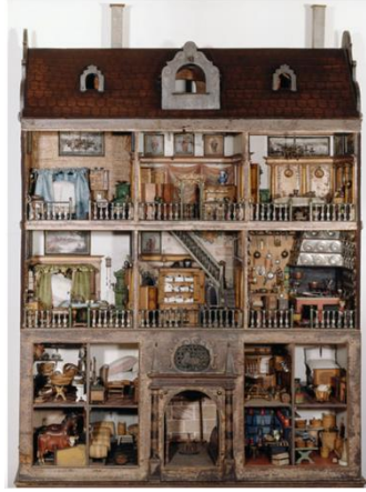
Görsel 10. Stomer Bebek Evi, 1639, Germanisches Ulusal Müzesi, Nürnberg.

Rönesans dönemi olan 16. ve 17. yüzyıllara gelindiğinde çocuk oyunları açısından birtakım gelişmeler olduğu söylenebilmektedir. Rönesans dönemi boyunca ailelere düğün hediyesi olarak verilen minyatür bebek evlerinin dönemin çeşitli unsurlarına ışık tuttuğu belirtilmektedir (Onur, 1992). Bu minyatür bebek evlerinin, dönemin evlerinin sahip olduğu iç mekân kurgusunu bire bir olmasa bile olabildiğince yansıttığı ve 12-13 yaşlarındaki küçük kız çocuklarının oyun aracı olduğu düşünülmektedir (Onur, 1992). Onur'a göre (1992) bu minyatür bebek evleri küçük yaştaki kız çocuklarını ev işlerine ve gelecekteki yaşam şartlarına hazırlamak için bilinçli olarak hazırlanan benzerlikle dolu bir oyun evidir (Görsel 10).