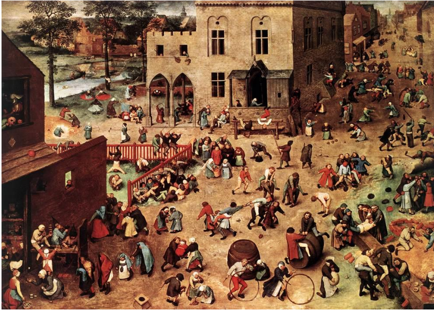
Görsel 9. Pieter Bruegel tarafından yapılan Çocuk Oyunları Tablosu, 1560, Sanat Tarihi Müzesi, Resim Galerisi, Viyana

Yıllar içinde oyun eylemi nitelik ve bağlamı açısından çeşitli değişimler göstermekte lakin oyun eyleminin icra edildiği mekân olarak evin dışında kalan alanlar Orta Çağ'dan günümüze değin oyun mekânı olarak tercih edilme sürekliliğini korumaktadır. Örneğin sokakta oyun oynayan çocukları Orta Çağ Avrupası'nda bile görmek mümkündür. Bu yargıyı destekleyecek nitelikteki belgelerden en önemlisi ve en ünlüsü şüphesiz ki Pieter Bruegel'in 1560 yılında, yağlı boya ile yaptığı 'Çocuk Oyunları' isimli tablosudur (Görsel 9).