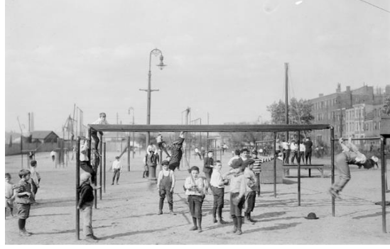
Görsel 15. 1900 ve 1905 yılları arasında Boston'daki Charlesbank Oyun Alanı

Amerika'daki oyun alanı hareketinin çıkış noktası olan kum bahçeleri, Almanya'daki oyun alanı hareketi ile benzerlik göstermektedir ve nitekim Berlin'de kurulan kum bahçeleri, oyun alanlarının başlangıcı niteliğini taşımaktadır (Mero, 1908). Fransız oyun alanlarının 1900'lü yılların başlarında gelişim gösterdiği, aynı yıllarda İngiliz oyun alanlarının, okullarda beden eğitiminin desteklenmesi neticesiyle dikkate alındığı vurgulanmaktadır (Mero, 1908). İskoçya'da 1900'lü yılların modern anlayışında kullanılabilecek oyun alanlarının, çeşitli aparatlar ile düzenlendiğini, sayılarının bir düzineden fazla olduğunu ve ilk kez belediyeler tarafından işletildiğini belirten Mero (1908); Avusturya, İsviçre, Hollanda ve Danimarka'nın da içinde bulunduğu diğer Avrupa ülkelerinin, oyun alanına olan bakış açılarının zamanla geliştiğini belirtmektedir.