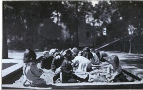
Görsel 12. Çocukların kumda oturarak veya diz çökerek oynayabileceği bir kum havuzu türü

Oyun alanlarının gelişiminde ilk aşama olarak nitelendirilen kum bahçesi tasarımları Frost'a göre (2010); kentlerin yoğun nüfuslu bölgelerinde mevsimsel olarak çalıştırılan ergenlik çağı öncesi çocuklarla hem serbest hem de yönlendirmeli oyunların gerçekleştirilmesi ile çocukları sokakların fiziksel ve ahlaki tehlikelerinden uzaklaştırmayı amaçlamaktadır (Görsel 12). 1886-87 tarihlerinde, kentsel alanlarda kum bahçelerinin oluşturulması, çocukları gecekonduların tehlikelerinden koruyabilme noktasında ciddi bir başarı elde edilebilmesine neden olurken; hayır kurumlarının ve diğer kuruluşların örgütlenerek ortaya koydukları 'çocuk kurtarma hareketi' sayesinde oyun alanları ve rekreasyon alanları oluşturulmakta, yoksulluğun veya evsizliğin çocuklar üzerindeki etkilerini en aza indirme konusunda verimli bir ilerleme gösterilmektedir (Frost, 2010).