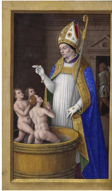
Görsel 6. Aziz Nikolaos ve üç çocuğun illüstrasyonu, Grandes Heures d'Anne de Bretagne, 1503-1508

14. yüzyıla ait bir sanat eserinde temsil edilen üç çocuk, yetişkinlerden hiçbir farklılık gözetilmeksizin yetişkin adam boyutlarından daha küçük ölçeğe indirgenerek, minyatür yetişkinler olarak resmedilmektedirler (Görsel 6). Sanatçı, ortaya koymuş olduğu bu eserde çocukları, ancak yetişkinlerin sahip olabilecekleri gelişmiş kas yapılarıyla ve çıplak bedenleriyle tasvir etmekten kaçınmamaktadır. Sanatçılar çocuk tasvirlerinde yetişkin bir adam imgesi yaratmakta ve bu resim çocuğa benzemekle birlikte çocuğun yetişkinliğine atıfta bulunmaktadır.