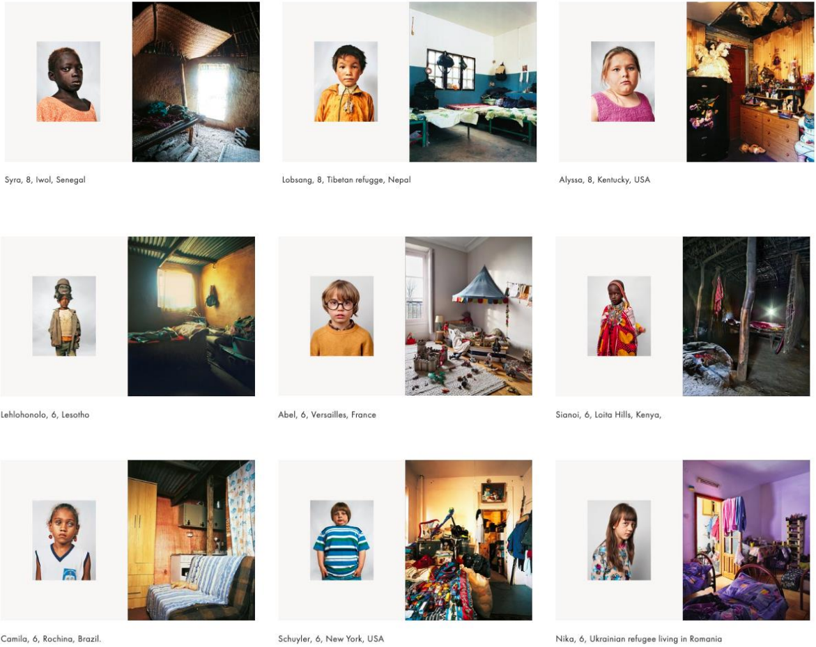
Görsel 1. James Mollison'un Çocuklar ve Uyudukları Mekânlar, Fotoğraf Seçkisinden Bir Kesit

Söz konusu açıklamadan yola çıkarak çocuk öznesinin yaşamın başlangıcından itibaren var olmasına rağmen, çocukluk olgusunun köklü ancak değişken bir geçmişe sahip olduğunu söylemek mümkündür. Öyle ki Postman (1995) toplumsal anlamda, güncel çocukluk olgusunun yüz elli yıldan daha eski bir tarihe sahip olmadığı görüşünü savunmaktadır. Toplumlara etkileyen çeşitli faktörler ile belirli dönemlerde farklı çocukluk anlayışları ortaya çıkmış ve belirli dönemleri ifade etmiştir. Günümüzde artık disiplinler arası bir tartışma zeminine sahip olan çocukluk çağı temelde sosyal, ekonomik, coğrafi, politik ve çevresel değişkenlerin etkisiyle şekillenen bir olgu halini almıştır (Kirazoğlu, 2012). Fotoğrafçı James Mollison'un (2010) çocukların dünyasını yansıtmak için fotoğrafladığı kareler; sosyal, ekonomik, coğrafi, politik ve çevresel değişkenlerin çocukluğu nasıl şekillendirdiğini gözler önüne sermektedir (Görsel 1).