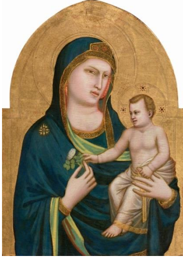
Madonna ve Çocuk, Giotto di Bondone 1310-15. ABD Ulusal Sanat Galerisi, Washington D.C