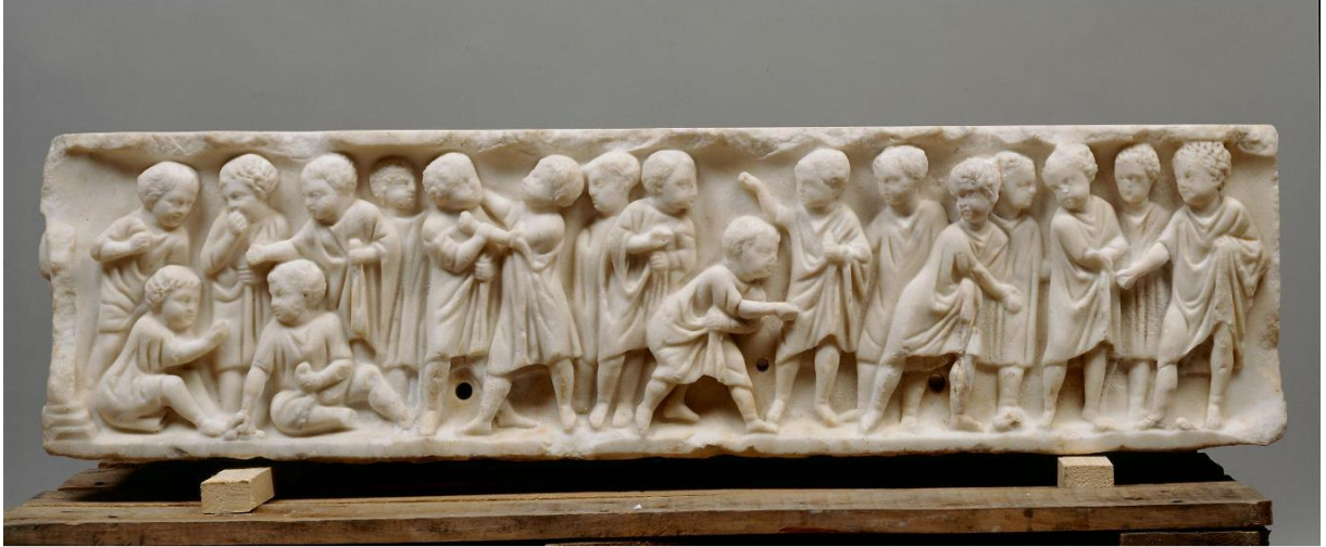
Görsel 3. Fındıklarla oynayan çocukların tasvir edildiği bir çocuk lahdi, Roma MS 170-180, Viyana Sanat Müzesi

Deighton'ın (1999); "Eski Roma Yaşantısında Bir Gün" adlı eserindeki Roma tasvirlerinde, Antik Roma'da çocukların yaz aylarında caddeye çıkıp vakit geçirip, sokağı izleyebildiklerinden söz edilmektedir. Eser, okuldan geriye kalan zamanlarında oyun oynama eğilimi, muhtemel bir Romalı çocuğun, eğer sosyal statü sahibi ise bahçesinde koşup oynayarak zamanının büyük bir kısmını geçirebileceği bir mekâna sahip olabileceğini göstermektedir. Ancak daha alt sınıftan aileye mensup çocukların oyun oynayacağı mekânlar ise evlerinde odanın bir köşesi veya mevsim olarak yaz aylarında kamusal alan olan sokaklarda oynayabilme ihtimalleriyle sınırlıdır (Görsel 3).