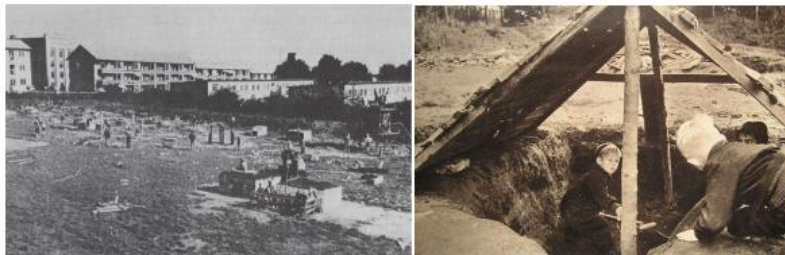
Görsel 18. 'Junk' Oyun alanları, Copenhagen, 1943

1943'te Danimarkalı peyzaj mimarı Sorenson Kopenhag'ın kuzeyindeki Emdrup'ta çocuk oyun alanları ile ilgili tamamen yeni bir konsept geliştirerek; salıncaklar, kaydıraklar, tahterevalliler, atlıkarıncalar, ve kum havuzları ile donatılmış geleneksel oyun alanının aksine, ahşap, ip, kanvas, lastik, tel, tuğla gibi 'hurda' ile dolu boş bir alanın, terk edilmiş mobilyalar ve diğer inşaat malzemeleri gibi dönüştürülmüş malzemelerle donatıldığı maceracı oyun alanı fikrini öne sürmüştür (Kozlovsky, 2006) (Görsel 18).