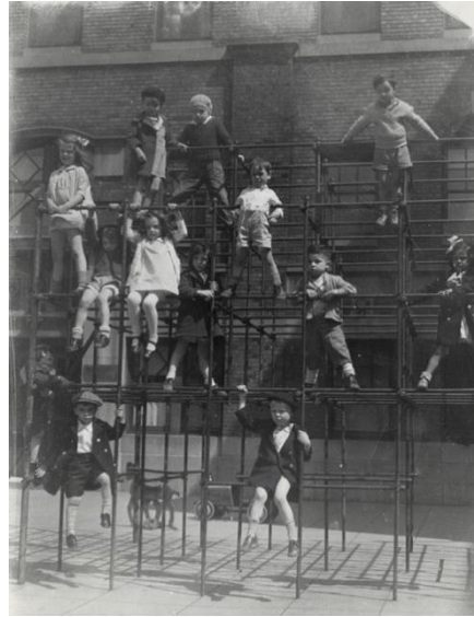
Görsel 14. Hull House Oyun Alanı

Yaklaşık 1895'te başladığı belirtilen model oyun alanı fikri ile çocukları ve gençleri cezbetmek, yönlendirmek, canlandırmak ve ihtiyaçlarını karşılayabilmek adına çocuğun doğasının gerektirdiği unsurlarla donatılan ve böylece ev, okul gibi mekânların çocuklar ile arasında bir bağlantı halkası olarak hizmet edebilen, yeterli sayıda ve boyutta açık alanlar kastedilmektedir (Tsanoff, 1897). Görsel 14'te Hull House tarafından hayata geçirilen model oyun alanları gösterilmektedir.