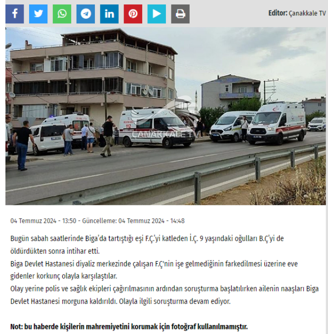
Görsel 5. “Bu Haberde Kişinin Mahremiyetini Korumak İçin Fotoğraf Kullanılmamıştır” İfadesi, (Çanakkale TV, 2024).

Biga'da bir kişi önce tartıştığı hemşire eşini ardından 9 yaşındaki oğlunu öldürüp intihar etti.