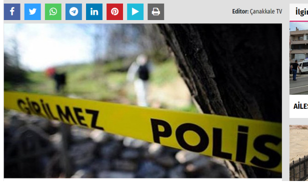
Şekil 4. Etik Görsel Kullanımı, (Çanakkale TV, 2024).

Biga'da öğrenildiğine göre bir kişi gece saatlerinde, boşanma aşamasındaki eşini katletti.