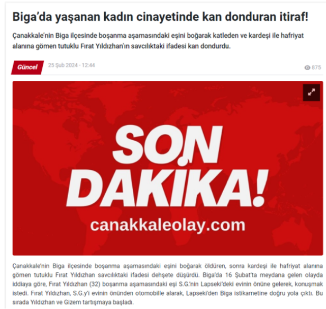
Şekil 2. Mağdur Yerine Failin Kimliğinin İfşası (Çanakkale Olay, 2024).

2022 yılında Çanakkale yerel medyada paylaşılan kadın cinayeti haberlerinde mağdur kadının kimlik bilgilerinin açık, failin ise kapalı bir şekilde verildiği, kadınların görsel kullanımında etik dışı unsurlar bulunduğu kayıt altına alınmıştır. Fakat 'Kadına Yönelik Şiddet Haberlerinde Sıfır Tolerans Projesi' kapsamında eğitimleri alan medya çalışanlarında bu konuda farkındalık oluştuğu gözlemlenmiştir. Örneğin; 'Çanakkale Olay Gazetesi' medya çalışanlarının, kadın cinayeti ve kadına yönelik şiddet haberlerinde mağdurun kimliği yerine failin kimliğini deşifre ettiği ve görsel kullanımında mahremiyete önem verdiği tespit edilmiştir.