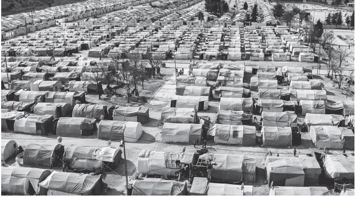
Görsel 2: Ai Weiwei, Nizip Kampı, Gaziantep, Türkiye, 2016

Mendes ile yaptığı röportajda (2022: 170) Ai Weiwei, kendisini mülteci olarak tanımladığını ve yerinden edilme deneyimini yakından anladığını söyler. Mülteci krizi ve yerinden edilme deneyimini kişisel bir perspektiften anlatarak, bu olayların gerçeküstü bir boyut kazandığını ifade eder. Weiwei, yaşadığı deneyimleri ve bu deneyimlerin insanlığın gerçekliğiyle nasıl çeliştiğini vurgular. Bu durumu, gerçeküstü bir montajla yankılanan bir gerçeklik olarak nitelendirir. Lastik botlarla gelen mültecilerin, Akdeniz'in turistik tatil beldesi imajının ötesinde, misafirperverlikle karşılanmaya çaresizce ihtiyaç duyan insanlar olduğunu belirtir ve bu nedenle söz konusu gerçeküstü gerçekliğin belgelenmesi gerektiğini düşünür ve "Human Flow" adlı eserini ortaya çıkarır. Weiwei, özellikle Midilli'ye yaptığı ziyaret sonrasında yaşadığı şok edici deneyimleri paylaşır. Binlerce kişinin Avrupa'ya ulaşma çabaları sırasında boğulması ve sınıra yaklaşmadan teknelerin itilmesi gibi trajik olaylar, bu gerçeküstü durumu daha da vurgular. Weiwei, bu olayları belgelemenin önemine vurgu yaparak, bu durumun kabul edilemez olduğunu dile getirir.