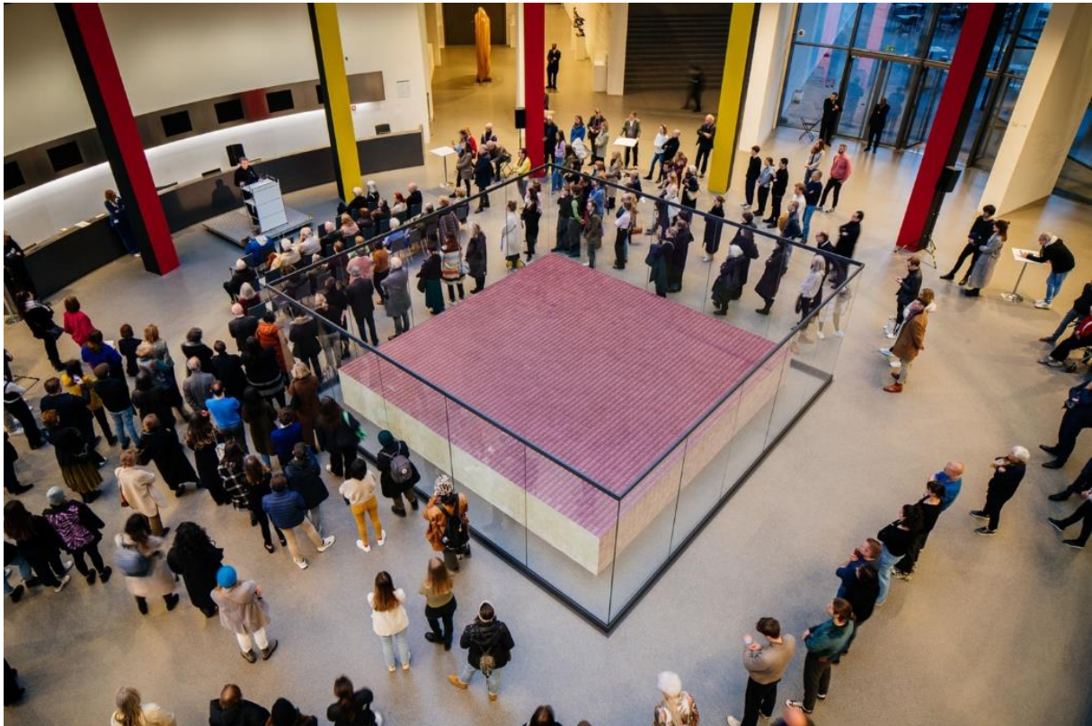
Görsel 1: Alfredo Jaar, One Million German Passports, Pinakothek der Moderne, Münih, 2023.

Alfredo Jaar temsil etiğini öne çıkarması aynı zamanda karmaşık sosyopolitik konular ve büyük ölçekli sorunlarla yüzleşmeyi beraberinde getirir. Bu çalışmalar, onun sessiz ve düşünceli yaklaşımıyla insan felaketlerine tanıklık ettiğini, askeri çatışmaların, siyasi yolsuzlukların ve ekonomik eşitsizliklerin etkisini gösterir. Jaar'ın en son çalışmalarından "One Million German Passports" enstalasyonu, Ukrayna'nın işgali ve Almanya'daki vatandaşlık konularını içerir (Görsel 1). Sanatçının merkezi kubbeli alanda sunduğu yüksek güvenlikli cam duvarın ardındaki Almanya'ya davet edilen kişi sayısını temsil ederken, aynı zamanda CDU'dan ayrılan ve sağcı AFD partisine oy verenlerin sayısını da içermektedir. Bu eser, iklim değişikliği ve devam eden çatışmalar nedeniyle artan mülteci krizine ve mültecilere kökenlerine bağlı olarak eşitsiz muameleye karşı vatandaşlık ve kimliği sorgular. Jaar'ın bu çalışması, Avrupa göç politikasındaki zorluklara ve güncel tartışmalara dikkat çeker, izleyicilere düşündürücü bir deneyim sunar (e-flux, 2023).