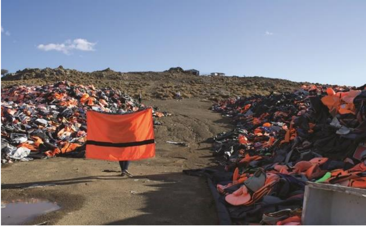
Görsel 3: Yara Said, The Refugee Nation Flag, 2016

2016 Yaz Olimpiyatları'nda yarışan on mültecinin bayrağı, sembolü ve dolayısıyla kimlikleri olmadığı için resmi Olimpiyat bayrağı ve marşı altında yarışır. Bir açıdan bakıldığında olimpiyatta yarışan sporcular, kendilerini sporcu olarak değil, aynı zamanda dünya çapında yerinden edilmiş 65 milyon insanı da temsil etmektedir. Dünya genelindeki milyonlarca mülteciyi temsil eden bu mülteci sporcuları Mülteci Ulusal Bayrağı'nı oluşturan Yara Said'e ilham verir (Görsel 3). Yara Said'in bayrağı basittir. Simge kullanmadan anlam içeren herhangi bir sembolizmi olmayan bayrak tasarlar (Dlugosz-Acton, 2017). Bu bayrak, hiçbir konumu olmayan, yalnızca kalıcı bir yuva arayan birçok bireyin bulunduğu yer olan sembolik bir ulusu temsil etmektedir. Tasarım, yaşamak için daha güvenli bir yer bulmak amacıyla topraklarından kaçan mültecilerin giydiği turuncu can yeleklerinden ilham almıştır. Bayrak milliyetçi bir sembol değildir. Sadece bir resim ve görsel bir obje olarak tasarlanmıştır. Yaşamın unsurları olan su, toprak, kum ve hava arasında yolculuk yapmak zorunda kalan tüm insanlar için bir işaret niteliği taşır. Tasarımın umut ve dayanışma duygusunu uyandırması ve mültecilerin sadece mağdur değil, aynı zamanda hayatta kalanlar ve savaşçılar olduğunu göstermesi amaçlanmıştır (Said, 2016).