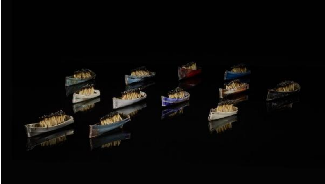
Görsel 5: Issam Kourbaj, Dark Water, Burning World, 2016

Batılı medyada Orta Doğu'daki acılara dair tekrarlanan görüntüler, izleyicilerin duyarsızlaşmasına neden olmuş durumdadır. Editörler ve fotoğraf ajansları, içerik konusunda egemenlik kurarak neyin gösterilmeye değer olduğunu belirlemekte, bu da gerçekliği yansıtmaktan ziyade belirli bir bakış açısını öne çıkarmaktadır. Bu durum, izleyicilerin çatışma hakkındaki algılarını etkileyerek şiddet içeren görüntülerin bir tür "yarışma" hâline gelmesine neden olmaktadır. Olayların trajedisini yansıtmaktan ziyade, abartılı ve yoğun görsel malzeme üreterek ilgi çekme eğiliminde olan bu yaklaşım, insanların travmatik olayları ve şiddeti daha da yoğun bir şekilde deneyimlemelerine yol açmaktadır. Bu bağlamda, "The Untitled Images" fotoğraf serisi, gerçeğin sanatsal varlığının veya yokluğunun toplumsal algıyı nasıl etkileyebileceğini sorgulayarak, gerçeği olduğu gibi göstermeden nasıl şekillendirebileceğimizi tartışır (Barakeh & Dreesen, 2020: 142-143). Çağdaş sanatın konumu göç üzerine odaklanarak radikal dışlamanın hem sanat dünyasında hem de siyasi arenada etkilidir. Ulusal, bölgesel ve sınırlarla ilgili önyargıları ortaya çıkarmak, göçün ve sanatın eleştirel bakış açılarıyla meydan okur. Ayrıca göç ve acı üzerine sanatın "Öteki"yi ele alma konusundaki sıkça tekrarlanan etik iddialar, yakından incelendiğinde, bu endişelerin zaman zaman bugünün göç rejimine karşı eleştirel bir bakışın önündeki engelleri nasıl oluşturabileceğini vurgular (Berggren, 2019:116).