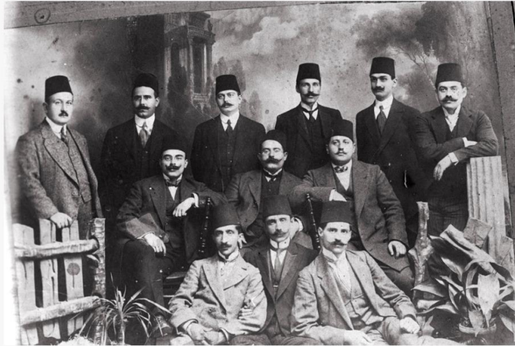
Şeyh Ata Efendi Karakol Cemiyeti üyeleri ile. Resimde orta sırada ikinci.