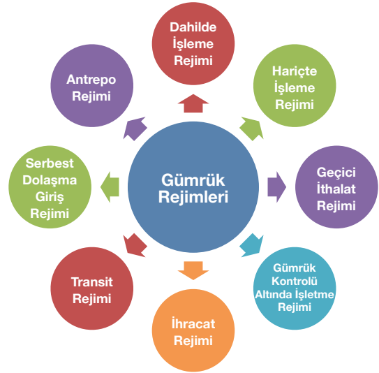
Şekil 1: Gümrük Rejimleri Tablosu

Şekil.1 de yer alan Gümrük Rejimleri Tablosunda bulunan Gümrük rejimleri, ekonomik etkili olan ve olmayan rejimler olarak iki farklı kategoride incelenebilir;