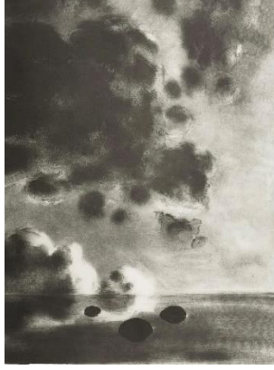
Resim 4. April Gornik, Remember the Sabbath Day, Litografi, 1987.

bu eserlerin çoğunda tipik bir dramatik araçtır; ışığa karşı gölge, yatay zemine karşı dikey unsur, dünyanın hareketsizliği ile atmosferin canlılığı, tekdüze düzlüğün altında çeşitlilik gösteren gökyüzü. ( Gilmore, 2005, s. 154)“