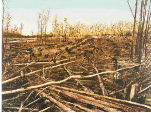
Resim 1. Kim Berman, Stripped Lowveld Plantation I, Litografi, 2010

Kim Berman, Güney Afrikalı bir baskı sanatçısı ve aktivist olarak sanatı; toplumsal ve çevresel adalet konularında bir araç olarak kullanmasıyla tanınmaktadır. Sanat kariyeri boyunca, çevresel sürdürülebilirliği ve sosyal adaleti ele alan eserler üreterek geniş bir izleyici kitlesine ulaşmıştır. Berman çalışmalarında bilinçli bir şekilde toprakla ilgili çevresel, sosyal ve politik konulara dikkat çekmektedir. Baskı sanatçısının tartışılacak imgelerinin unsurları, Güney Afrika manzarasının geleneksel Avrupa pitoreskine uymayan belirli alanlarıyla ilgilidir (Rall, 2000, s. 43) Berman'ın sanatı, görsel estetiği ile derin toplumsal mesajları bir araya getirerek, izleyicilere hem duygusal hem de düşünsel bir deneyim sunmaktadır.