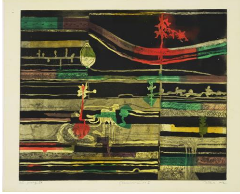
Resim 8. Gabor Peterdi, Germination I, Aquatint, Kuru Kazıma ve Gravür, 1952.

Peterdi, eserlerinde doğanın gücünü, karmaşıklığını ve sakinliğini ustaca bir araya getirerek izleyiciyi doğayla empatik bir ilişkiye sürüklemektedir. Bu, izleyici için doğayı sadece görmekle kalmayıp, onu hissetmeyi de sağlayan bir sanatsal deneyimdir.