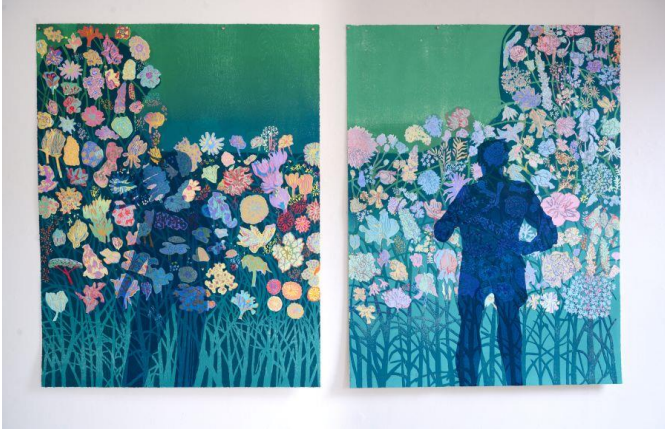
Resim 5. Tom Hammick, Garden in a Time of Loss I- II, Ağaç Baskı 2023.

Tom Hammick'in "Garden in a Time of Loss" adlı eseri, sanatsal bir ifadeyle doğanın ve insanın karşı karşıya olduğu çevresel ve varoluşsal krizleri ele almaktadır. Hammick, bu karmaşık gravüründe, iklim felaketlerinin en kötü sonuçlarını önlemek için gereken kararlardan kaçınan siyasi sistemin yarattığı umutsuzluğa karşı bireysel düzeyde bir direniş ve yeniden umut yaratma çabası sergilemektedir. Sanatçı, küçük bir eylemin, örneğin bir tarlada çiçek yetiştirmenin, yerel düzeyde olumlu bir değişimi nasıl etkileyebileceğini ve bu eylemin kişisel olarak hissettiği karamsarlık ve kasvetin bir kısmını nasıl ortadan kaldırdığını anlatmaktadır.