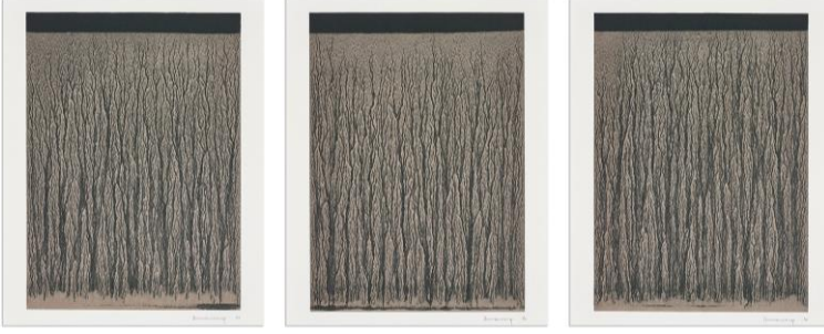
Resim 7. Richard Long, River Avon Mud Drawings, Litografi, 1998.

Long'un eserleri, minimalist ve geometrik formlarla dikkat çekmektedir. Doğadaki basit ve tekrar eden formları kullanarak, minimalist bir estetik oluşturmayı amaçlamaktadır. Bu da doğanın içsel düzenini ve ritmini yansıtmaktadır. Eserlerinde sıklıkla görülen daireler, çizgiler ve spiral formlar, doğanın kendiliğinden ortaya çıkan geometrik yapısını ifade ederken; doğa zamanının, yavaş ve sürekli değişiminin izlerini taşımaktadır.