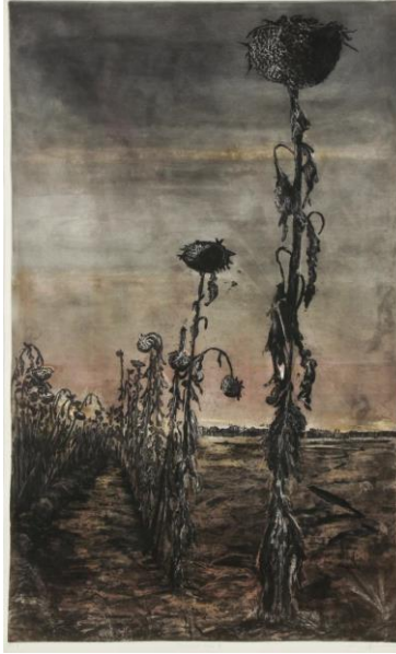
Resim 2. Kim Berman, Mourning Our Future, Monobaskı ve Kuru Kazıma, 2006.