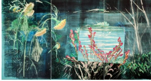
Resim 9. Michael Mazur Wakeby Night, Monotype, 1983.

Michael Mazur, doğa temalı eserlerinde, doğal dünyayı derinlemesine ve çok boyutlu bir şekilde keşfetmiştir. Mazur'un eserlerinde doğa, sadece bir arka plan veya temsil nesnesi olarak değil, aynı zamanda bir yaşam ve varoluş deneyimi olarak öne çıkmaktadır.