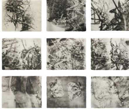
Resim 6. Kiki Smith, Fog, Polymer Gravür, 2009.

figürleri ve kozmik unsurlar yer almaktadır. Sanatçı, doğanın döngüselliğini ve sürekli değişimini işlerken, bu sürecin insan yaşamıyla olan paralelliklerini aktarmaktadır. Smith'in eserlerinde doğa, bir yandan hayatın kaynağı ve besleyicisi olarak, diğer yandan ise bilinmeyen ve gizemin sembolü olarak karşımıza çıkmaktadır. Sanatçı, doğayı sadece bir ilham kaynağı olarak değil, aynı zamanda insanlık tarihinin ve kolektif bilinçaltının bir parçası olarak görmektedir.