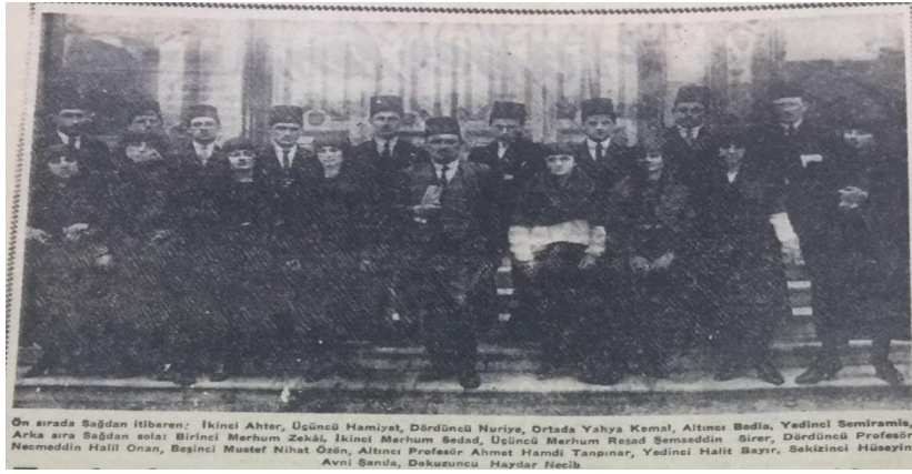
Görsel 7: 9 Kasım tarihli haberde kullanılan görselde Ahmet Hamdi Tanpınar'ın da aralarında yer aldığı erkek ve kız öğrenciler ortada hocaları Yahya Kemal ile birlikte (Yeni İstanbul, 1958b: 4)

Hastalık, vefat, cenaze töreni ve sonrasına dair Yahya Kemal'e ilişkin kayda değer son haber 9 Kasım tarihinde yayımlanmıştır. Hüseyin Avni Şanda tarafından kaleme alınan köşe yazısına "Türk Kızları İlk Defa Yahya Kemal'in Dersinde Erkeklerle Yan Yana Oturdu" başlığı atılmıştır. Devamında ise şairin mütareke döneminde İstanbul Üniversitesi Edebiyat Fakültesinde Garp edebiyatı hocası olarak çalıştığına, verdiği derslerde gösterilen yüksek ilgiye, hocalık yaşantısındaki gelişmelere değinilmiştir. Yahya Kemal'in erkeklerin ve kızların ayrı ayrı olmak üzere sabah ve öğleden sonra ders görmelerini ayıp addettiği için cinsiyet fark etmeksizin bir çatı altında öğrencilerini bir araya getirdiği anlatılmıştır.