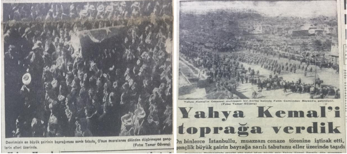
Görsel 5-6: Yahya Kemal'i Toprağa Verdik (Yeni İstanbul, 1958a: 1).