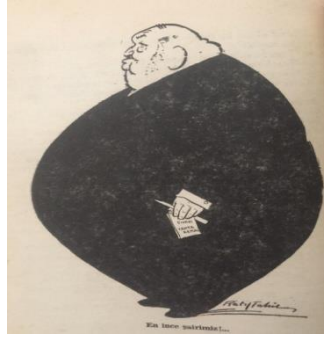
Görsel 1: En İnce Şairimiz! (Yücebaş, 1953: 96)

da devamında oluşacak sağlık sorunları için bu durum sadece başlangıç sayılabilirdi (Belger, 1959: 119-121).