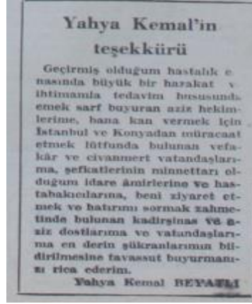
Görsel 4: Yahya Kemal'in teşekkürü (Yeni İstanbul, 1950: 2)

Yeni İstanbul 'da Yahya Kemal'e dair rastlanan kayda değer diğer haberlerin ölümü, cenaze töreni, vasiyeti ve onun hakkında yazılanlarla alakalı olduğu görülmüştür. Bu materyaller de dönem içerisinde gazeteye özgün olduğundan bunlara işaret etmek çalışmanın bütünlüğü açısından gerekli görülmektedir.