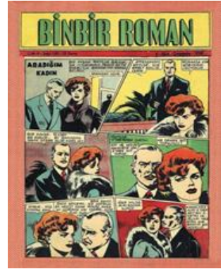
Görsel 10. 1001 Roman, 3 Mart 1946, ÖS 75; Binbir Roman, 4 Ekim 1950, 125.

Çocuk Haftası: 2 Sonkanun (Ocak) 1943'te İstanbul'da haftalık olarak yayınlanmaya başlamıştır. Her hafta cumartesi günleri çıkarılan dergi, resimli çocuk gazetesi olarak kendisini tanıtmaktadır. 16 sayfa halinde çıkarılan dergi için 5 kuruşluk bir fiyat belirlenmiştir. Dergi yayın hayatına bir dönem ara vermiş olsa da 1964 yılına kadar yayınına devam etmiştir. 1943-1950 yılları arasında 374 sayı, 1958-1964 yılları arasında 318 sayı yayınlanan