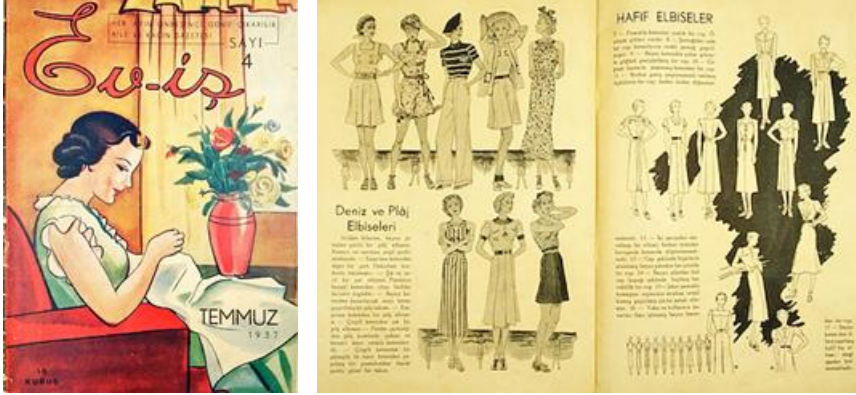
Görsel 14. Ev-İş , Temmuz 1937, 4.

eden bir yer” olduğu değerlendirmesinde bulunarak, Ev-İş dergisini çıkarılmaktaki amacını, Cumhuriyet rejiminin dayanağı olan “Ev’e inmek ve ona zamanın ihtiyaçlarına göre düzen vermek lazımdır.” diyerek açıklar (Özen, 1990: 38-40). Dergide yer alan yazılarda kadının evde, işte, köyde, kentte, üretici olması gerektiği sıklıkla vurgulanır. Ayrıca yemek, örgü, dikiş-nakış, moda, güzellik, görgü kurallarına, hikâyelere, okur mektuplarına ve kadın kuruluşlarıyla ilgili haberlere dergide sıklıkla yer verilmiştir.