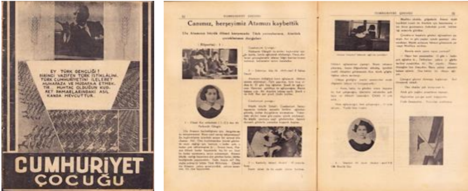
Görsel 9. Cumhuriyet Çocuğu, 12 Birinciteşrin/Ekim 1938, 3.