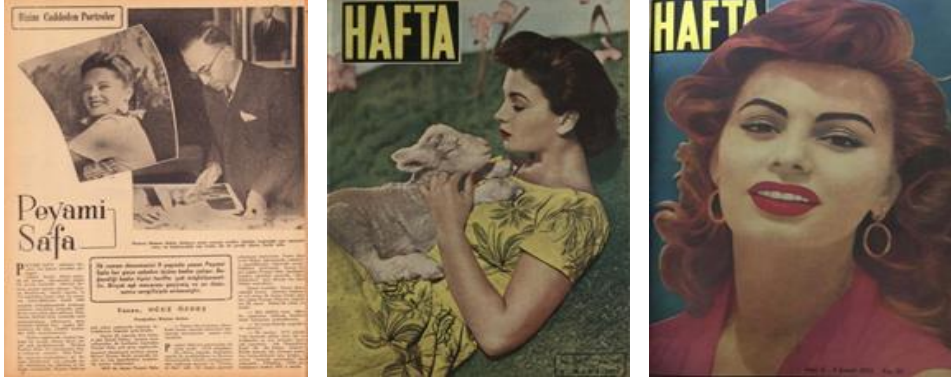
Görsel 16. Hafta , 24 Mart 1950, 26; 9 Mart 1951, 76; 4 Şubat 1955, 5.