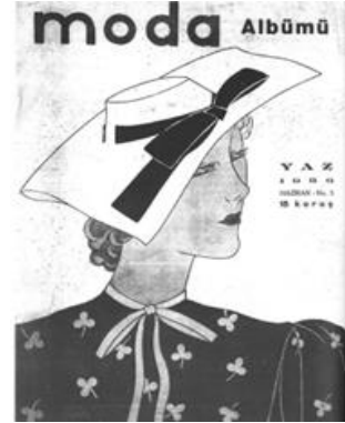
Görsel 13. Türkiye Yayınevi 1950 Kataloğu, 1950. Moda Albümü, Haziran 1936, 3.