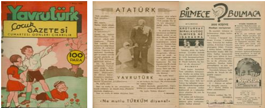
Görsel 8. Yavrutürk , 2 Mayıs 1936, 1.

Yavrutürk: 2 Mayıs 1936 tarihinde yayınlanmaya başlayan Yavrutürk , 19 Aralık 1942'ye kadar yayın hayatına devam etmiştir. Sahipliği, yazı işleri müdürlüğü ve genel yayın yönetmenliğini Tahsin Demiray; yazı ve teknik işler sekreterliğini de Rakım Çalapa yapmıştır. Basıldığı yer Türkiye Basımevi,