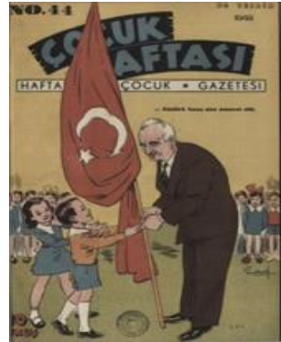
Görsel 11. Çocuk Haftası, 2 Sonkanun/Ocak 1943, 1; 30 Teşrin/Ekim 1943, 44.