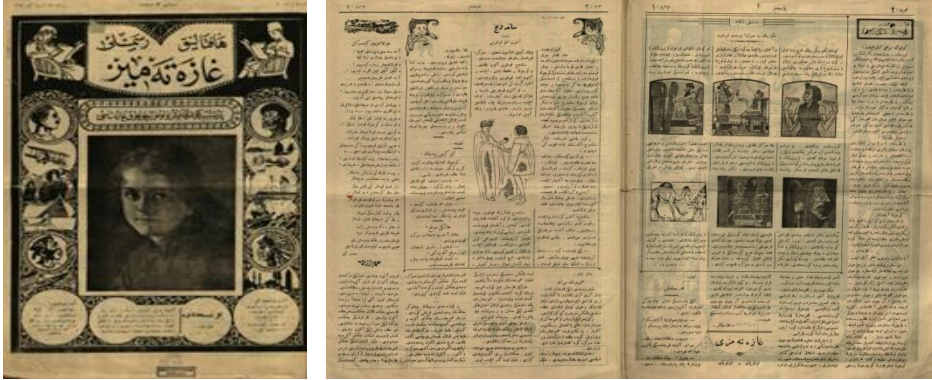
Görsel 5. Haftalık Resimli Gazetemiz, 14 Teşrin/Kasım 1340/1924, 1.

Dergi, yayın hayatına son verdiği 1 Ocak 1925'e kadar toplam 7 sayı çıkarılabildiği. Yazar kadrosu öğretmenlerden oluştuğu için, yazar adlarına pek yer verilmemiş veya takma adlar kullanılmıştır. İçeriğinde hikâye, haber metni, bilmece, şiir, diyalog, masal, makale, deneme, fıkra, biyografi, tiyatro ve anı türleri bulunmaktadır. Ayrıca duyuru, ilan ve açıklama gibi kısa yazılar da mevcuttur. Ahlaklı ve erdemli olma, bilim ve teknoloji, doğa ve çevre, müzik, çeşitli kültürel unsurlar, eğlence ve milli duygular üzerinde durulmuştur. Ayrıca çocukların gönderdiği anı türünde yazılara da dergide yer verilmiştir (Kadızaade ve Kılıç, 2021: 15-16).