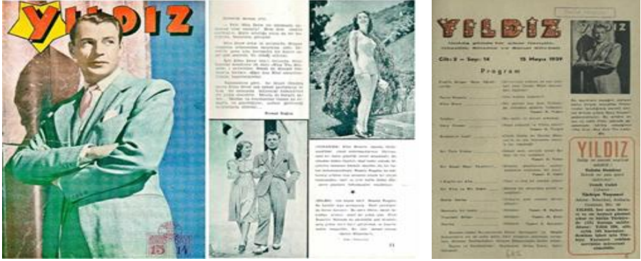
Görsel 15. Yıldız, 15 Mayıs 1939, 14.

pakta yer verilmiştir. Ayrıca içerikte çok sayıda mayolu yabancı kadın resimlerine yer verildiği de görülmektedir (Akin, 2019: 55-75).