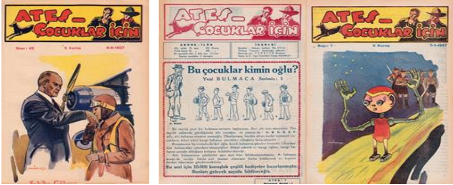
Görsel 7. Ateş , 9 Eylül 1937, 42; 7 Ocak 1937, 7.

Türkiye Yayınevi tarafından yayınlanmış ve Türkiye Basımevi tarafından basımı yapılmıştır. Sahipliğini ve yazı işleri direktörlüğünü Tahsin Demiray yapmıştır. Diğer dergilere benzer konular işlenmiş ve anlatımlar, hikâyeler renkli çizgi resimlerle desteklenmiştir. Ateş dergisinin büyükler için düşünülmüş bir çizgi romanı yayınlaması, çocuk dergiciliğinde bir yenilik olarak kabul edilir. Bunun yanı sıra diğer çocuk dergilerinden farklı olarak Batı kaynaklı çizgi romanların kopyalarını Türkçeye uyarlayarak yayınlanması büyük ilgi görmesini sağlayacaktır. Örneğin Lee Falk'un ünlü kahramanı Mandrake, Türkçeye ilk kez Şimşek Adam adıyla Ateş 'te uyarlanarak yayınlanacaktır. Daha sonra bu yöntem diğer çocuk dergileri tarafında da kullanılacaktır. Dergi 1960'ta yetişkin okurlara hitap eden Büyük Ateş adıyla tekrar yayınlansa da 28 sayı çıkararak yayın hayatını sonlandırmıştır (Cantek, 2014: 63).