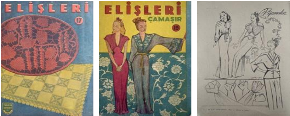
Görsel 16. Elişleri , Temmuz 1946, 17; Mart 1947, 19.