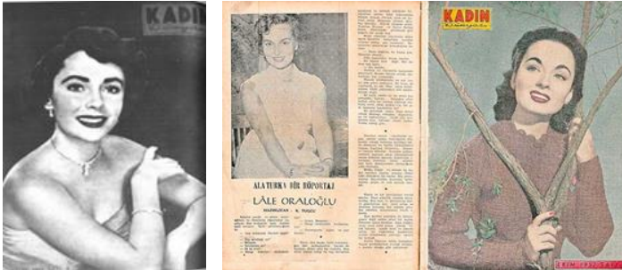
Görsel 17. Kadın Dünyası , Eylül 1952, 5; Ekim, 1952, 6.