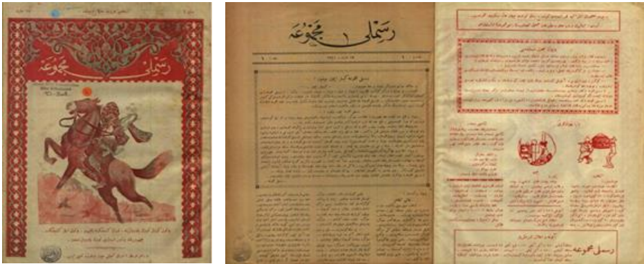
Görsel 6. Resimli Mecmua, 18/19 Mart 1925, 1.