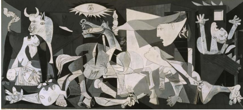
Resim 6. Guernica-Pablo Picasso (Pablo Ruiz Picasso)-1937

Toplayanlar'ından bu yana acı çekenin ya da ezilenin izleyiciyle güçlü bir bağı yoktur. Acıyı temsil eder, güçlü bir şekilde yansıtır ama orada birey olarak var olmaz, acıyı çağırıştırır, doğrudan göstermez. Tıpkı Namık İsmail'in Harman yapıtında olduğu gibi; tarlada çalışanlar izleyici ile doğrudan iletişim kurmaz, gerçekliği vardır, o gerçekliği sunar ve yoruma açıktır. Popülist bir amaca hizmet etmez (Resim 4). Medya, toplumun temsili, popülerlik, gösterimler nesneleştiği an sanatın sosyo-kültürel argümanları güç kaybetmeye başlar (Duncum, 2009). Bu güç kaybetme yani medyanın toplumların belirli yönlerini içeren temsili anlamı indirger, empatiyi yok eder ve bireyleri duygusuzlaştırır. Bu noktada sanat medyanın daha fazla ilgisine ihtiyaç duyan bir nesnellığı barındırmaya başlar.