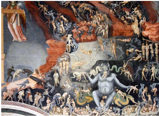
Resim 3. Son Yargı-Last Judgement 1306 (Fresk-Giotto di Bondone)

Sanat kimi zaman aristokrasiye kimi zaman kiliseye hizmet ederek de bu toplumsal misyonu önemli ölçüde üstlenmiştir (Hauser, 1999, s. 124). Kitleleri, aristokrasi ve kilise etrafında ikna etmenin önemli bir yolu olarak kamusal alan pedagojisinin köklerini orta çağda ve kimi sorgulamalar ışığında sonrasında rönesans döneminde bulmak olasıdır (Resim 3). Ancak 1800'lü yıllardan sonra sanatın ana odağının orta sınıfa ve bu sınıfa ait zevklere kaydığını görmek söz konusudur (Clark, 1984, s. 78). Bu süreçte yansıtma ve inkar etme arasında gelip giden bir kaos durumu söz konusudur (Berger, 1972, s. 53). Yansıtma toplumsal gerçekliği içerirken aynı zamanda kültürel miras olarak çok tehlikelidir (Williams, 1983, s. 45). Bu durum özellikle toplumsal gerçekçi sanat ve sanatçıların yerilmesi, ötekileştirilmesi ya da uzun süre görmezden gelinmesi ile karşımıza çıkar (Danto, 1986, s. 61). Ancak yüzyıllar sonra dahi olsa sanat içinde bulunduğu dönemde sorgulatmayı hedeflediği olguyu güçlü bir gerçeklikle günümüze taşır (Nochlin, 2001, s. 89). Bu önemli bir misyondur ve bu noktada referans kültür ve baskın kültür arası etkileşimlerde sınırlar ortaya koyma, sorumluluk alma, ya da sınırlılıkların üzerine gitme yolu ile güç odaklarının sorumluluk almayı reddetmelerinde önemli bir tehdittir (Bedir Erişti, S.D. (2024). Sanatın Sosyo-Kültürel Uzantıları ve Sanat Eğitiminde Kamusal Alan Pedagojisi. Batı Anadolu Eğitim Bilimleri Dergisi, 15(3), 2718-2740. DOI. 10.51460/baebd.1538289