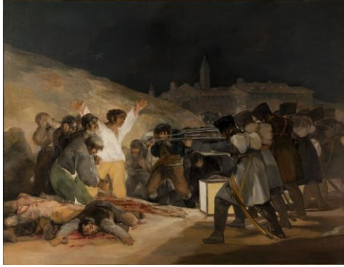
Resim 1. 3 Mayıs 1808-Goya (Prado Müzesi/İspanya)

aralar. Sanat içindeki eylemsel yapı bireyler için eleştirel düşünme ve sorgulamaya ciddi argümanlar hazırlayan bir düşünsel süreçtir (Habermas, 1984, s. 120; Foucault, 1977, s. 29).