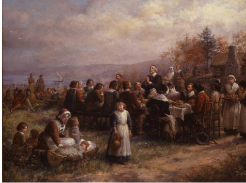
Resim 3. Jennie Augusta Brownscombe, Plymouth'da Şükran Günü-Thanksgiving at Plymouth, (1925- National Museum of Women in the Arts)

(Eagleton, 1990, s. 33). Bu tehdit toplumun kendisine tutulan bir ayna olarak aydınlığa açılan bir yolu da temsil etmektedir (Adorno, 2002, s. 112).