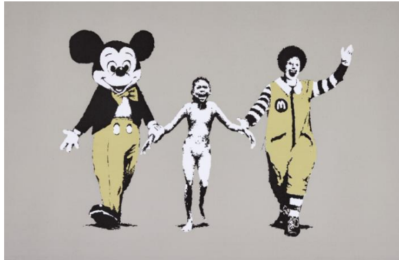
Resim 4. Namık İsmail-Harman, 1923 Resim 5. Banksy, Napalm, 2004

Popüler kültürün cazibesi de sanatın güçlü bir sosyo-kültürel bağlamıdır. Bu zaman zaman sanatçıları besler zaman zaman ise içinde bulunduğu toplum ile arasına mesafe koyar. Örneğin Banksy'nin Napalm patlamasından kaçan Vietnamlı çocuğun şok edici tasviri popüler zevklerin güçlüce hissedildiği bir yapıttır (Resim 5). Bir başka eseri "Mülteci Teknesi, 2016" ise göç edenlere dikkat çekmek amacının altında anın vahşetinin insanlarda oluşturduğu zevki içerir. Yani popüler zevklerle acının indirgenmesi bu eserlerde yoğun bir biçimde hissedilir. Yapıt eleştirel sorgulama misyonunu popülerlik ile güçlü bir biçimde kaynaştırmaktadır. Oysa toplumsal gerçeklik bağlamında Millet'in Başak Bedir Erişti, S.D. (2024). Sanatın Sosyo-Kültürel Uzantıları ve Sanat Eğitiminde Kamusal Alan Pedagojisi. Batı Anadolu Eğitim Bilimleri Dergisi, 15(3), 2718-2740. DOI. 10.51460/baebd.1538289