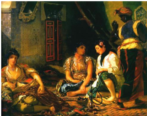
Resim 2. Cezayirli Kadınlar-Delacroix (Women of Algiers in Their Apartment)

Sanatın sosyo-kültürel uzantılarına ve bağlamlarına kimi örnekler üzerinden bakmak olasıdır. Örneğin Goya'nın İspanya iç savaşına gönderme yapan 3 Mayıs 1808 isimli eseri, İspanya'nın bu tarihi olayının tasvir edildiği ünlü bir sanat eseridir. Madrid'de gerçekleşen bu katliamda, ülkeyi işgal eden Napolyon ordusuna karşı ayaklanan isyancıların idam edilişi gösterilir. Goya'nın eserinde, insan dramına yakından odaklanan Fransız romantizminin ortaya koyduğu güçlü bir sosyo-kültürel uzantı söz konusudur. Aynı zamanda toplumsal yapının ve o toplum içinde bireylerin çaresizliğinin adeta bağırarak izleyici ile buluştuğunu görmek söz konusudur. Çünkü resimde vurulan insanların yanında kendilerinin başına gelecek olanı anlık olarak gören ve aynı kaderi paylaşacak olan diğer insanların dehşeti de verilmektedir. Bu sahne insan duygularının toplumsal bir olay ile birleştirilerek yansıtıldığı ve en uç noktalarının gösterildiği bir betimlemedir (Boime, 2001, s. 78; Hagen & Hagen, 2003, s. 156). Mayıs 1808 olaylarının ve İspanyol Bağımsızlık Savaşı'nın sembol resimlerinden olan eser İspanya Madrid Prado Ulusal Güzel Sanatlar Müzesinde bulunmaktadır (Resim 1). Eserin içinde bulunulan dönemi sorguladığı bir gerçektir ancak bir başka gerçeklik ise yüzyıllar sonra dahi o dönemdeki toplumsal süreçlere farklı bakış açıları ile bakmanın yollarını sunan bir eser olarak etkisini günümüzde de hissettirmekte olduğudur.