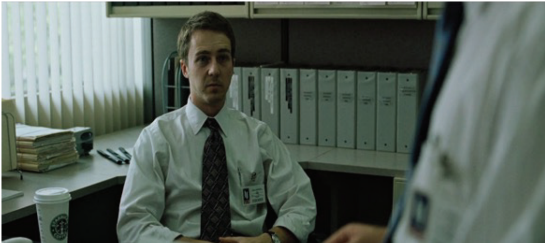
Şekil 4. Kesit:00. 04.23. Ofis / Stresli iş hayatı sahnesi.

Bu tabloda (Şekil 4, Tablo 3), “gösterge” sütunu stresli iş hayatını ifade eden sembol ve işaretleri içerirken,