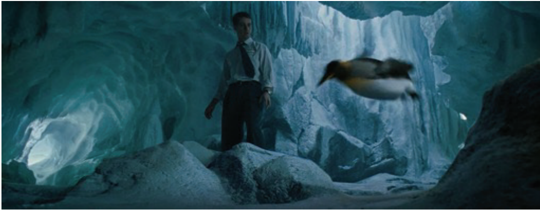
Şekil 2. Kesit: 00.10.52. Jack'in zihnindeki Mağarası / Dövüş Kulübü terapi sahnesinde Jack'in beyninin derinliklerine yolculuk.

Tyler Durten'in toplantı sırasında ifade ettikleri erkeklerin yaşamdaki bölünmüşlüklerinden bahsetmektedir. Erkeklerin iş performansları ve hayat yaşamları toplumsal algının jenerasyonlar üzerindeki baskısı ile şekillenmiştir. Bunun sonucunda psikolojik anlamda bireylerde sağlıksız durumlar gösterilmektedir. Bu neticeler ile erkeklerin yaşam anlamlarını ve kişisel tatminlerini sorgulamaları hedeflenmektedir. Toplum dayatmaları aksine bu normları yıkabilmeyi ve kendi amaçlarını hissetmek istedikleri için doğru bir noktada buluşmaları arzulanmaktadır. Aynı zamanda etkilerden sıyrılmayı öğrenmeleri ve kurtulmaları