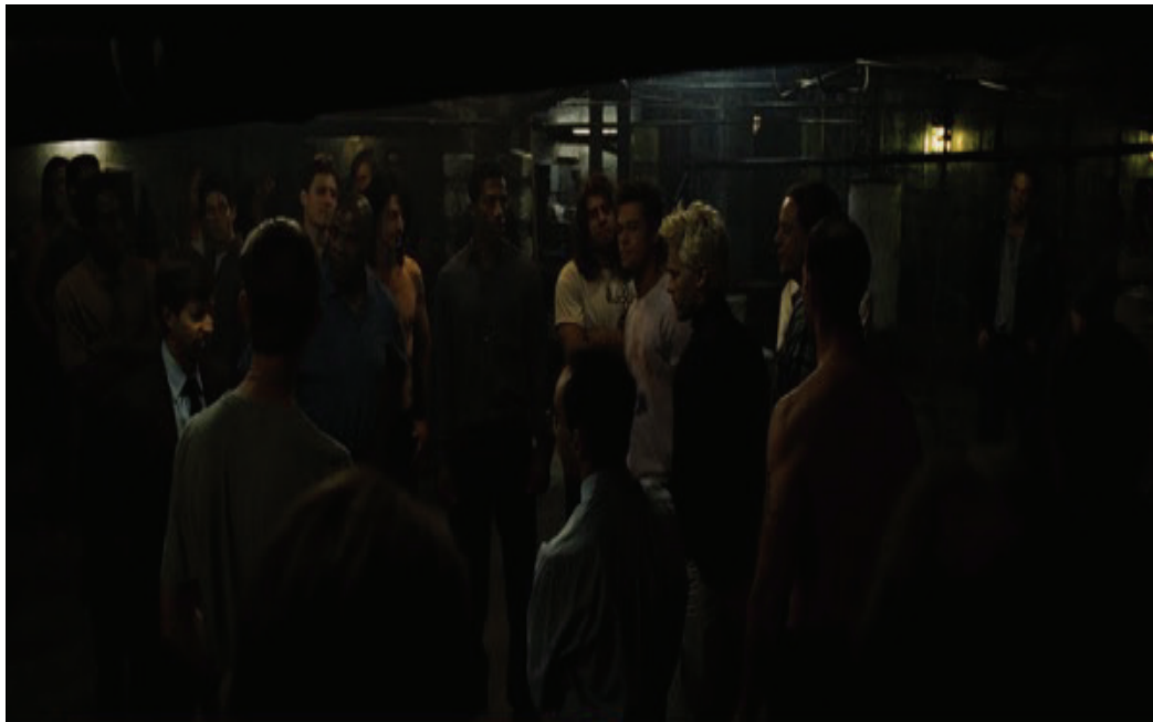
Şekil 1. Kesit:01.09.51. Bardaki bodrum kat / Dövüş Kulübü toplantı sahnesi.

Tyler karakteri ile anlatılmak istenen yirmi birinci yüzyılda erkek algısının yadırganmasıdır. Tüketim kültürü ve modern yaşam, erkekliği belli bir kalıba sığdırır. Tek bir amaç için zaman sarf etmesini ve bunun sonucunda eline geçen kazanç ile içinde bulunduğu tüketim kültürünün dayatmalarını yerine getirerek tamamlanmış olacakları öğretilmiştir. Bu öğretiye karşı duran Tyler, bu durumu kabul etmemektedir. İkinci Dünya Savaşı sonrası 1950’lerin başında banliyö gençliği olarak adlandırılan kültür, tüketim odaklı bir yaşamın yükselişine geçmiştir. İnsanların kararlarında söz sahibi olan kapital bireyleri yalnızlaştırıp yozlaştırmıştır. Günümüzde de bu durumu yaşayan ve sisteme hizmet eden bir nesil vardır ve doğmaktadır.