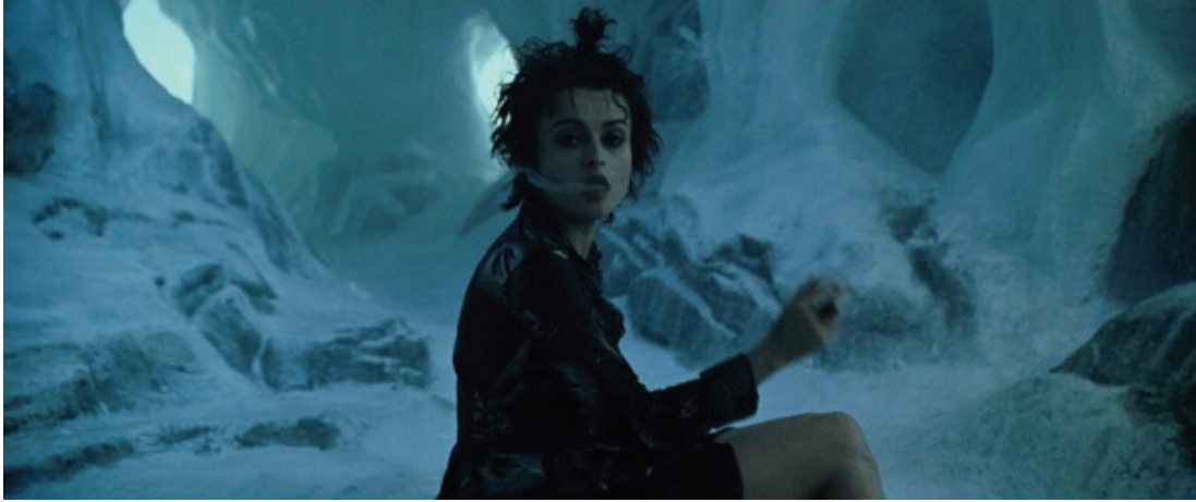
Şekil 3. Kesit:14.43.00. Dövüş Kulübü, Jack zihninde Marla Singer ile karşılaşması.

için bilinçlenmeleri gerektiğinin farkına varmaları sağlanmaktadır. Kendi duygu ve birikimlerine bağlı kalarak daha sağlıklı bir yaşam biçimi keşfetmeleri istenmektedir.