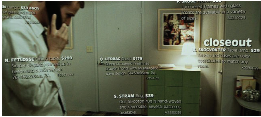
Şekil 7. Kesit:00.05.22. Ev / Jack evinin mutfağına doğru yürüdüğü sahne.