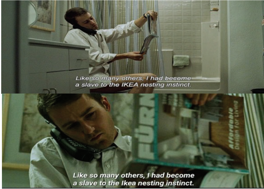
Şekil 6. Kesit:00.04.48-55. Evin Banyosu / Jack evinin klozetinde oturduğu sahne.