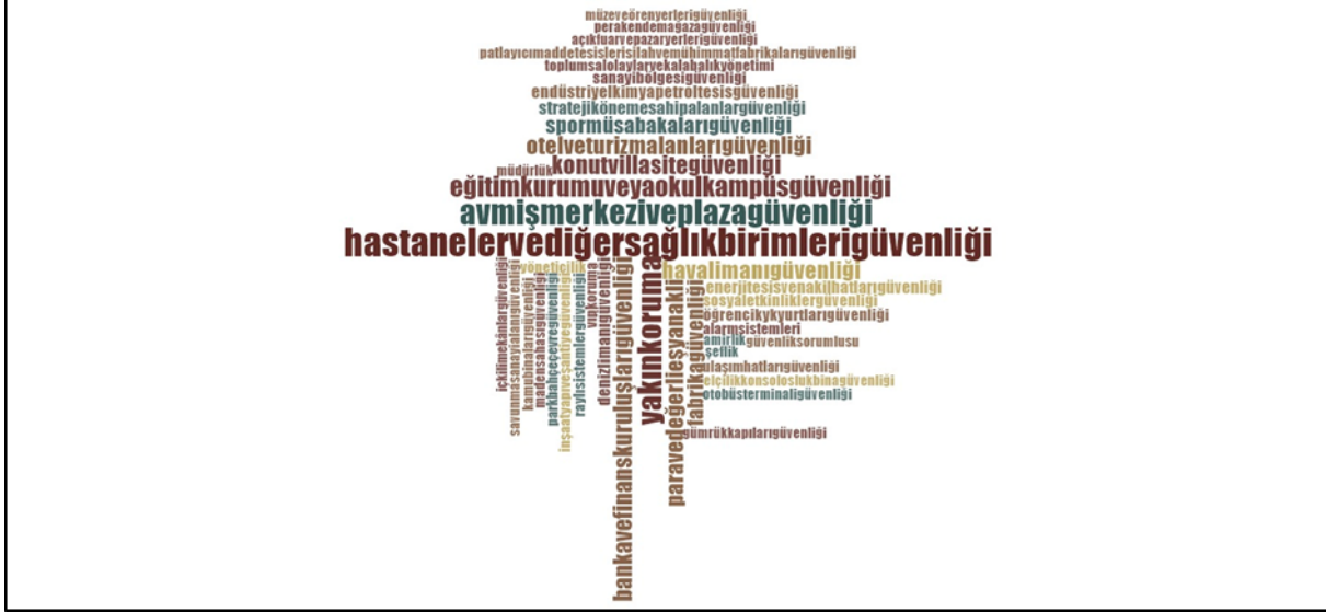
Şekil 1. Katılımcılar tarafından araştırmanın ikinci sorusuna verilen cevaplara ilişkin kelime bulutu

Kodlanan uzmanlık alanlarının büyük çoğunluğunun tüm katılımcılar tarafından ifade edilmiş olduğu anlaşılmaktadır. Uzmanlık alanı olarak ifade edilen "Hastaneler ve Diğer Sağlık Birimleri Güvenliği", "AVM, İş Merkezi ve Plaza Güvenliği", "Yakın Koruma", "Eğitim Kurumu veya Okul Kampüs Güvenliği" ve "Konut-Villa-Site Güvenliği" en sık tekrarlanan beş ifade olarak dikkat çekmektedir. Bununla birlikte "Alarm Sistemleri" sadece KKKY ve özel güvenlik görevlileri tarafından ifade edilmiştir. Ayrıca "Yöneticilik", "Amirlik", "Şeflik", "Müdürlük" ve "Güvenlik sorumlusu" gibi yöneticiliğe ilişkin hususların da kurucular hariç diğer katılımcılar tarafından uzmanlaşma alanı olarak ifade edilmiş olması dikkate değer görünmektedir (Bkz. Şekil 2; Tablo 4).