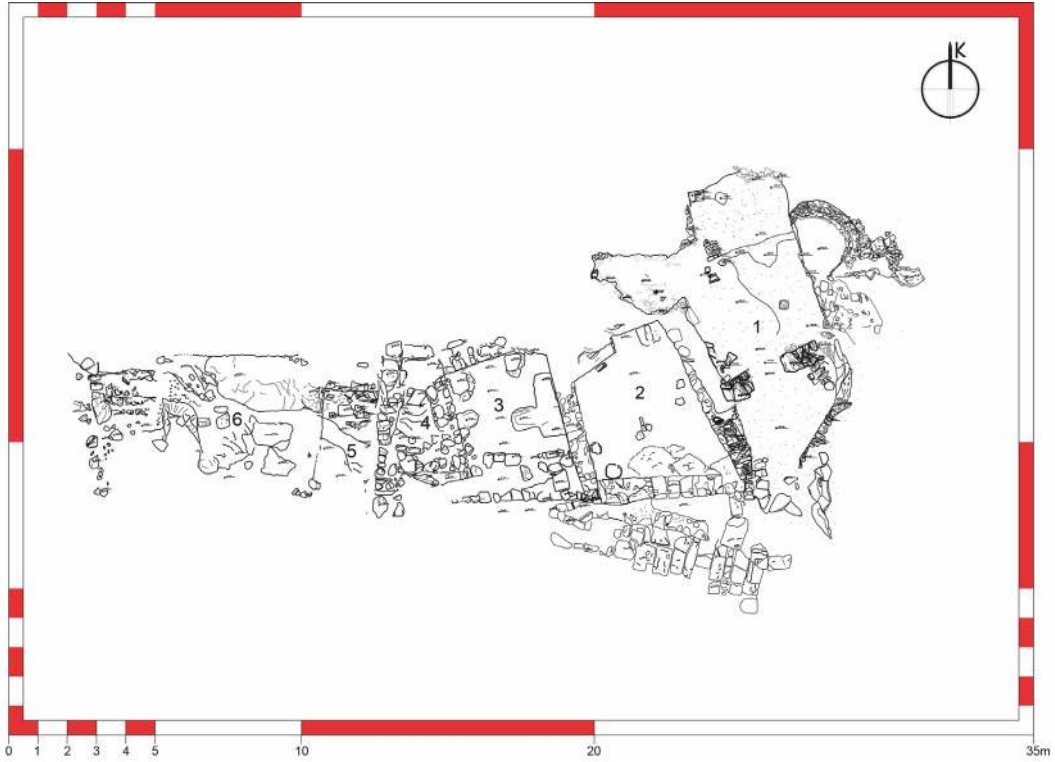
Fig. 1: Yamaç Hamamı'nın Kuzeyinde (YHK) açığa çıkartılan mimari kalıntıların planı.