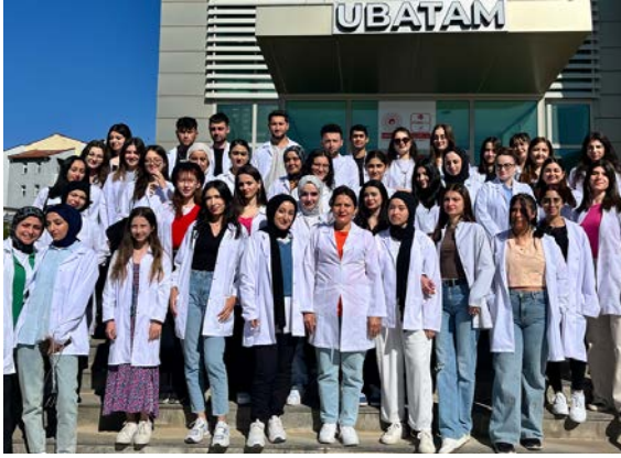
Şekil 1. Araştırmaya katılan grubun UBATAM'da eğitime başlamadan hemen önceki fotoğrafı (15 Mayıs 2024).

Banaz Meslek Yüksekokulu Bahçesinden öğrenciler 8.30 da Uşak Üniversitesine ait resmi araçlar ile alınarak UBATAM'a ulaştırılmıştır. Şekil 1'de araştırmaya katılan grubun UBATAM önündeki fotoğrafı sunulmuştur.