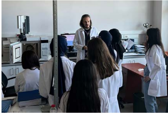
Şekil 2. 7 kişilik öğrenci grubunun Perkin Elmer Spectrum Two FT-IR Spektrofotometri cihazı eğitimi fotoğrafı.

UBATAM girişinde yetkililer tarafından öğrencilere iş sağlığı ve güvenliği ve iş hijyeni hakkında kısa ve etkin hatırlatma yapılmıştır. Cihaz eğitimleri UBATAM personeli 3 Akademisyen tarafından gerçekleştirilmiştir.