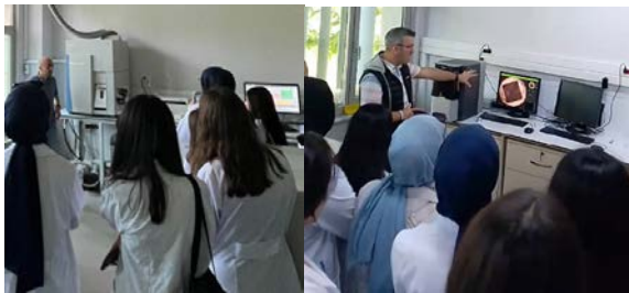
Şekil 3. Öğrencilerin gruplar halinde Thermo Scientific ICap Q ICP-MS (solda) ve Phenom Marka Prox Model masaüstü Taramalı Elektron Mikroskobu (sağda) eğitimi fotoğrafları.

Öğrenciler 6-7 kişilik gruplar oluşturarak cihaz eğitimi almışlardır. Şekil 2 ve 3 de öğrenciler eğitim alırken görülmektedir.