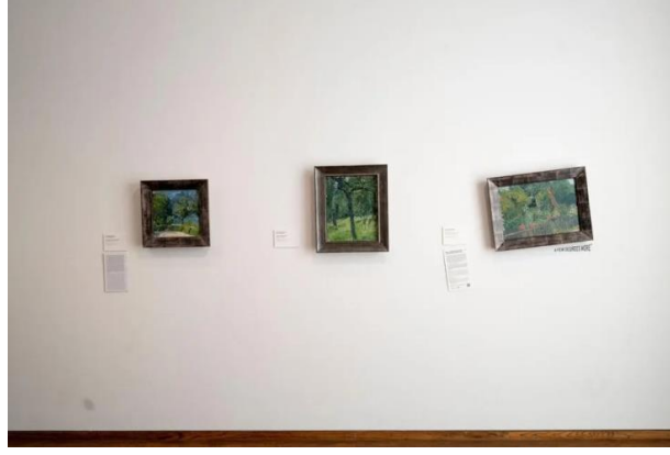
Görsel 2. Viyana Leopold Sanat Müzesi, Birkaç Derece Daha Yüksek Sergisi (Dara, 2023).

Küresel ısınmaya 2023 yılı içerisinde dikkat çekerek sergileme işleviyle farkındalığa dair temaları birleştiren Viyana Leopold Müzesi ise, koleksiyonundaki 15 sanat eserinin galeri duvarlarındaki pozisyonunu iklim değişikliğine dikkat çekmek için değiştirdiği bir sergi düzenlemiştir. Birkaç Derece Daha Yüksek isimli sergide, tablolar birkaç derece eğik asılarak ziyaretçilere sunulmuştur (Görsel 2). Sergileme fonksiyonuyla birlikte ele alınan Leopold Sanat Müzesi'ndeki girişim, sanat müzelerinin özgün kimlikleriyle farkındalık yarattığı nitelikli bir örnektir.