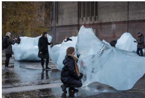
Görsel 1. Olafur Eliasson, Ice Watch Sergisi (Yalçınkaya, 2018).

Tate Modern Sanat Müzesi, 2019 yılında iklim değişikliğine yönelik farkındalık yaratma adına gerçekleştirilen etkili bir sanat etkinliğine ev sahipliği yapmıştır. Olafur Eliasson adlı sanatçının Ice Watch ismini taşıyan sergisi, Grönland açıklarından alınan farklı boyutlardaki gerçek buz kütlelerinden oluşmuştur (Görsel 1). Londra'nın merkezinde ziyaretçilerin bakışları arasında eriyerek kaybolan buz kütleleri, küresel ısınma dolayısıyla buzulların hızla eridiğini vurgulayarak durumun insanlığın geleceği için çarpıcılığını etkili bir şekilde hatırlatmıştır. Tate Modern gibi kabul görmüş ve öne çıkan bir sanat müzesinin, küresel ısınma konusunda farkındalık temalı sanat etkinliklerine yer vermesi, kurumsal ölçekte güçlü bir inisiyatif alanı açmaktadır.