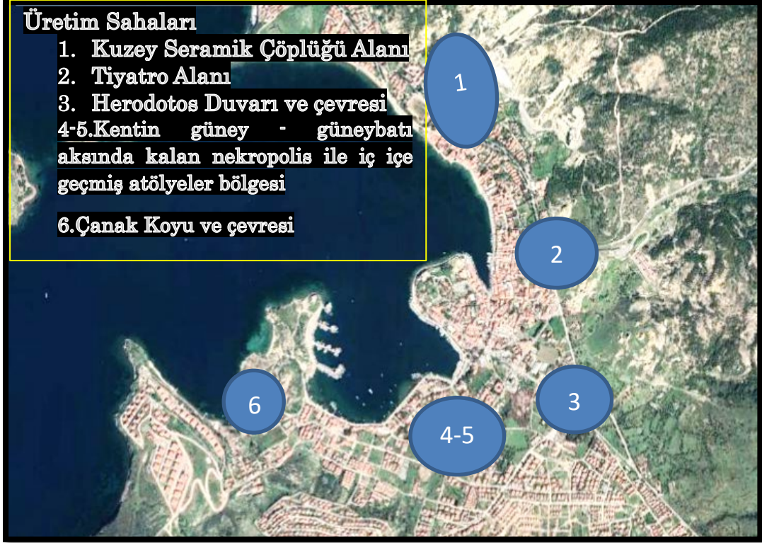
Fig. 1: Değerlendirmeye alınan Phokaia seramik üretim alanları.