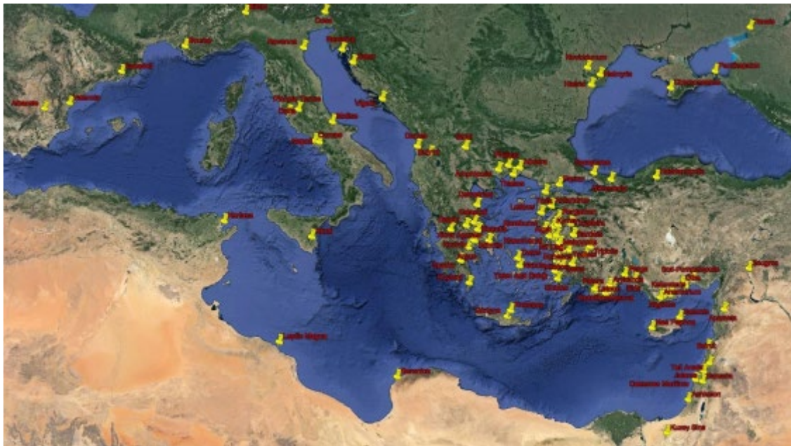
Fig. 4: Phokaia tipi mutfak kaplarının dağılım alanı (Uğuz Yapıcı, 2024, 725, Harita 5).