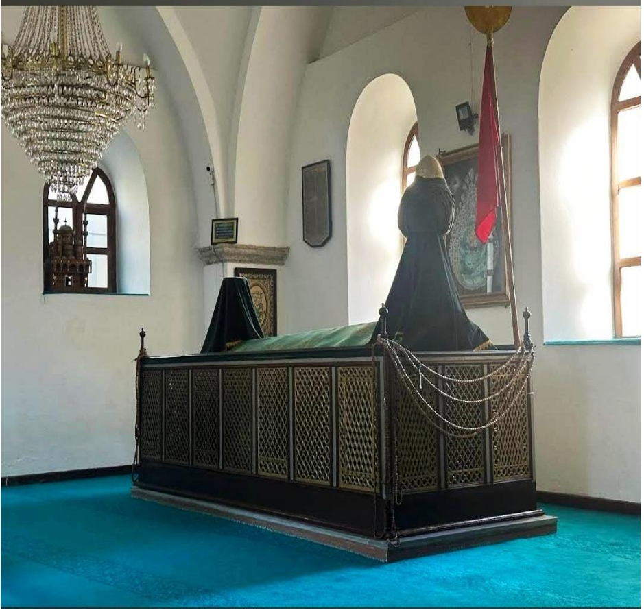
Ek 2: Seyyid Bilal Hazretlerinin Türbesi