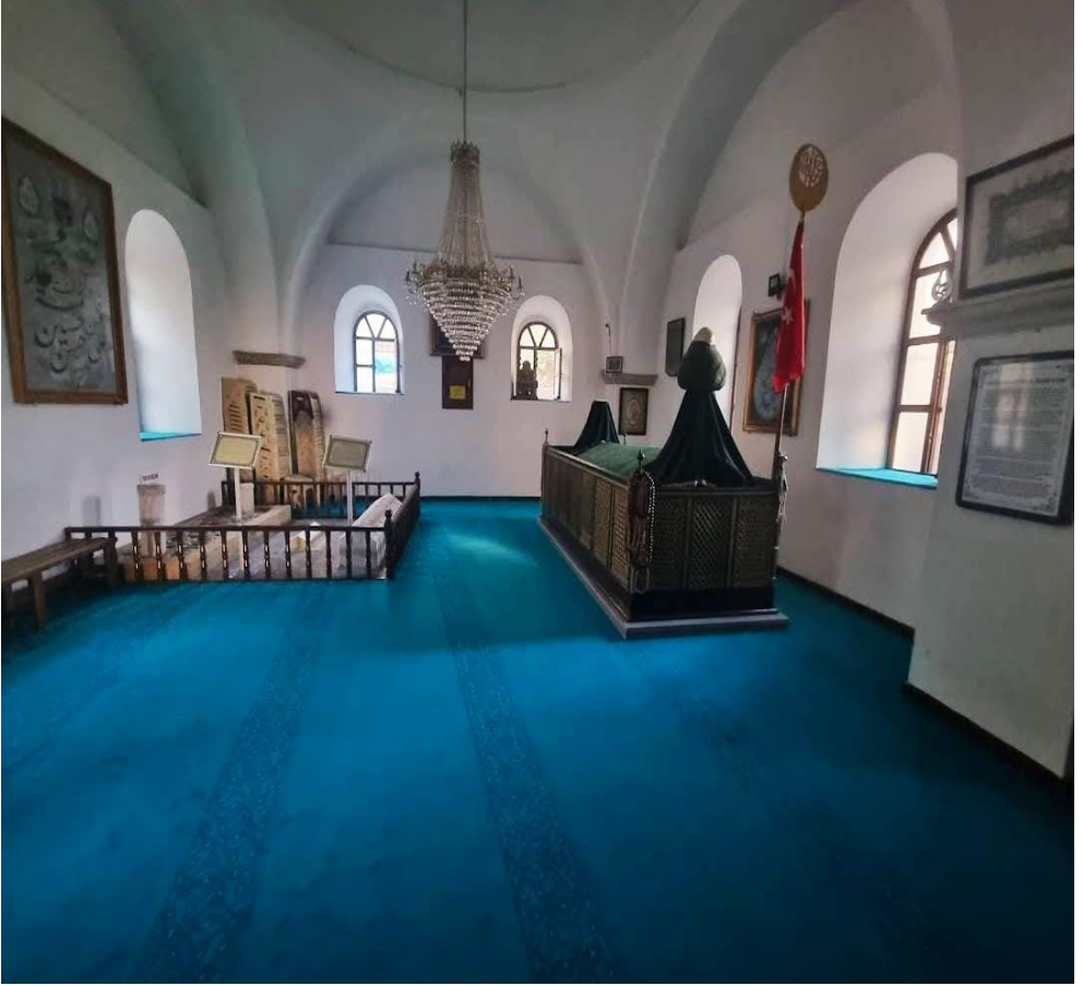
Ek 3: Seyyid Bilal Hazretleri (Sağ tarafta), Emir Gazi Tayboğa (Ortada) ve Sinop Tekfuru (Sol tarafta)