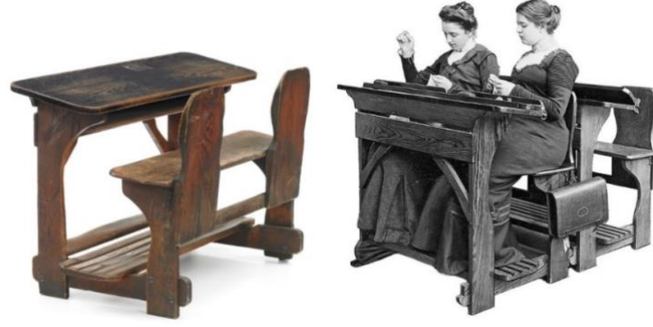
Görsel 2. Alman öğrenci mobilyası Retting Bank ( Url2 ).

1895’li yıllarda tasarlanan Alman okul sırası Retting Bank, yükseltilmiş ayak desteği, giriş çıkışı kolaylaştıran yapısı, üst tablasının eğimlendirilebilir biçimde ayarlanabilmesi sanatsal aktivitelere imkân sunmaktadır ( Görsel 2 ).