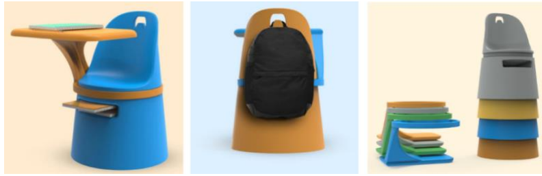
Görsel 5. İstiflenebilir konik öğrenci sandalyesi (Url3).

Ergonomik, esnek mobilyalarda yüksekliği ayarlanabilir kendi ekseninde dönen, hareketli sandalyeler ve eğilenebilir tablolu ve yine yüksekliği ayarlanabilir öğrenci masaları öğrencilerin aktif rol aldıkları yeni eğitim yaklaşımları içerisinde rol almaktadır. Çeşitlenen öğrenci materyallerinin, ders araç gereçlerinin depolanmasına, kullanılmasına yönelik tasarımlar, öğrenci antropometrik ölçülerini dikkate alan yüksekliği ayarlanabilir sıra ve masalar öğrenci mobilyalarındaki gelişimde yer almaktadır. Özellikle teknolojik yeni malzemeler donatı taşıyıcısı ve yüzey malzemelerinde kendini göstermektedir.