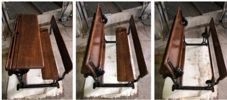
Görsel 1. Victoria dönemi okul sırası ve masası (Url1).

Victoria dönemine ait dökme demir ve masif ahşaptan üretilen okul mobilyasında masa üstü ve oturma yeri katlanabilir ve masa yüzeyi yukarı kaldırılabilir özelliği ile sıraya giriş ve sıra terkini kolaylaştıran tasarıma sahiptir (Görsel 1).