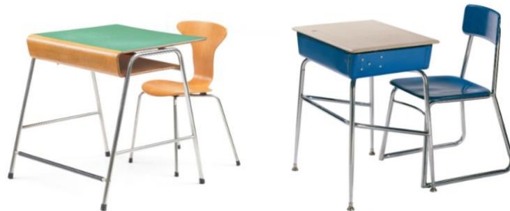
Görsel 4. Arne Jacobsen ve Heywood & Wakefield şirketine ait tek kişilik öğrenci mobilyaları ( Url2 ).

1950’den sonra Arne Jacobsen’in ünlü karınca sandalyesinde masa tablası ve kitap tablası tek parçadan bükülmüş olarak üretilmiştir. Amerikan şirketi Heywood & Wakefield'a ait tek kişilik öğrenci mobilyalarında preslenmiş ağaç talaşlarından yapılmış malzemeler kullanılmıştır ( Url2 ).