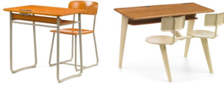
Görsel 3. Çelik ve masif ahşap birleşimi öğrenci mobilyaları 1935-1950’li yıllar ( Url2 ).

1935’li yıllarda 1950’lere kadar okul yapıları içerisinde görev alan öğrenci mobilyalarında çelik sac parçaları, çelik borudan ve masif ahşap kullanılmıştır ( Url2 ).