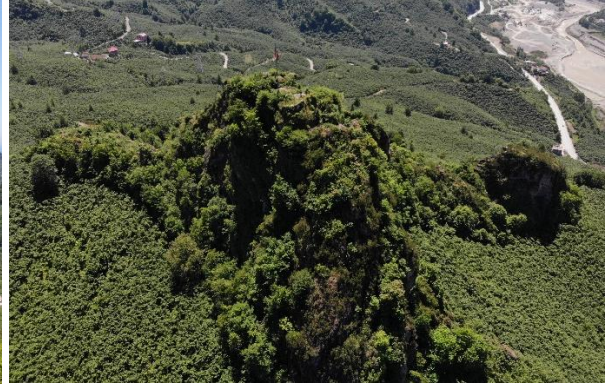
Res. 6: Bedrama Kalesi Kuzey Cephe Görünümü