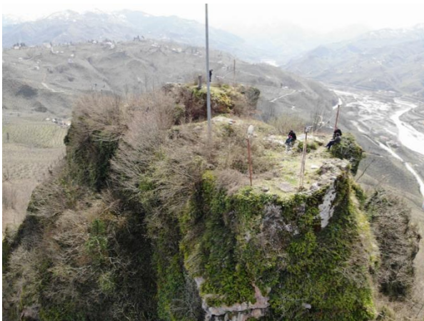
Res. 11: Kuzey Cephe Sur Duvarları