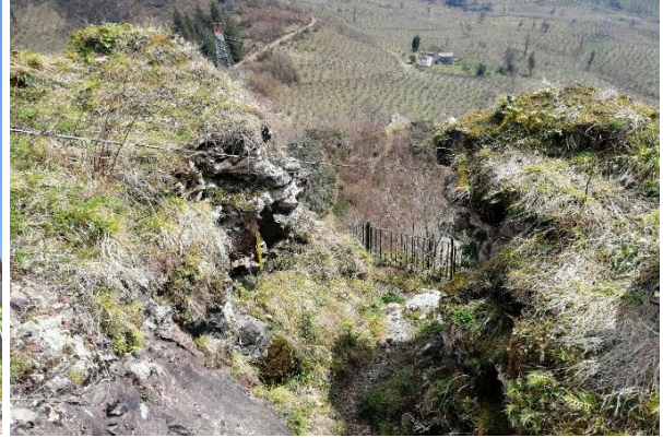
Res. 16: Giriş Kapısının İçten Görünümü