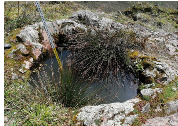
Res. 24: Kalenin Zirvesindeki Sarnıç