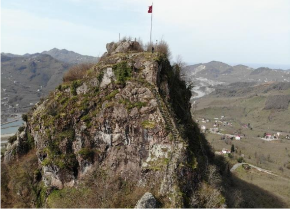
Res. 13: Giriş Kapısı Önündeki Basamaklar