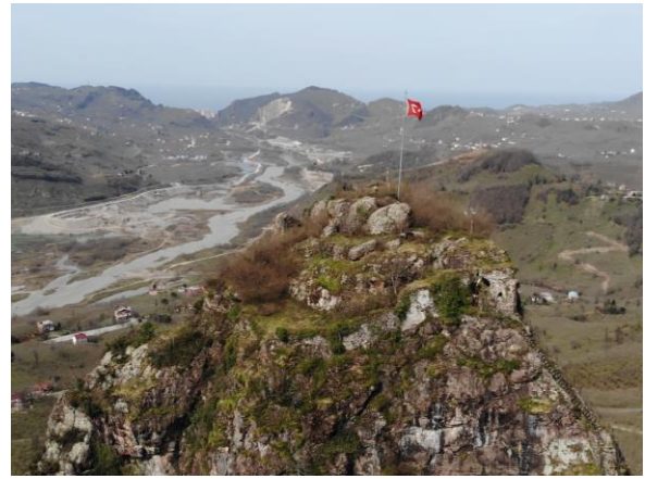
Res. 4: Bedrama Kalesi Güney Cephe Görünümü

Kalenin doğu ve batı cepheler ise uzun kenarları, kuzey ve güney cepheleri kısa kenarları oluşturmakla birlikte kalenin sur duvarları büyük oranda tahrip olduğu için cephe düzenlemeleri büyük oranda varlığını yitirmiştir. Kalenin önemli cephelerinden birisi olan batı cephesi Harşit Çayı'na bakmaktadır. Kalan izlerden anlaşıldığı kadarıyla kalenin batı sur duvarlarının ön tarafında kayalık alan üzerinde ikinci bir sur duvarına ait izler bulunmaktadır. Kalenin batı sur duvarı güneybatıdaki kayalık alandan başlayıp kuzey sur duvarına kadar kayalık alanın yapısına göre ilerlemektedir. Yer yer kayalık alanlardan oluşan batı cephe üzerinde 13 m uzunluğunda olan sur duvarı temel seviyesine kadar yıkılmıştır. Cephenin orta