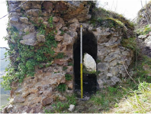
Res. 17: Giriş Kapısının Batısındaki Tünel