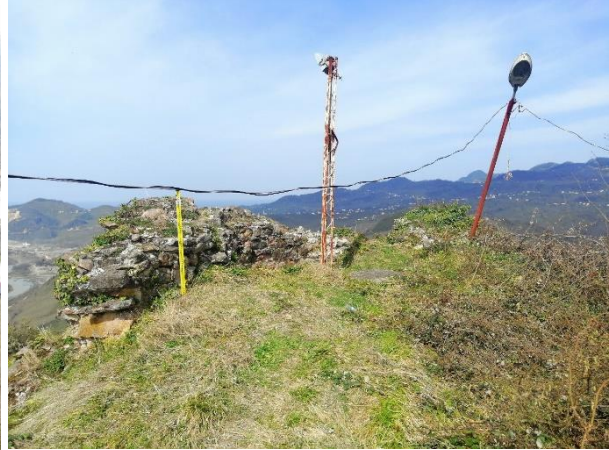
Res. 12: Kalenin İç Kısmından Kuzey Tarafı Görünümü

Kale yapısının doğu, batı ve kuzey cephelerinin ön tarafı dik uçurumlardan oluştuğu için bu yönlerden kaleye ulaşmak mümkün değildir. Yapıya her ne kadar güney yönden ulaşılsa da son zamanlara kadar bu yönden de yapıya ulaşmak pek kolay değildi. Öyle ki eskiden beri kaleyi araştırmaya gelen araştırmacılar kaleye çıkamadıkları için incelemeleri yarım kalmıştır. Bu konuyla alakalı araştırmacılardan B. Umar, kaleye çıkmanın cambaz hüneri gerektirdiğini ve hatta oradaki köy halkının dahi birkaç genç hariç hiç kimsenin kaleye çıkmayı