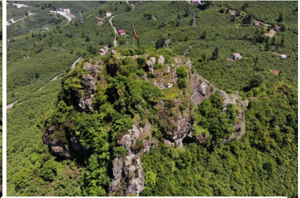
Res. 8: Bedrama Kalesi Batı Cephe Görünümü

Kalenin en önemli cephesi aynı zamanda giriş kapısı ve merdivenlerinin de olduğu güney cephedir. Güney cephenin doğü köşesine kalenin giriş kapısı yerleştirilmiştir. Kapının sol tarafındaki sur duvarı kale bünyesindeki en sağlam sur duvarı olup günümüzde toplam 18,30 m uzunluğundadır. Doğüdan batıya doğru kademeli bir şekilde alçalan sur duvarının kalınlığı 1,20 m ile 0,90 m arasında değişmektedir. Kayalık alan üzerine oturtulmuş olan sur duvarlarının yüksekliği yer yer 6 metreye kadar çıkmaktadır. Güneydoğü köşede yer alan kalenin giriş