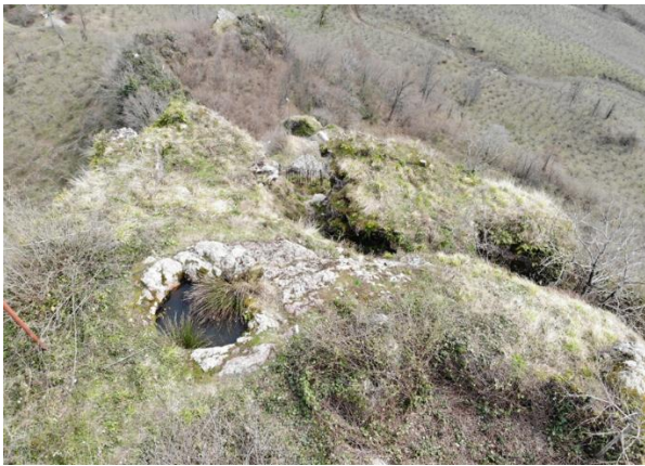
Res. 23: Kalenin Zirvesindeki Sarnıç

Bunun dışında kale meydanlığının bünyesi yer yer kayalık alanlardan da oluşmakta olup bu alanlar bünyesinde iki adet de sarnıç yapısına yer verilmiştir. Birinci sarnıç yapısı giriş kapısının 6 m uzağında kuzey tarafta kayalık alan üzerine oyulmuştur. Silindirik planlı oyulmuş olan sarnıcın ağız kısmı 2 m'lik bir çapa sahiptir. Son ölçümde 0,60 m derinliğinde olan sarnıcın içerisinde taş ve toprak yığımları ile dolu olduğu anlaşılmakla birlikte derinliğinin daha fazla olduğu muhakkaktır. Mart ve Nisan aylarında yapılan arazi çalışmalarında sarnıcın ağız kısmına kadar suyla dolu olması sızdırma yapmadığını göstermektedir. İkinci sarnıç yapısı ise kalenin en yüksek noktasındaki kayalık alanın ortasında yer almaktadır. Kayaya oyularak oluşturulan 2 x 1,60 m ölçülerindeki sarnıcın yapısı bozulmuştur. Sızdırma yaptığı için bünyesinde suyu tutamamaktadır (Res. 23-24).