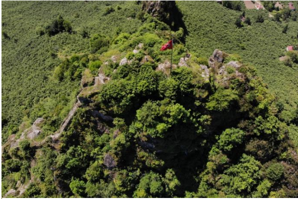
Res. 7: Bedrama Kalesi Doğü Cephesi Görünümü