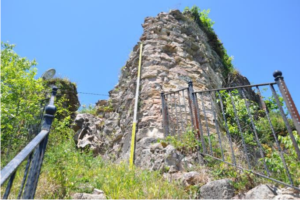
Res. 15: Giriş Kapısı Sağındaki Burç