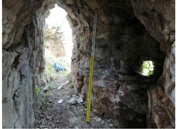
Res. 18: Girişin Batısındaki Tünel ve Pencere