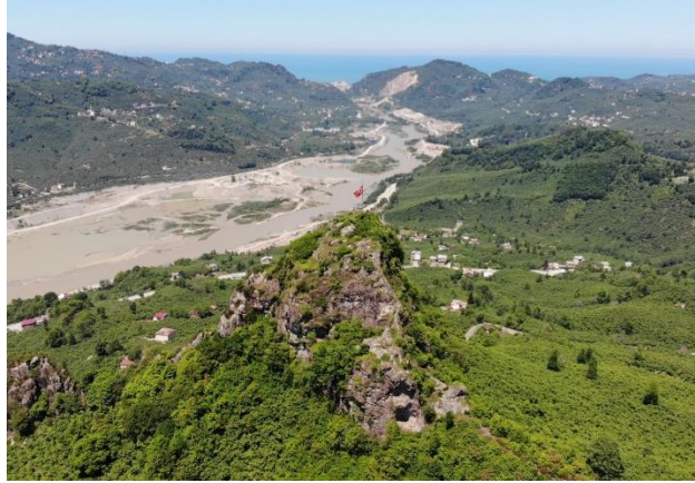
Res. 1: Bedrama Kalesi Konumu