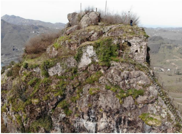
Res. 9: Güney Surları ve Giriş Kapısı

kapısının mimari düzeni büyük oranda tahrip olsa da kalan izlerden anlaşıldığı kadarıyla bölgedeki kale giriş kapılarından oldukça farklı bir mimari düzene sahiptir. Giriş kapısının üzerinin tonozlu bir örtü ile kapatıldığı kalan kemer izlerinden bellidir. Kapı açıklığının sol tarafına tonozlu bir tünel yerleştirilmiştir. Günümüze nispeten sağlam gelebilen tünelin uzunluğu 4 m, ortalama yüksekliği 2 m ve genişliği 1 m olarak ölçülmüştür. Tünelin ortasında güney duvarı üzerinde ise dıştan 0,30 x 0,20 m içten ise 1,70 x 1,10 m ölçülerinde bir adet mazgal pencereye yer verilmiştir. Tünelin tonoz örtüsü yontma moloz taştan örülmüş duvar yüzeyleri yoğun kireç harcı ile pürüzsüz hale getirilmiştir. Kalan duvar izlerinden tünelin daha uzun olduğu anlaşılmaktadır. Giriş kapısının sağ tarafı ise yaklaşık 3 m derinliğe ve 1,40 m genişliğe sahip bir mekân şeklinde değerlendirilmiştir. Ancak giriş cephesi yıkılmış ve buradaki malzeme dokusu iç mekâna yayılmıştır. Girişin sağ tarafında dikkati çeken bölümlerden birisi de bu bölümde dışa doğru üçgen şeklinde çıkma yapan bir burcun yer almasıdır. Benzer örneğine Tirebolu Kalesi'nde de rastlanılan burç yapısı sur duvarından 2 m kadar dışa doğru çıkıntı yapmıştır. Burcun olduğu sur duvarı yaklaşık 4,50 m yükseklikte olup günümüze büyük oranda sağlam gelebilmiştir (Res. 9-12).