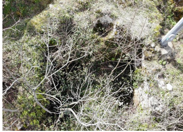
Res. 20: Kalenin Doğusundaki Mekân Kalıntısı