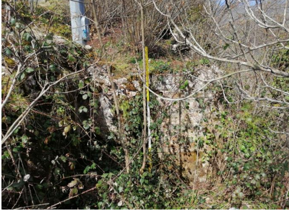
Res. 21: Kalenin Doğusundaki Mekân Kalıntısı