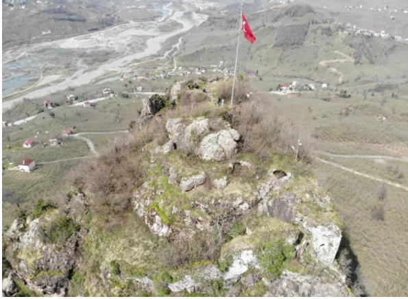
Res. 19: Kalenin Zirvesinin Genel Görünümü