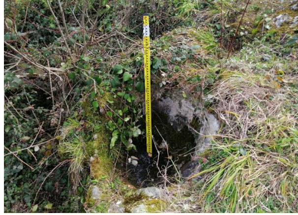
Res. 22: Mekân Kalıntısının Yanındaki Amfora

Bunun dışında kale meydanlığının bünyesi yer yer kayalık alanlardan da oluşmakta olup bu alanlar bünyesinde iki adet de sarnıç yapısına yer verilmiştir. Birinci sarnıç yapısı giriş kapısının 6 m uzağında kuzey tarafta kayalık alan üzerine oyulmuştur. Silindirik planlı oyulmuş olan sarnıcın ağız kısmı 2 m'lik bir çapa sahiptir. Son ölçümde 0,60 m derinliğinde olan sarnıcın içerisinde taş ve toprak yığımları ile dolu olduğu anlaşılmakla birlikte derinliğinin daha fazla olduğu muhakkaktır. Mart ve Nisan aylarında yapılan arazi çalışmalarında sarnıcın ağız kısmına kadar suyla dolu olması sızdırma yapmadığını göstermektedir. İkinci sarnıç yapısı ise kalenin en yüksek noktasındaki kayalık alanın ortasında yer almaktadır. Kayaya oyularak oluşturulan 2 x 1,60 m ölçülerindeki sarnıcın yapısı bozulmuştur. Sızdırma yaptığı için bünyesinde suyu tutamamaktadır (Res. 23-24).