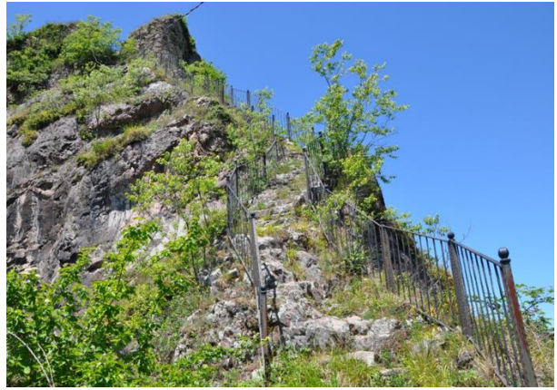
Res. 14: Kaleye Çıkışı Sağlayan Basamaklar