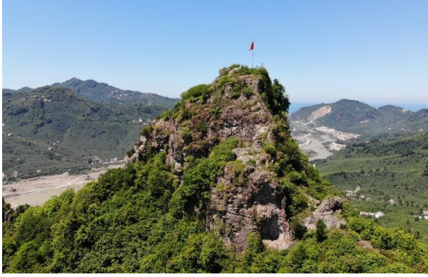
Res. 5: Bedrama Kalesi Güney Cephe Görünümü

Kalenin önemli cephelerinden birisi de kuzey cephedir. Sur duvarlarının kısa kenarlardan birini oluşturan kuzey cepheden çok rahat bir şekilde Karadeniz sahil şeridi gözlemlenebilmektedir. 15 m uzunluğundaki kuzey cephe sur duvarları diğer cephelerdeki sur duvarlarına göre günümüze kadar daha sağlam gelebilmiştir. Sur duvarının orta bölümündeki 3 m uzunluğundaki kısım temel seviyesine kadar yıkılsa da geriye kalan kısımlar iç taraftan 1 m yüksekliğe kadar varlığını devam ettirmektedir. 0,90 m kalınlığında yapılmış olan kuzey sur duvarları üzerinde de herhangi bir burç yapısına yer verilmemiştir (Res. 5-8).