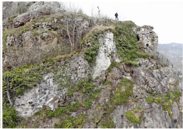
Res. 10: Güney Cephe Sur Duvarları