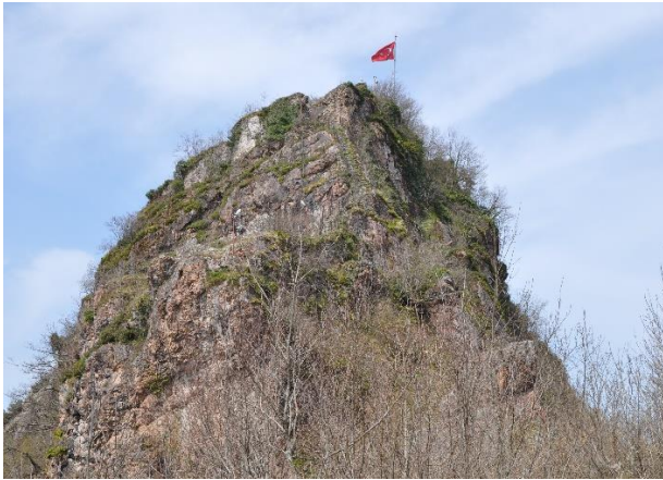
Res. 3: Bedrama Kalesi Güney Cephe Görünümü