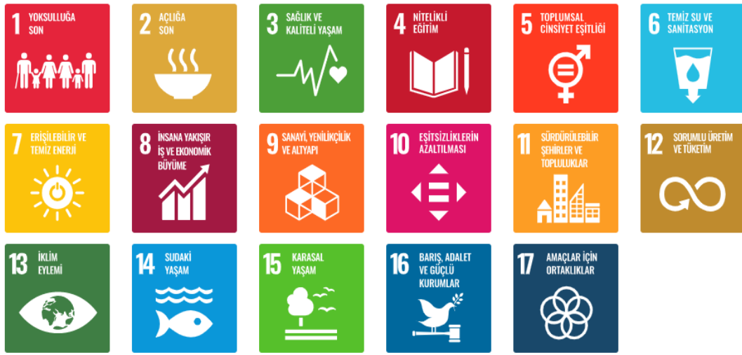
Şekil 2: Sürdürülebilir Kalkınma Hedefleri

2015 yılında dünyanın dönüşümünü ilgilendiren temel konularda önemli kararların alındığı bir zemin oluşmaya başlar. Eylül 2015'te New York'taki Birleşmiş Milletler Genel Merkezi'nde gerçekleştirilen BM Sürdürülebilir Kalkınma Zirvesi'nde sosyal, çevresel ve ekonomik konularla alakalı 2030 Sürdürülebilir Kalkınma Hedefleri 193 ülkenin imzası ile kabul edilir (UNESCO, 2015). 2030 Gündemi'nin merkezinde on yedi adet "Sürdürülebilir Kalkınma Hedefi" yer almaktadır. Şekil 2'de bu hedeflere yer verilmiştir.