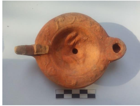
Resim- 3:Kalp Burunlu kandil, İ.S.1.yy.ın ikinci yarısı

131.58 seviyesinde bir başka kandil bulunmuştur(Resim-4). Kat.No-2 olan kandilin burnunu kırık bir şekilde bulunmuştur. İnce katkılı hamuru mikalıdır ve iyi pişirimidir. Astar pürüzsüz ve yarı mat görünümlüdür. Kırmızımsı kahverengi rengindedir. Kullanılmaktan dolayı yanma izleri burunun kalan kısmında görülmektedir.