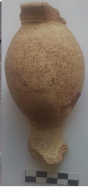
Resim- 5: Unguenmtaerium, İ.Ö.4-3 yy

134.45 seviyesinden bulunmuş olan Kat.No-3 numaralı unguentariumun ağız ve kaidesi büyük ölçüde kırık olarak bulunmuştur (Resim-5). Kum kireç ve taşçık katkılı hamur orta derecede iyi pişirimidir ve kahverengi rengindedir. Krem renkli astarı, kap düzletilmeden uygulanmıştır. Dolayısı ile homojen bir görünüm oluşmuştur. Üzerinde boya ya da bezeme bulunmamaktadır. 11.4 cm yüksekliğinde dışa çekik ağızlı ve kısa boyunludur. Gövde küreseldir ve küresellik tüm gövde üzerine inmiştir. Ayak kısadır ve unguentariumlarda ayakların yeni yeni uzamaya