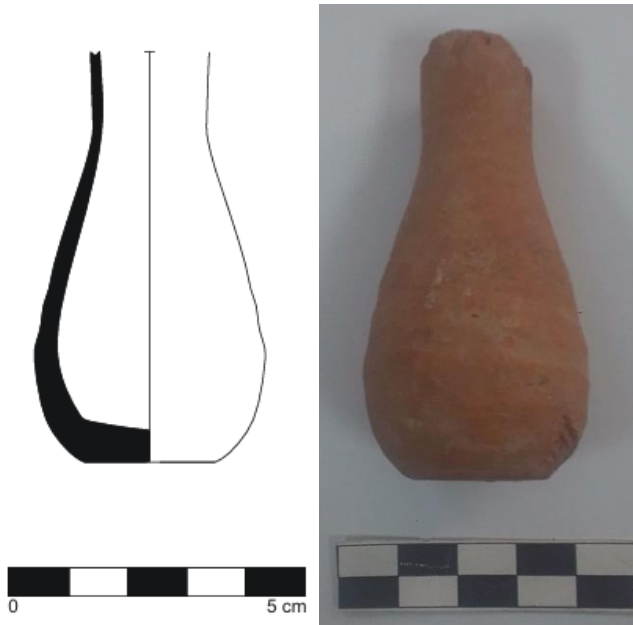
Resim- 6:Unguentarium, İ.S.1 yy.

Thyateira buluntusu unguentariumun gövdesi küreseldir ve küresellik gövdenin ortasına doğru inmiştir. Ayağın uzamaya ve kaidenin küçülmeye başladığı erken form özellikleri göstermektedir. Bununla birlikte Thyateira örneği dolgu buluntusu olması nedeni ile benzeri örneklerin bulunduğu yerleşimlerde yapılan tarihlendirmeler ışığında değerlendirilecektir. Bu bağlamda Thyateira örneğinin benzerlerinin bulunduğu Perge (Çokay, 2003, 117, 118), Kerameikos (Kerameikos IX, Lev.96, E86.1), Atina (Thompson, 1934, 335), Korinth (Corinth VII,3,Lev.20) ve Sardeis (Rotroff, Oliver, 2003, Lev.43, No:253) yerleşimlerinde form, İ.Ö.4 yy.ın sonlarına tarihlendirilmektedir. Thyateira örneği gösterdiği stil özellikleri bu yerleşimdekiler ile benzer özellikler gösterdiği için İ.Ö.4 ve 3 yy aralığına tarihlendirilmesi önerilmektedir.