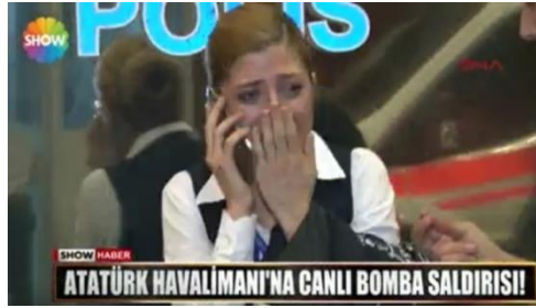
Şekil 2: Saldırıya Maruz Kalan Bir Personelin Yaşadığı Korku ve Panik