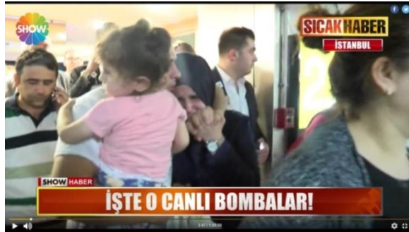
Şekil 4: 30 Haziran 2016 Tarihinde Show Ana Haber'de Yaşanılan Korku ve Panik Anının Gösterimi