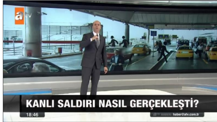
Şekil 3: 29. 06. 2016 Tarihli ATV Haber'de Saldırının Nasıl Gerçekleştiğinin Anlatımı

Kaynak: ATV Ana Haber Bültesi, 2016, http://www.atv.com.tr/