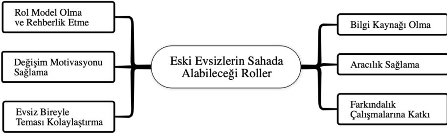
Şekil 1. Evsizlerin Sahada Alabileceği Roller

Eski evsizlerin, evsizlikle mücadele alanında alabilecekleri rollerin ilki sokaktaki evsizlere rol model olma ve rehberlik etme olarak belirlenmiştir. Evsizlikle mücadeleyi başarıyla sürdüren/tamamlamış bir bireyin evsizle temas sağlamanın, evsizlerin kendi mücadele süreçlerine ilişkin bir örneklik teşkil edebileceği aktarılmıştır. Bu anlamda eski evsizlerin sokaktaki evsizlerle rehberlik ve mentörlük düzeyinde bir ilişki kurabileceği belirlenmiştir. Bu ilişki eski evsizlerin, evsizlerle ilgilendiği ve beraber vakit geçirdiği bir pratiği içerebilirken temelde değişime yönelik bir örnekliğin somut olarak sunulması açısından önemli görülmektedir. Ayrıca benzer bir ilişkinin evsizliği deneyimlemeyen bireylere kıyasla eski evsizlerin sunması, evsizlerin bu ilişkiyi benimsemesi açısından da önemli bir avantaj olarak görülmektedir.