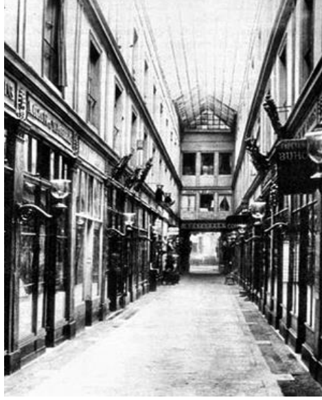
Şekil 1. Paris'te Opera Pasajı.

önemli bir nokta da flâneur 'un 3 erkek ve burjuva sınıfından olması ve 19. yüzyıl toplumunda kadınların sokakta yürümesinin hoş karşılanmadığı bir kent profilidir.