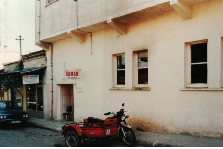
Res. 1: Alaşehir (Sülün Muslu Paşa) Hamamı. Kuzeyden görünüş.