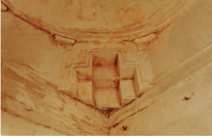
Res. 3: Alaşehir (Sülün Muslu Paşa) Hamamı. Erkekler bölümü aralık mekânında kubbe geçiş unsuru.