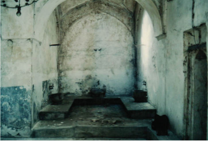
Res. 10: Alaşehir (Sülün Muslu Paşa) Hamamı. Kadınlar bölümü sıcaklık mekânı batı eyvanı.