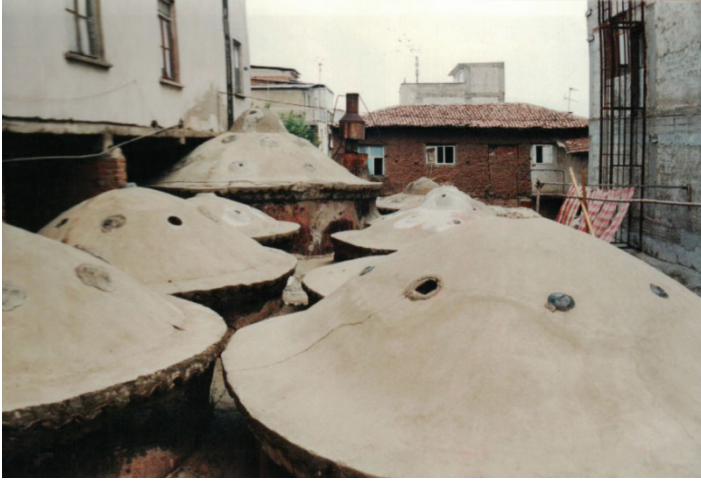
Res. 2: Alaşehir (Sülün Muslu Paşa) Hamamı. Kubbelerden görünüş.