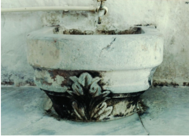
Res. 8: Alaşehir (Sülün Muslu Paşa) Hamamı. Erkekler bölümü sıcaklık mekânı eyvan kurnası.