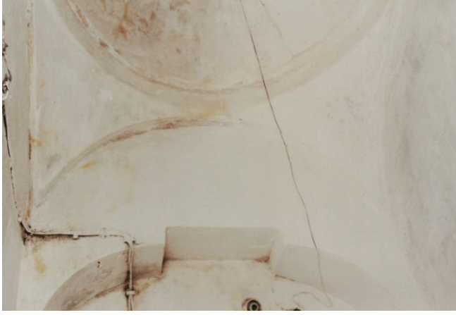
Res. 5: Alaşehir (Sülün Muslu Paşa) Hamamı. Erkekler bölümü ılıklık mekânı üst örtüsü.