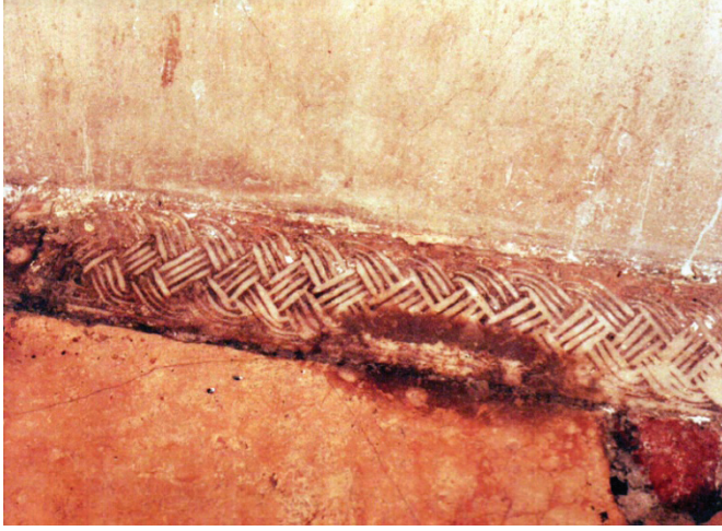
Res. 4: Alaşehir (Sülün Muslu Paşa) Hamamı. Erkekler bölümü aralık mekânındaki devşirme blok.