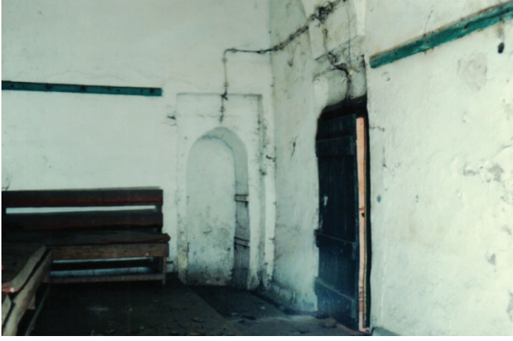
Res. 9: Alaşehir (Sülün Muslu Paşa) Hamamı. Kadınlar bölümü ılıklık mekanının ve bu mekanın doğu duvarı üzerindeki sonradan duvarla kapatılmış tıraşlık girişi.