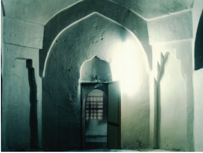
Res. 6: Alaşehir (Sülün Muslu Paşa) Hamamı. Erkekler bölümü sıcaklık mekânı.