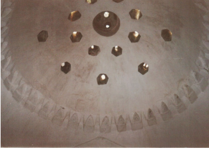
Res. 7: Alaşehir (Sülün Muslu Paşa) Hamamı. Erkekler bölümü sıcaklık mekânı kubbesi.