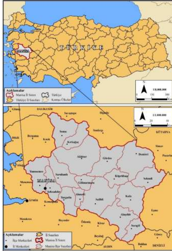
Harita 1. Manisa İlının Lokasyon Haritası.

bakımdan, Ege Bölgesi'nin orta ve kuzeyinde olup, batısı Asıl Ege, doğusu ise İç Batı Anadolu Bölümü'nde yer almaktadır. Gediz Havzasının büyük bölümü il sınırları içinde bulunmaktadır. İl idari bakımdan, doğudan Uşak'ın Merkez ve Eşme, Kütahya'nın Gediz ve Simav, kuzeyden Balıkesir'in Sındırgı, Merkez, Savaştepe ve İvrindi, güneyden Aydın'ın Nazilli ve Kuyucak, güneydoğudan Denizli'nin Buldan ve Güney, güneybatıdan İzmir'in Kiraz, Ödemiş, Bayındır ve Kemalpaşa, batıdan ise İzmir'in Bornova, Menemen, Aliağa, Bergama ve Kınık ilçeleriyle çevrilidir. Ege Bölgesi'nde yer alan Manisa ilinin yüzölçümü 13.096 km 2 'dir (Koday, Erhan, Akbaş, 2016: 538-539).