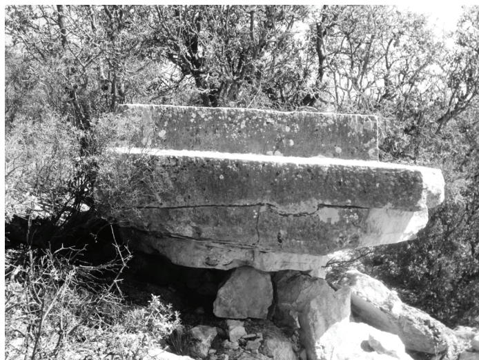
Abb.5. P 4: Die Basis