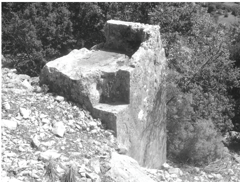
Abb.13. P X: Der Pfeiler am Südhang