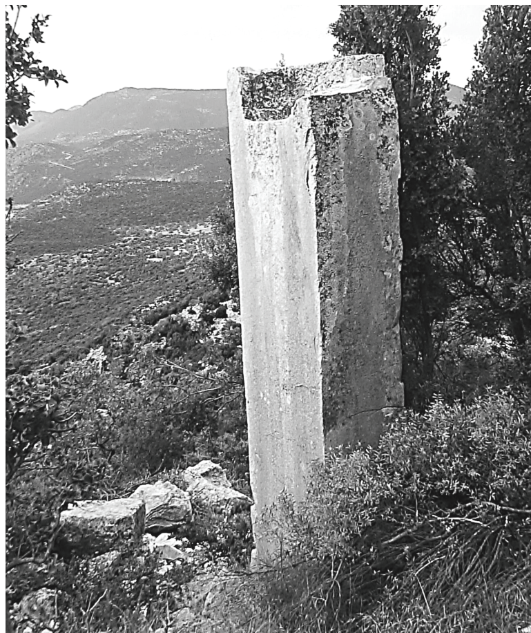
Abb.8. P 2: Pfeilerschaft mit halbierter Kammer