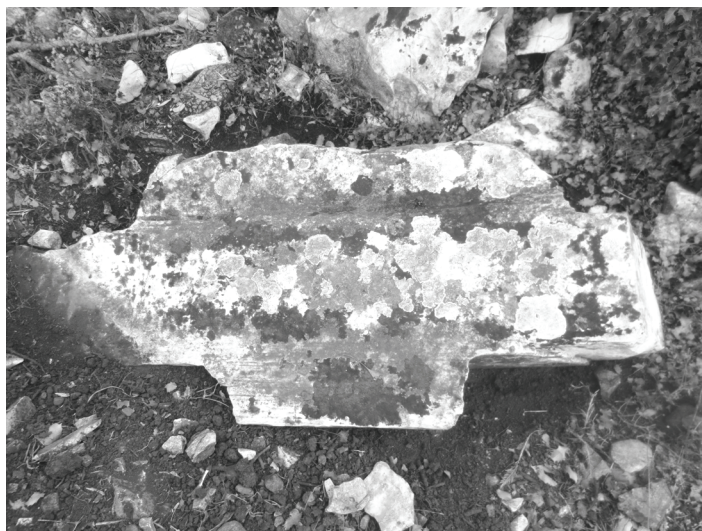
Abb.9. P 2: Das mutmaßliche Deckplatten-Fragment