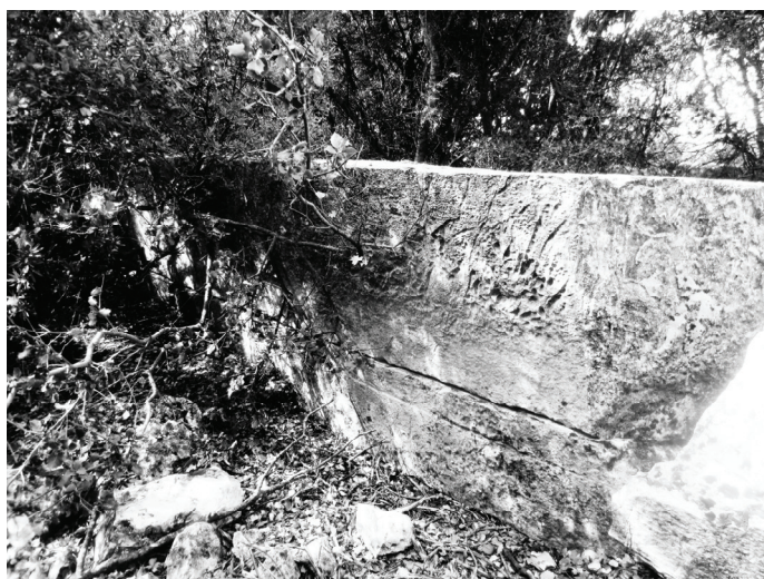
Abb.3. P 5: Die Trennfurche auf der rechten Seite