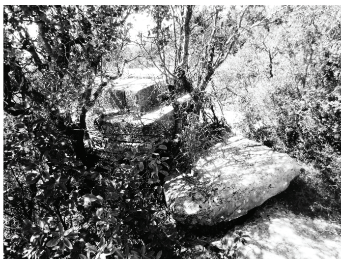
Abb.6. P 4: Die Deckplatte vor der Basis