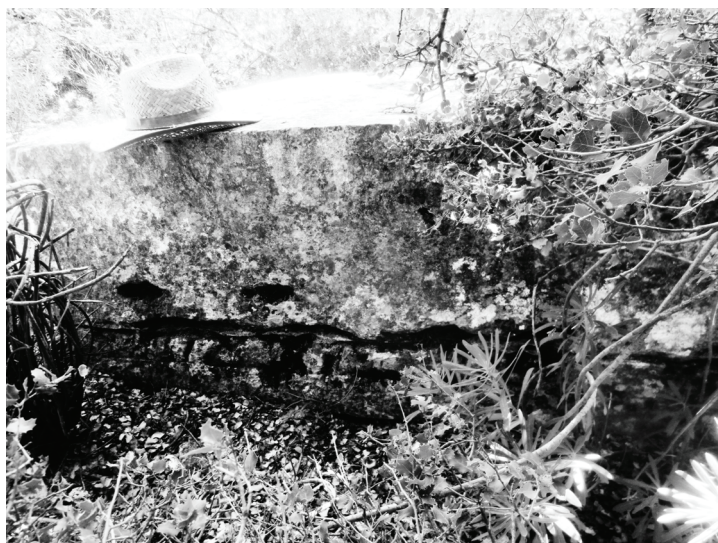
Abb.4. P 4: Trennfurche und Schlitze auf der linken Seite