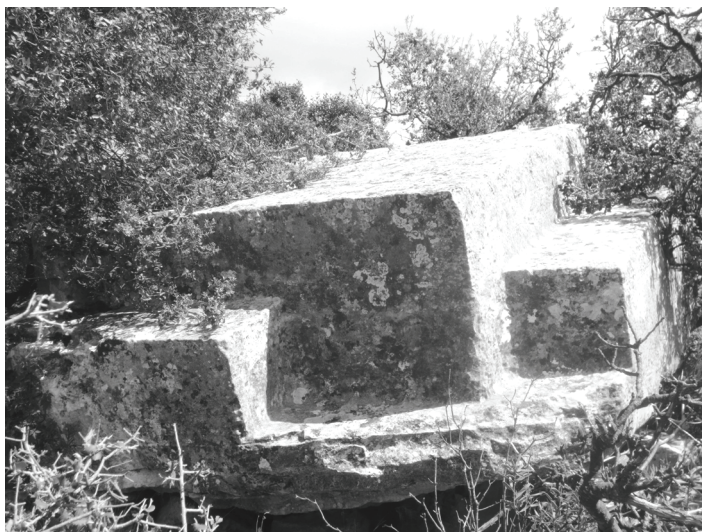
Abb.10. P 3: Die Basis