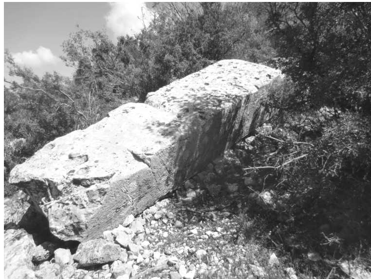
Abb.7. P 1: Pfeilerschaft