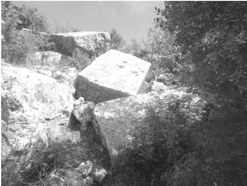
Abb.12. P 3: Die Schaftstücke