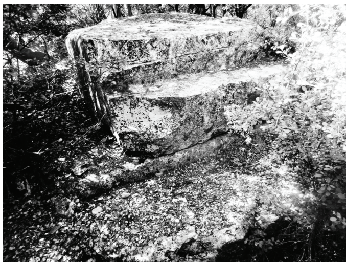
Abb.1. P 5: Basis und Felssockel