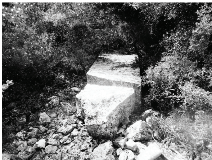
Abb.2. P 5: Der Pfeilerschaft