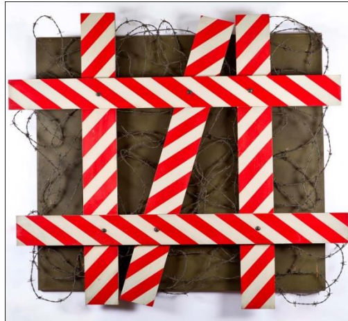
Resim.1.9. Altan Gürman, "Montaj 5", Tahta üz. Selülozik Boya ve Dikenli Tel, 140x140x9 cm. 1967-İstanbul

Lotringer'e göre; "Sanat bugün hiç olmadığı kadar başarılıdır. Ama hala sanat mıdır? Sanat, maddi mallar gibi piyasa taleplerini karşılamak için durmadan çalışırken, statüsünü sorgulamak yerine, öne çıkmanın tadına varmaktadır. Günümüzde sanatın yegâne varlık nedeni: Kendi kendini sanat olarak yeniden icat etmektir"(Lotringer, 2010).