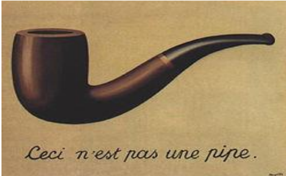
Resim.1.5. Rene Magritte, Oil on Canvas, 1928-1929, 63,5 cm x 93,98 cm (250 in x 3,700 in), Los Angeles, California.

Kosuth ise "Üç Sandalye" adlı çalışmasıyla izleyeni şaşırtır. Sandalye'nin kendisi, sandalyenin fotoğrafı ve sandalyenin tanımının yapıldığı yazınının yan yana konulmasıyla üçlemeyi sağlamıştır. Burada izleyeni düşündürmek amaçtır. Sanatın arka plânında yatan felsefeye odaklanmanız istenir. Gördüğünüz ve gördüğünüzü sandığınız şey ile onun tanımı önünüze konulmuştur.