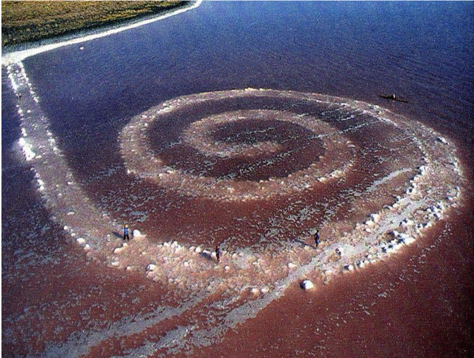
Resim.1.2. Robert Smithson “Spiral Art” Büyük TuzGöl’ü /Utah /1970/ABD.

Land Art arazide yapılan çalışmalardan meydana gelmektedir. İlk akla gelen isim ise Robert Smithson ve yaptığı işi “Spiral Jetty” dir. Madenler, çöller, kayalıklar, donmuş nehirler, üzerinde, kısacası doğada meydana gelen ve getirilen görüntülerden ibarettir. Doğada bir iz bırakmak ve yok olan doğaya dikkat çekmek için yapılan tüm çalışmalar için bazen işçi çalıştırılması, vinçlerden yardım alınması, büyük bütçeler ayrılması, hatta sponsor bulunması gerekir. Tüm yapılanlar ise kalıcı değildir. Bu nedenle de genellikle sanatçı araziye elinde belgeler, çalışma notları, haritalar ile açıklayıcı günlüklerini götürür. Kendisi ya da profesyonel bir fotoğrafçı ile çalışarak oradaki görüntüleri çeker, kaydeder, videoya alır. Sonra bu çalışmaları sergileyerek, satarak paraya dönüştürebilir. Arazide yapılan çalışmayı satması bir galeride sergilemesi mümkün değildir.