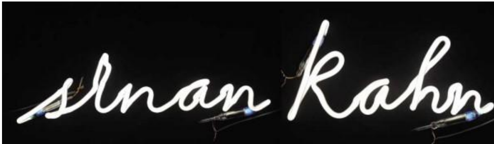
Resim.1.7. Sarkis “Sinan Kahn” White Neon Ligthing, 2010, Edition of 5

Türkiye’de güncel sanat çalışan isimlerin en başında ise 1960’lardan itibaren heykel sanatçıları Füsun Onur, Kuzgun Acar, resim sanatçıları Altan Gürman, Bedri Baykam, Sarkis gibi isimler gelmektedir.