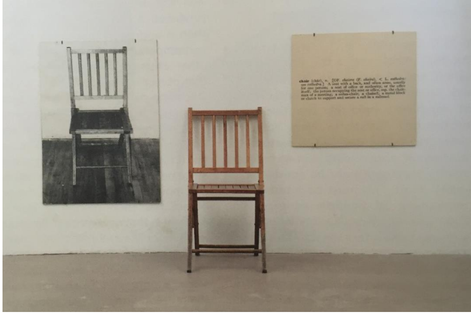
Resim.1.4. Joseph Kosuth, "One and Three Chairs", 1966, Boyutları:Sandalye'nin Fotoğrafı 91,5x61,1cm., Yazılı metin panosu 61x61.3cm., Sandalye 82x37,8x53cm.

Kosuth ise "Üç Sandalye" adlı çalışmasıyla izleyeni şaşırtır. Sandalye'nin kendisi, sandalyenin fotoğrafı ve sandalyenin tanımının yapıldığı yazınının yan yana konulmasıyla üçlemeyi sağlamıştır. Burada izleyeni düşündürmek amaçtır. Sanatın arka plânında yatan felsefeye odaklanmanız istenir. Gördüğünüz ve gördüğünüzü sandığınız şey ile onun tanımı önünüze konulmuştur.