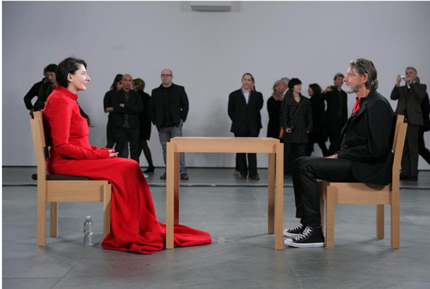
Resim.1.1 Marina Abramovic ve Sevgilisi Ulay (Karşılıklı Oturma Performansında) MOMA 2010 / New York.

Sırp sanatçı Marina Abramovic zihinsel ve bedensel sanatın sınırlarını zorlayarak saatlerce bir sandalye de hareketsiz oturarak ve sadece karşısındakinin gözlerinin içine bakarak acı çekmenin görüntüsünü vermektedir. Canlı performanslarını genelde bir müzenin girişinde ya da içerisinde bir masa ve iki başında duran sandalye ile gerçekleştirmiştir. Birine kendisi diğerine sevgilisi Ulay oturmuş birbirlerinin gözlerinin içine bakmışlardır. İzleyicilerde kısa süreli sanatçının karşısındaki sandalyeye oturup gözlerine bakmışlardır.Abramovic 1960'larda ortaya çıkan Body Art'ın önemli temsilcilerindendir. Bedenin, kendisinin malzeme olarak kullanılması başlı başına şaşırtıcıdır. Yapılanların anlaşılabilmesi ise uzun bir süre almıştır.