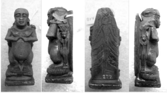
Resim 1: van Erp 2014, ,Appendices, 4, Env. No. AA8

itibar kazanmıştır 8 ve Tanrı Ptah da kendisiyle aynı başlığı taşıyan bir cüce şeklinde tasvir edilmeye başlanmıştır. 9 “Küçük Ptah” olarak değerlendirilen 10 ve yukarıda bahsi geçen Herodotos’un pasajını esas alarak “Pataikos” olarak adlandırılan 11 bu cüce amuletler Ptah başlığı, başlık üzerinde bir böcek (Skarabe), Ptah’inkine benzer, çoğunlukla boncuk dizili, bir yakalık (gerdanlık), elinde yılan ya da bıçak, her iki omzunda yırtıcı kuş ve timsah üzerinde durur şekilde betimlenmektedir. 12