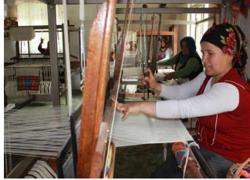
Foto 6. Susuz Köyü Karaahmet Mahallesinde çulfalık ismi verilen el tezgahında Susuz Bezi dokuyan kadıncılar.