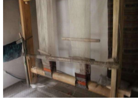
Foto 8. Soruh Vadisi'ndeki köylerde kullanılan "Düzen" adı verilen dokuma tezgahı detayı.