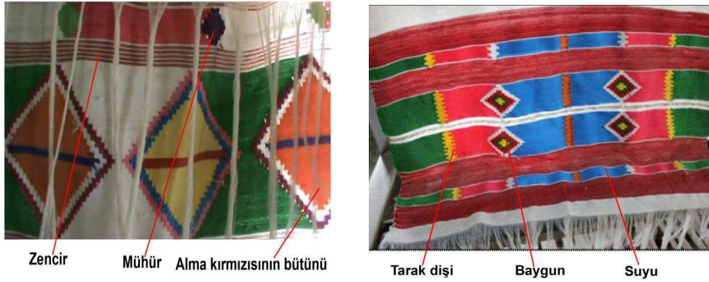
Foto 4 a-b. Susuz Bezi motif detayı ve motif isimleri (Susuz Köyü Karaahmet Mahallesi, 2014).

"çulfalık" gibi isimler verilen basit tezgâhlarda dokunarak kültürel motiflerle süslü yöresel dokumalara dönüşmektedir. Beyaz üzerine parlak ve canlı renklerin hakim olduğu Susuz Bezi'nde; baygun, suyu, mühür, zencir, tarak dişi, süydürme, bükme ve alma kırmızısının bütünü (Foto 4) gibi yöresel isimli motiflerin kullanıldığı tespit edilmiştir. Dokuma işleminde, dolap (ip çözümünde kullanılır) petek, tarak, küçü, tufa, kuş, geledür, el ağacı, ayaklar, mekük, cimbar, argut ağacı, ip, çıkırık, kelepçe, iğ ve masura gibi 17 farklı aletten oluşan bir kombinasyon kullanılmaktadır (Foto 5-6-7).