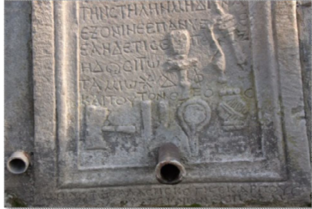
Foto 3. Roma dönemi mezar taşlarında yün eğirmede kullanılan kirman ve yün kutusunun figürleri (B.Kıvrak).