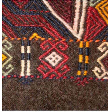
Foto 14. Özyörük Köyü'nde dokunan kilim örneği.