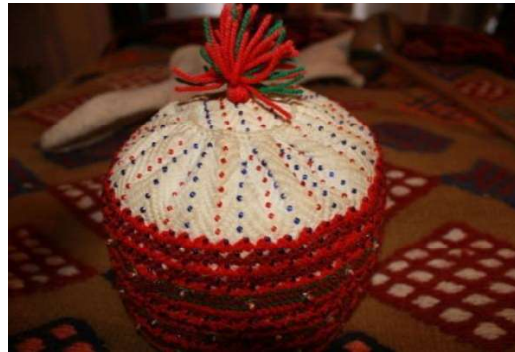
Foto 12. Tahtaköprü Köyü'nde dokunan boncuklu taç örneği.