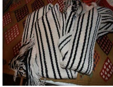
Foto 10. Tahtaköprü Köyü'nde Kadınların çocuklarının sırtlarına bağladıkları kuşak örneği