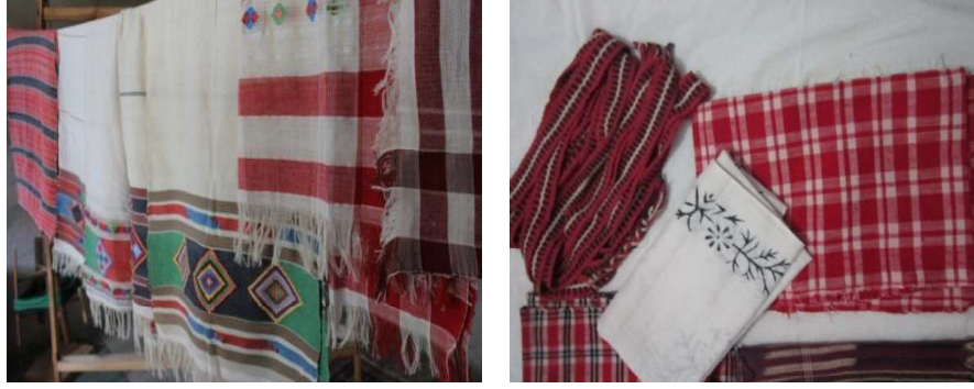
Foto 7 a-b. Susuz Vadisi'ndeki mahallelerde yapılan dokuma örnekleri (Susuz Köyü, 2014).