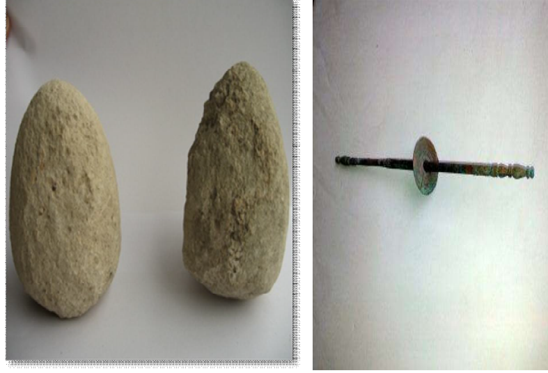
Foto 1. Oymağaç Höyük kazısının Frig katmanında tespit edilen tezgah ağırlığı (ağırşak) (B.Kıvrak)

ait çukurlardan alınarak yapılan toprak analizleri, Demir Çağı'nda Vezirköprü yöresinde bol miktarda arpa, buğday, siyez, antik mısır ve çavdar üretildiği ve tüketildiğini göstermektedir. Ayrıca bu analizlerde, Demir Çağı'nda darı, mürdümük, bezelye, burçak, mercimek, üzüm, incir yanında keten bitkisinin tohumlarının bulunması (Oymağaç Höyük-Nerik Raporu, 2011, s. 23) yörenin, dokumacılık için hammadde oluşturan ürünlerin yetiştirildiği bir bölge olduğunu göstermektedir.