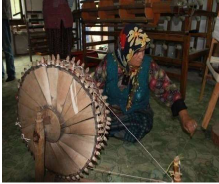
Foto 5. Susuz Köyü Karaahmet Mahallesi'nde çıkırık denilen basit makara ile iğe ip dolama işi, 2014.