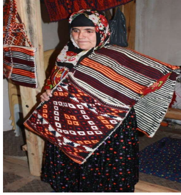
Foto 13. Tahtaköprü Köyü'nde dokunan kilim örneği.