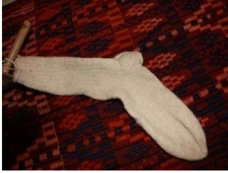
Foto 9. Tahtaköprü Köyü'nde dokunan yün çorap örneği.