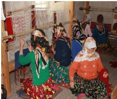
Foto 11. Tahtaköprü Köyü'nde düzen adı verilen el tezgahında kilim ve heybe dokuyan kadınlar.