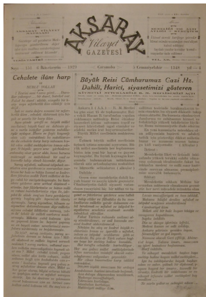
Ek 2: 6 İkinci Teşrin 1929