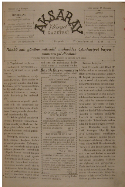
Ek 1: 30 Birinci Teşrin 1929