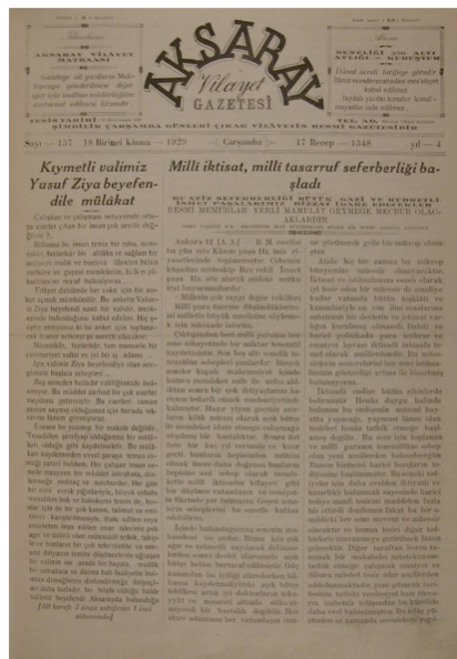
Ek 3: 18 Birinci Kânûn 1929