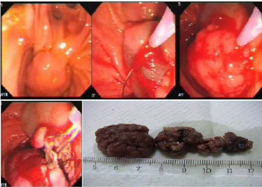
Resim 2 (a). Papilla ve adenom (b,c). Submukozal injeksiyon sonrası snare ile çıkarılan dokular