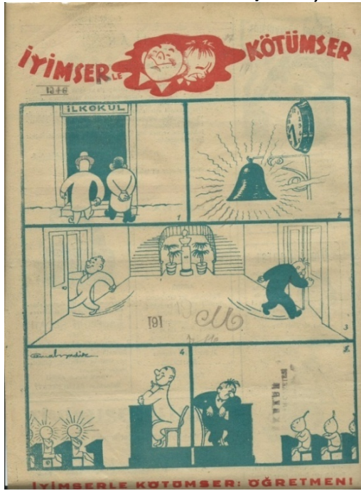
Şekil 2. İyimser ve Kötümser öğretmen