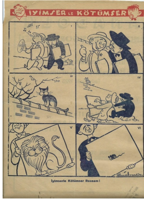
Şekil 1. İyimser ve Kötümser ressam