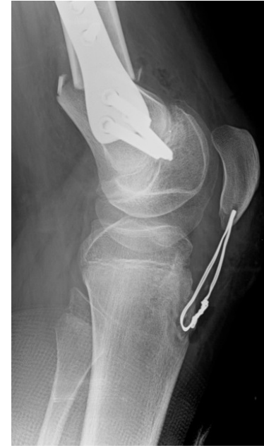
Şekil 1. Diz fleksiyon kontraktürü sebebiyle bilateral SFEO uygulanan hastanın preoperatif grafileri