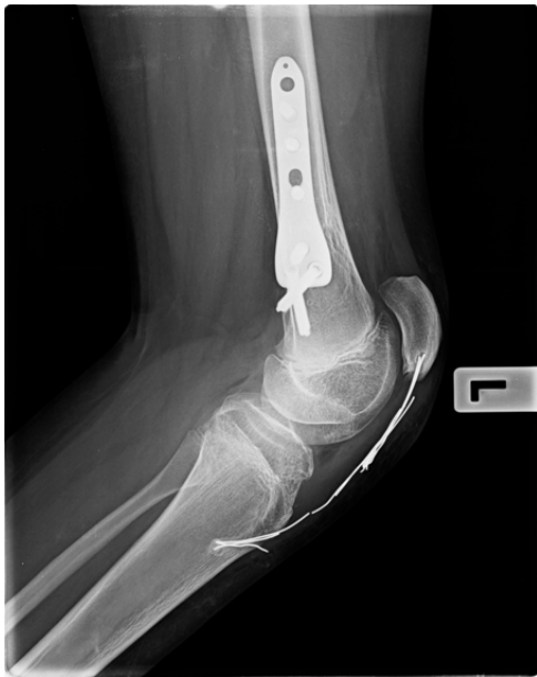
Şekil 3. Diz fleksiyon kontraktürü sebebiyle bilateral SFEO uygulanan hastanın takip grafileri.

İstatistiksel ilişki ortaya konurken SPSS 15 (SPSS Inc., Chicago, ABD) programından yararlanıldı. Grupların karşılaştırıldığı analizlerde kategorik değişkenler için Fisher exact test ve sürekli değişkenlerin farklı zamanlardaki değerlerinin karşılaştırılması için Friedman testi uygulandı. P değerinin 0.05'den küçük olması istatistiksel olarak anlamlı olarak kabul edildi.