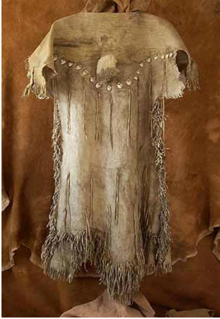
Tablo 3. İki parçalı (two-hide) kıyafetler I.