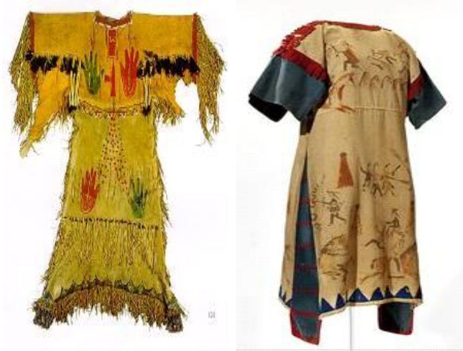
Tablo 6. Hayalet dansı elbisesi ve üzerinde savaş sahneleri olan elbise

Ovalar Bölgesi Kızılderililerine ait Hayalet Dansı Kıyafeti, 1890. Elbise, muslin kumaş ve deriden yapılmıştır. Üzeri, savaş sahnelerini temsil edecek şekilde desenlendirilmiştir. Böylelikle, savaşçı kabile üyeleri onurlandırılmıştır. Desenlendirme işleminin kabilenin erkek üyeleri tarafından gerçekleştirildiği düşünülmektedir. Bu elbise, Wounded Nee'deki Kızılderili katliamını da sembolize ettiğinden, giysi üzerinde boncuk işi ve ilave süslemeler kullanılmamıştır [8].