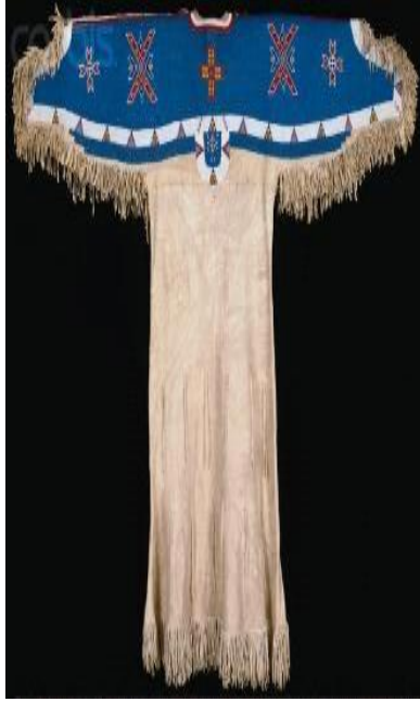
Tablo 4. İki parçalı (two-hide) kıyafetler II.

Sicangu Lakota (Sioux), Güney Dakota, 1850-1870. Göğüs, boyun ve omuzlar bölgesi ( yoke ) tamamen boncuk işlemeli iki parçalı Kızılderili kıyafeti. Yoke'nin mavi boncuklar ile bezenmiş zemin kısmı gölü, beyaz boncuklar ile işlenen kısımlar gökyüzündeki bulutları, kahverengi ve kırmızı boncuklar ile işlenen çarpı ve artı işaretli kısımlar ise ana ve ara yönleri betimlemektedir [4].