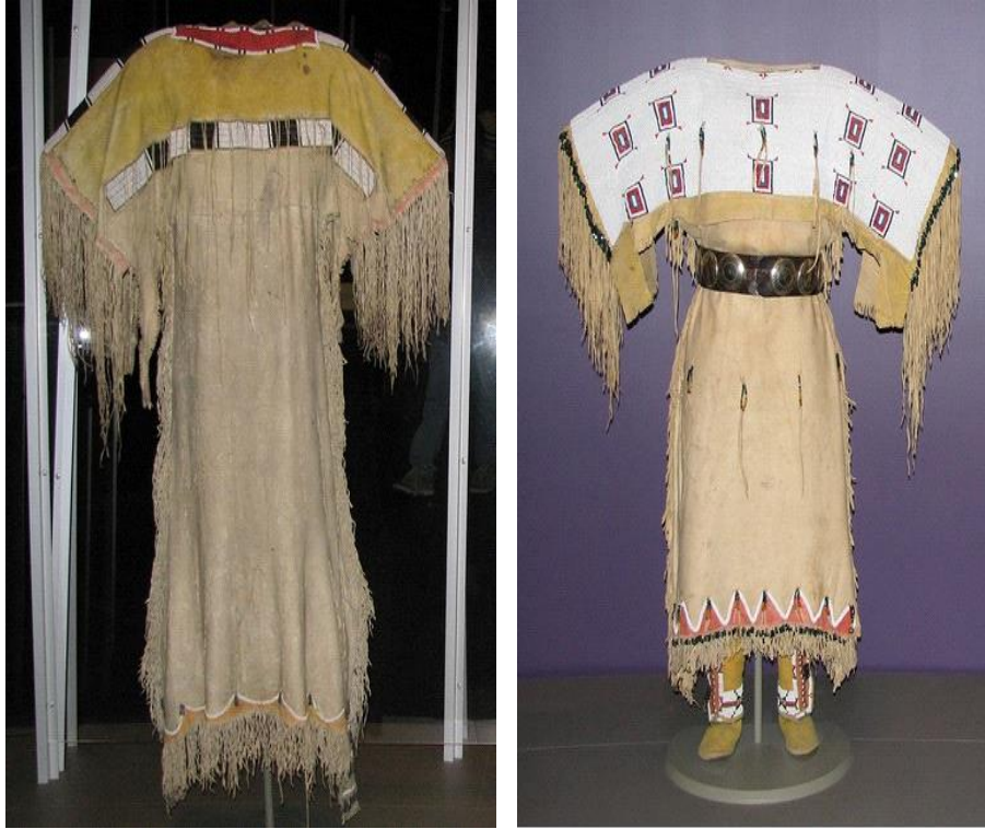
Tablo 5. Üç parçalı (three-hide) kıyafetler

Cheyenne üç parçalı elbise, 1870, Montana. Elbise geyik derisinden yapılmıştır. Yoke kısmı sarı renge boyanmış, kırmızı renk yün ve boncuklar ile süslenmiştir. Panço kısmının omuz bölgesinde, göğüs hizasında ve eteğin alt ucundaki boncuk işlemeli hatlar Cheyenne kabilesi kadın elbiseleri için karakteristiktir. Kabilenin inancına göre elbisede kullanılan dört ana renk kutsaldır. Kırmızı hayatı, sarı güneşin gücünü, siyah düşmanlara karşı kazanılan zaferi, beyaz ise her yeni doğan günü simgelemektedir [6].