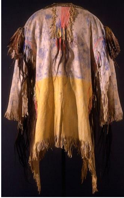
Tablo 7. Savaşçı elbisesi ve Kiowa Savaş Elbisesi.