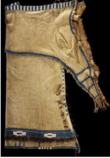
Tablo 2. Yandan katlı (side-fold) kıyafetler.

Aşağıdaki tablolarda bazı Kızılderili kıyafet örnekleri sunulmaktadır.