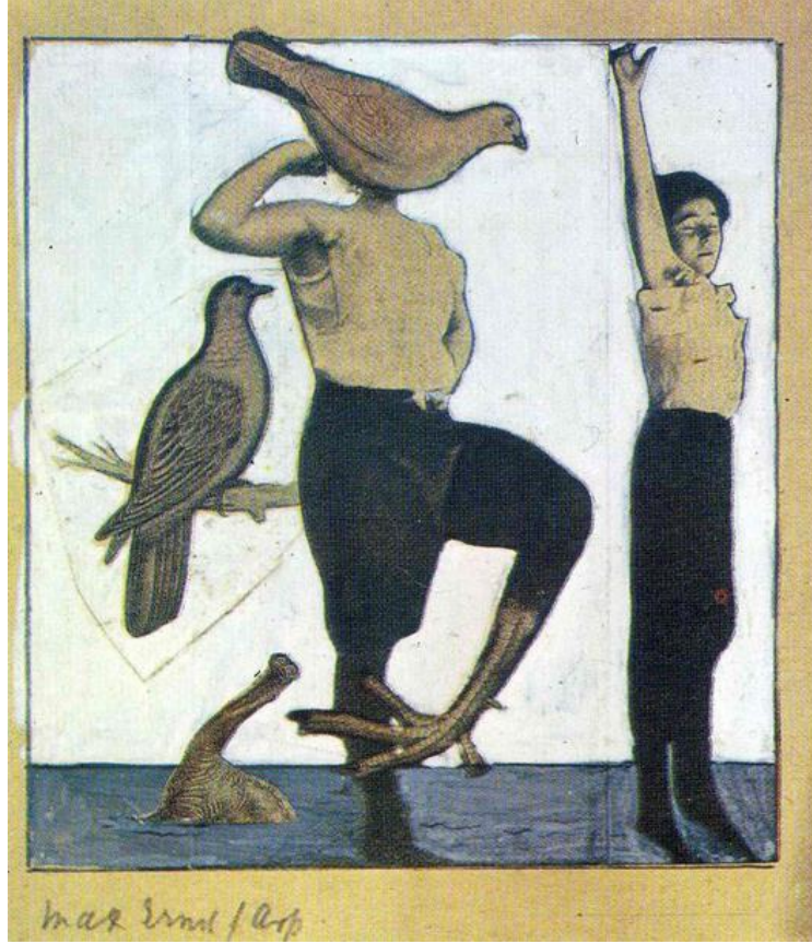
Max Ernst & Hans Arp, Physiomythological Diluvian Picture, 1920, Karton Üzerine Yapıştırılmış Kağıt Üzerine Fotoğraf Kolaj, Guaş, Mürekkep, Kalem

modifikasyonlarla modern sanatçının ilkel bilinçaltı dünyasının dışavurumuna uygun hale getirilmiştir. Başlangıçtaki amacı kopyalama, çoğaltma gibi işlevsel olan frotajın Ernst'teki bilinçaltı hissiyatını ovarak, sürterek yansıtmaya, ortaya çıkarma eylem ve işlevi karşılığı itibarıyla sonuçta işlevseldir ve çok da farklı değildir.