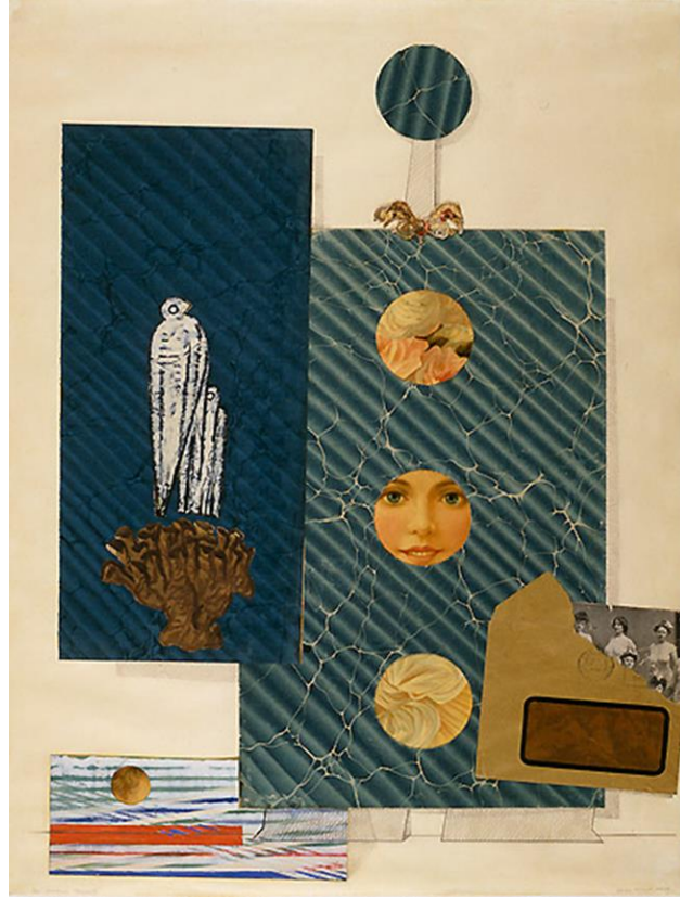
Max Ernst, The Postman Cheval (Le Facteur Cheval) , 1932, Kağıt Üzerine Kağıt ve Kumaş Kolaj, Kalem, Mürekkep Guaj, 64.3 x 48.9 cm, Peggy Guggenheim Collection, Venedik, İtalya http://www.guggenheim-venice.it/inglese/collections/artisti/dettagli/pop_up_opera2.php?id_opera=129

Sanatçının tamamen münhasır sanatsal kaygıları gereği keşfederek tercih ettiği ve kolajresim yaklaşımıyla tutarlı olan frotaj baskiresim tekniği de her bakımdan sanatçının boyaresim-kolajresim-baskiresim anlayışının bir kombinasyonudur. Başlangıçta Uzak Doğu'da, tamamen fonksiyonel amaçlara binaen icat edilerek uygulanan frotaj bir yüzey, plak veya kalıp üzerine konulan baskı kağıdının boyalı bir araçla üstten (arkadan) sürterek veya oarak bastırılarak imajın kağıdın ovma yapılan ön yüzeyine aktarılması esasına dayanan basit bir indirekt uygulamadır. Ancak sanatçı bu tekniği, birbirine yabancı, sanat dışı veya başka amaçlarla üretilmiş ve bazen hazır, buluntu imgeler de barındıran basılı matbuat ve materyali kombine etme biçimindeki alametifarika kolajresim yaklaşımıyla tutarlı bir baskiresim yöntemi yaratma adına kalıp olarak değerlendirdiği yapay veya doğal nesne yüzeylerinden indirekt baskı yoluyla kağıt vb. yüzeylere aktarmaya dayanan, kendi nevi şahsına münhasır bir baskiresim anlayışına dönüştürmüştür.