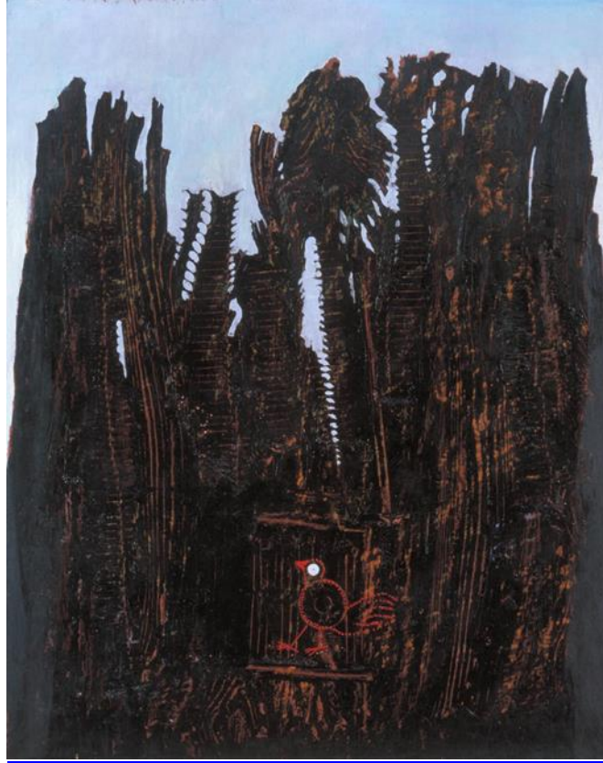
Max Ernst, Forest and Dove , 1927, Tuval Üzerine Yağlıboya 10,03 x 8,13 cm, Tate Gallery http://www.max-ernst.com/forest-and-dove.jsp

Max Ernst'in kariyerinde oldukça önemli imkanlar sunmuş olan kolaj temelli boya ve kolajresim yapımındaki münhasır sanatsal yaklaşımına paralel ve onlarla etkileşimli ve tutarlı bir başka resmetme yöntemi bir indirekt aktarma-çoğaltma baskiresim yöntemi olan frotajdır. Sanatçının bu baskiresim tekniğini keşfetmesine yol açan kaygı, şekli veya görünüşte bir tutarlılığın ötesinde, sanatsal anlayışının gereği olduğu düşünülmektedir.