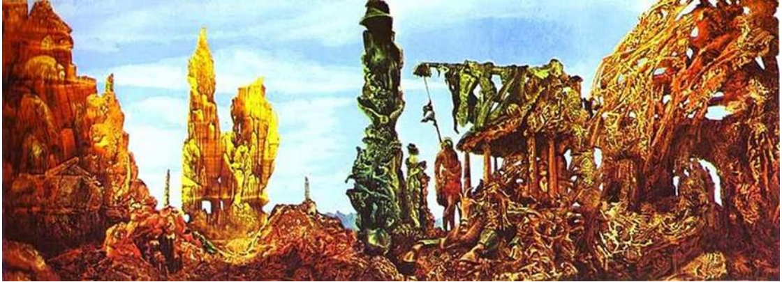
Max Ernst, II. Yağmurdan Sonra Avrupa , 1940-42, Tuval Üzerine Yağlıboya, 54.8 x 147.8 cm http://www.max-ernst.com/europe-after-rain.jsp

Ernst'in boyaresimleri bir biriyle ilişkisiz, bir arada tahayyül edilmesi güç, hatta neredeyse imkansız çeşitli gerçekliklerden fragman veya parçalardan oluşan imgelerle inşa edilen resimler sanatçının imzası niteliğindedir. Bu durum resmin örgüsünü oluşturan renk, form ve dokulara kadar her türden elemanda olduğu gibi, resmin temel sanat prensiplerinde de görmek mümkündür. Sanatçının parçala, kes, bir araya getir yapıştır biçimindeki resmetme yaklaşımını hem boya hem de kolaj resimlerinde aynı tutarlılıkta görülmüştür.