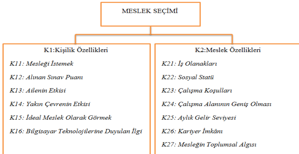
Şekil 1. Meslek Seçimi için Hiyerarşik Yapı

Çalışmada meslek seçiminde etkili olabilecek kriterler erkek ve kadınlar için kişilik özelliklerine bağlı ve mesleki özelliklere bağlı kriterler olarak ikiye ayrılmıştır. Bu soru formunun hazırlanmasında Önder vd. (2004), Kuvat ve Aytekin (2016)’in çalışmalarından ve meslekte çalışan kişilerin önerilerinden yararlanılmıştır. Burada ele alınan kişilik özellikleri; seçim yapan öğrencilerin birey olarak sahip oldukları düşünceleri, duyguları ve etkilendikleri alanları temsil etmektedir. Meslek özellikleri ile seçimini yaptıkları mesleğin özellikleri temsil edilmektedir. Şekil 1’de verildiği gibi; kişilik özellikleri 6 alt kriterden, meslek özellikleri 7 alt kriterden oluşmaktadır.