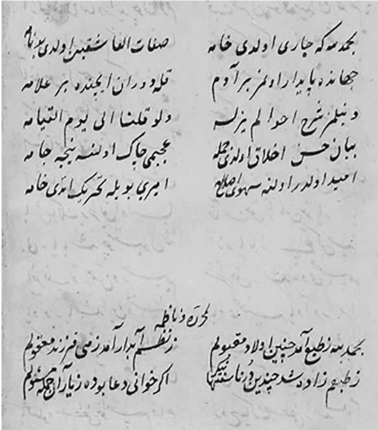
Sıfâtü'l-Âşıkîn tercümesinin sonu, Uppsala Yazması, 290b