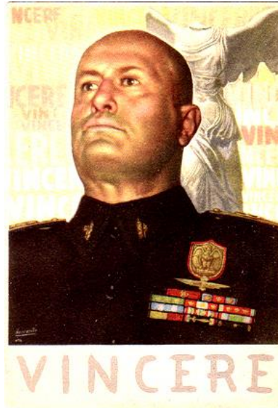
Şekil 4: "Zafer" Konulu Propaganda Afişi

İtalya, Birinci Dünya Savaşı'na İngiltere, Fransa ve Rusya'nın oluşturduğu Üçlü İtilaf Devletleri'nin bloğunda girdi. İtalya, savaşta kazanan bloğu desteklemesine rağmen, savaşın sonucunda istediklerini elde edemedi. 2 Dünya Savaşı patlak verdiğinde de gerek ülkede egemen olan ideoloji, gerekse ülkenin mevcut çıkarları nedeniyle, İtalya eski düşmanı Almanya'nın yanında savaşa katılarak, 1940 yılının Haziran'ında Fransa ve İngiltere'ye savaş açtı. Savaşta Mussolini, İtalya Ordusu'nun liderliğini üstlendi. Bu süreçte, İtalyan Ordusu'nun zaferi doğrudan Mussolini'ye mal edileceği için İtalyan propagandası sürekli olarak "zafer" sloganları atarak savaşın İtalyanlar lehine sonuçlanacağı yönünde kamuoyunu etkilemeye çalıştı.