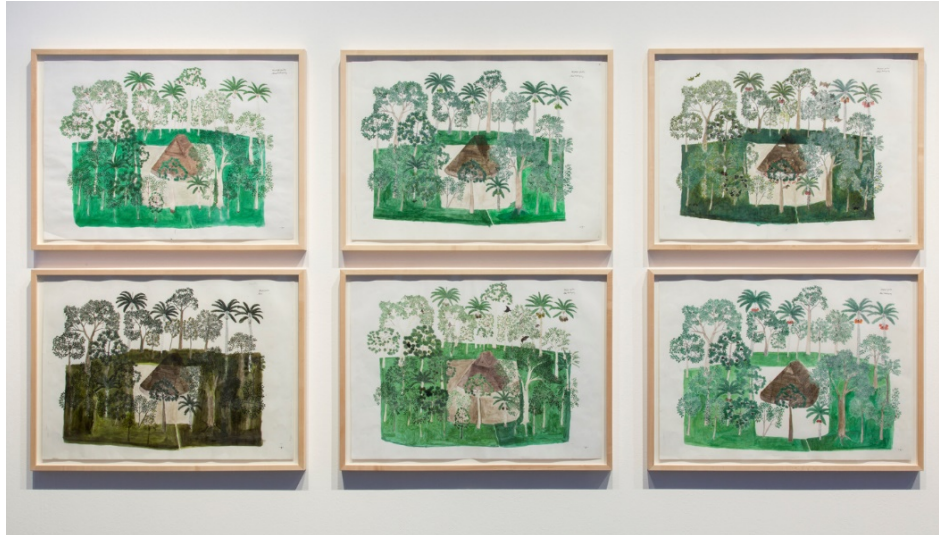
Resim 1. Abel Rodríguez, “Annual Cycle of the Flooded Rainforest”, 2009

2017 yılında Kassel ve Atina’da eşzamanlı olarak gerçekleştirilen, 1955 yılından beri beş yılda bir gerçekleştirilen 14. Documenta etkinliğinde, Abel Rodriguez doğa illüstrasyonları ile yer almaktadır. 1944 yılında Colombiya’nın Amazon ormanlarında doğmuş olan Rodriguez, aile büyüklerinden aktarılan bilgiyle yerel bitki örtüsü, doğanın zamansal döngüsü, ekoloji ve kültürün ilişkisinin bilgisini kavradığını; ancak geleneksel kabile eğitiminin yatılı okula başladıktan sonra yarım kaldığını ifade etmektedir (Sanchez, 2016, p:2). İç savaş nedeniyle yaşam alanını terk etmek zorunda kalan Rodriguez, yerel rehber olarak çalışırken tanıştığı biyolog Carlos Rodriguez ile çalışmaya başlar. Yıllarca kabile içinde sözel olarak aktarılan bilgi, biyoloji alanında çalışanlar için, Amazon ormanları bitki örtüsünün imgesel çizimlerine dönüşmüştür.