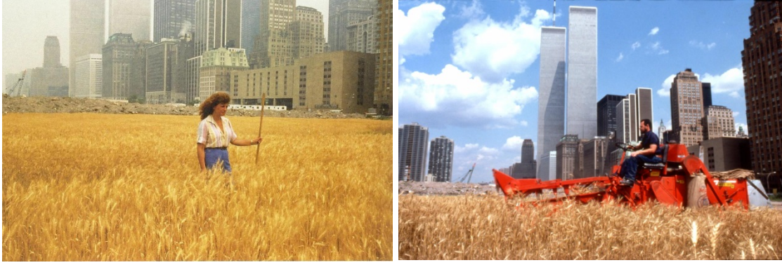
Resim 4. Agnes Denes, "Wheatfield- A Confrontation: Battery Park Landfill, Downtown Manhattan", 1982

Sanat olarak şekillenen yeni pratikler, resim ve heykel anlayışının sınırlarını kıran, eylemlere ve yeni bir bilgi türüne dönüşmüştür. Bugün kendisini sanatçı olarak tanımlamayan bir kişinin yaptığı üretim sanat alanında yer bulabilirken, bir sanatçının üretim pratiğinin aktivizme ya da salt bir bilimsel/sosyal araştırmaya yaklaşabildiğini tecrübe etmekteyiz. Bu alanlar arası geçişkenlik ve esneklik kabiliyeti Guattari'nin "Üçekoloji" metninde ısrarla telaffuz ettiği bir gerekliliktir. Doğa ve insan ilişkisi politik bir konudur ve ekoloji bu tartışmalardan izole bir şekilde ele alınamayacak bir alan olduğu ifade edilmektedir.