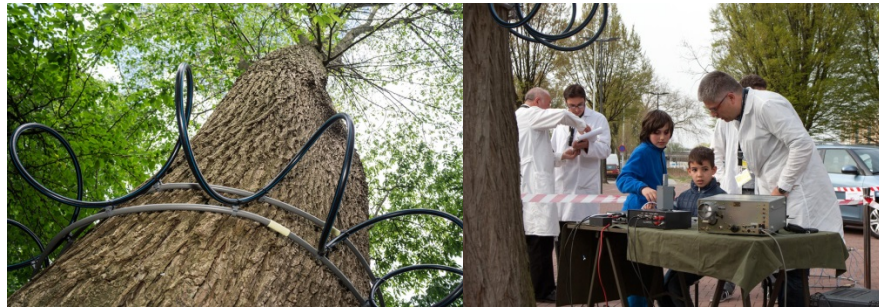
Resim 6. Jalila Essaidi, "Living Network", 2014-15

2011 yılında bağımsız, kâr amacı gütmeyen Amberplatform'u tarafından gerçekleştirilen "Öteki Ekoloji" temalı sanat ve teknoloji festivali; sergi ve atölye çalışmalarıyla tasarımcı, sanatçı ve araştırmacıları bir araya getirmiştir. Jalila Essaidi'nin yeni malzemeler geliştirdiği biyoloji temelli sanat üretimine yer vermektedir. Örümcek ağını model olarak geliştirdiği kurşungeçirmez insan derisi, ağaçların iletişim ağı, gübreden üretilen yeni malzemeler üzerine şekillenen projeleri, bilimin araştırma yöntemlerini sanatın yaratıcı ve eleştirel düşünme mekanizmalarıyla birleştirmektedir. Çalışmaları teknolojik olarak insanlığın geldiği noktada, bilgi dolaşımı ve üretim politikalarında yeni bir bakış geliştirmeyi önermektedir.