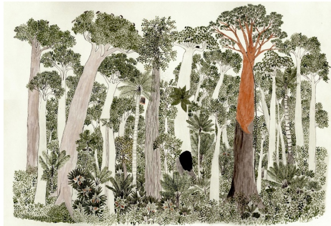
Resim 2. Abel Rodríguez, “Annual Cycle of the Flooded Rainforest”, 2007

Bir seri olarak sergilenen çizimler, ormanlarında mevsimsel olarak bitkiler ve doğal yaşamda gerçekleşen değişimi ve döngüyü takvimsel olarak görselleştirmektedir. Kâğıt üzerine mürekkep ile gerçekleştirilen illüstrasyonlar, ağaç ve bitki türlerinin ince detaylarının oluşturduğu bir örüntü yaratmaktadır. Bu çizimler aynı zamanda araştırmacı bir göz için bilgi taşıyan, izlenebilir ve okunabilir bilgi kaynaklarıdır.