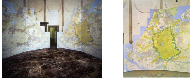
Resim 5. The Harrison Studio, "A Vision for the Green Heart of Holland", 1984

Ekolojik sanatın öncülerinden Helen Mayer Harrison ve Newton Harrison çiftinin yerel yönetimlerle işbirliği ile gerçekleştirdiği projeler, kamuoyu yaratma konusunda etkili olmuştur. 90'larda Hollanda hükümeti, sanatçıları büyük bir konut alanı inşa projesi kapsamında, yeşil alanın yönetimi problemini çözmek üzere davet etmiştir. Bölgede havadan yapılan büyüleyici video çekimleri ve çizimler eşliğinde Hollanda haritasını tersyüz basarak bir yerleştirme gerçekleştirilmiştir. Yetkililer tarafından önce tepkiyle karşılanan bu hamle, sanatçıların hükümetin yürüttüğü yanlış politikaya ikna edici bir eleştiri olarak kabul görmüştür.