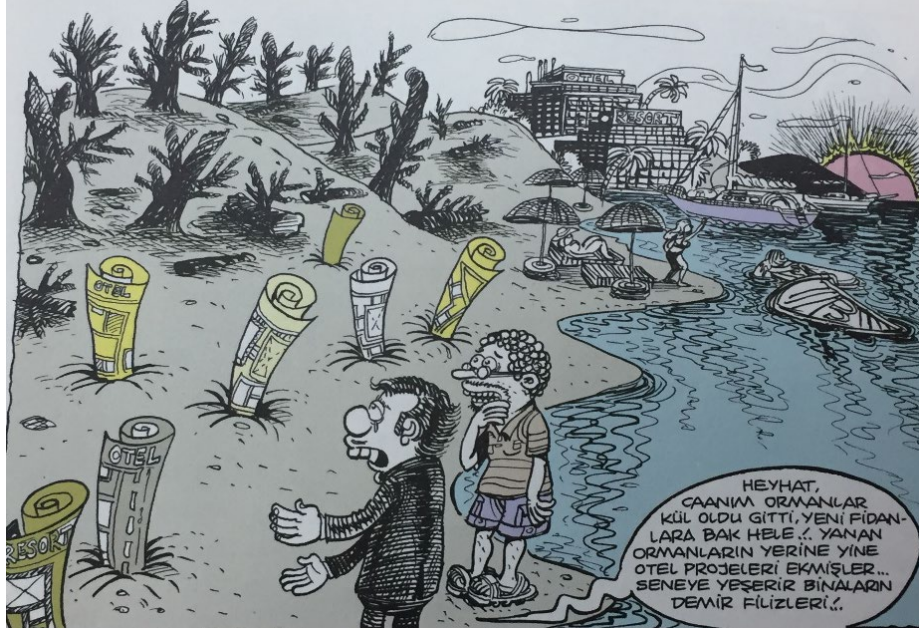
Resim 1: Deniz Sahilindeki Ormanlık Alanların Kasıtlı Olarak Yok Edilerek Turistik Tesis Yapımına Zemin Hazırladığını Anlatan Bir Çizim

GÖNÜL ADAMI: HEYHAT, CANIM ORMANLAR KÜL OLDU GİTTİ, YENİ FİDANLARA BAK HELE!.. YANAN ORMANLARIN YERİNE YİNE OTEL PROJELERİ EKMiŞLER... SENEYE YEŞERİR BİNALARIN DEMİR FİLİZLERİ!..