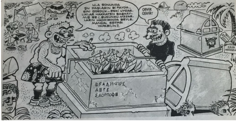
Resim 2: Turistik Mekânlardaki Tarihi Eserlerin Bilinçsizce Tahrip Edilmekte Olduğunu Anlatan Bir Çizim

Resim 3'teki çizimde, Antik Yunan mitolojisinde yarı insan yarı at görünümüne sahip kentaurların (kentaurlar) betimlenmektedir. Çizimdeki Kentaurlar karakteri, tarih geçmişine bakıldığında turistik bir bölge olarak karikatürize edilen bu çizim karesindeki çağdaş bir işletmeci tarafından yabancı turistlere adeta bir meta gibi sunulmaktadır. Kentaurlar karakteri, bu olumsuz tablo karşısında şu sözleri dile getirmektedir (İçoğlu, 2000: 63):