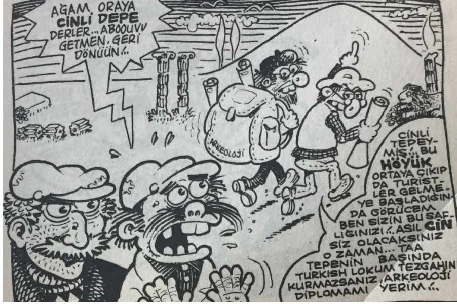
Resim 5: Tarih Turizmi Potansiyelinin Bölge İnsanı Tarafından Henüz Bilinmeyen Bir Beldenin Müstakbel Bir Gelecekte Turizme Açılmasının, Turizmin Metaştırılması Sonucunu Doğurabileceğini Anlatan Bir Çizim

İçoğlu'nun başka bir karesinde betimlediği erkek karikatür karakteri, yanındaki arkadaşına olayın geçmekte olduğu turistik beldeyi tanıtmaktadır. Erkek karakter, mağrur bir ifadeyle, arkadaşına, inşa etmiş olduğu apartman sitesini anlatmaktadır. Aynı anda, köylü tezgâhındaki meyve-sebze ürünlerinin satıcısı olan köylü karakteri ile de konuşmakta ve satıcının ürünlerine ilişkin yorum yapmaktadır (İçoğlu, 2000: 40):