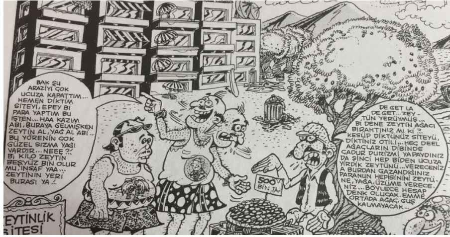
Resim 6: Doğa Turizmi Nedeniyle Çarpık Yapılaşma Yaşanan Turistik Bir Beldede Yaşanan Olumsuzlukları Anlatan Bir Çizim

İçoğlu'nun, turizmin metalaştırılmasına yönelik olarak yapmış olduğu çizim ve anlatımların sayısının çok fazla olmasından dolayı, bütün bu yazıların ve çizim karelerinin, yukarıda sıralanan betimsel anlatımlara benzer şekilde aktarılabilmesini olanaksız kılmaktadır. Zaten, söz konusu yazılı anlatımlar ve çizimlerin teker teker aktarılması, mikroanalitik bir çalışma olan bu makalenin amacını ve hacmini aşmaktadır. Dolayısıyla, İçoğlu'nun kitaplarındaki turizmin metalaştırılması temasının detaylandırılması, ancak ve ancak Tablo 1 ve Tablo 2'deki gibi bir aktarım ile mümkün olabilmektedir.