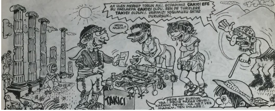
Resim 4: Aile Geçmişinden İntikal Eden Tarihi Nitelikteki Kişisel Kullanım Eşyalarının Ticari Meta Olarak Turistlere Satılmasını Eleştiren Bir Çizim

Resim 5'teki çizimde arkeologlar, tarihi bir alanda inceleme yapmaktadırlar. Çizimde düz bir alandaki tarihi kalıntılar ve bu kalıntıların hemen yanındaki küçük bir tepe resmedilmiştir. Arkeologlar, tepenin, insan yapımı yapay bir oluşum izlenimi vermesi ve arkeoloji bilgisi/tecrübesi doğrultusunda tarihi bir höyük olabileceği yönünde güçlü bir öngöründe bulunmaktadırlar. Çizimdeki köylü karakterlerden biri, bu tepenin, halk arasında "Cinli Tepe" olarak bilindiğini endişeli bir ifadeyle dile getirmekte ve arkeologların tepeye gitmemelerini salık vermektedir. Arkeolog karakteri ise, bu tepenin, höyük olduğunun anlaşılması sonrasında turizme açılacağı ve turist akınına uğrayacağı öngörüsünde bulunmaktadır. Bu durumun da bölge insanının bakış açısını değiştirerek, oluşacağı öngörülen turistik potansiyeli, ticari metalaştırmaya tahvil edeceğini ifade etmektedir. Arkeoloğun bu sözleri, endişeli söylemlerde bulunan köylü karakterinin yanında yer alan diğer köylü karakterinin ilgisini çekmekte ve adeta gözlerinin içinin parlamasına neden olmaktadır. Arkeolog ile köylü arasında geçen diyalog aşağıda aktarılmıştır (İçoğlu, 1997: 23):