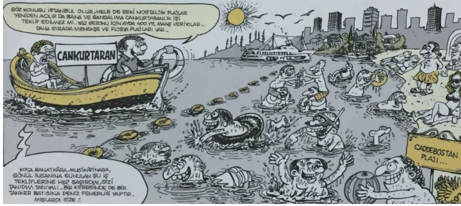
Resim 7: İstanbul'un Nostaljik Plajlarının Yeniden Halka Açılarak Gerçek Kullanıma Sunulmasını Anlatan Bir Çizim

İçoğlu'nun, kitaplarında yer alan ve turizmin metalaştırılması hususunu yadsıyan ve dolayısıyla da olumlu çağrışımlar uyandıran çizim ve anlatımların detaylı dökümü Tablo 2'de görülmektedir.