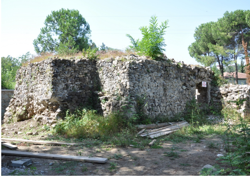
Görsel 14: Ordu Eskipazar Büyük hamam genel görünüş (restorasyondan önce)

Hamamların yapım tarihlerini aydınlatacak herhangi belge veya kitabe mevcut değildir. Samsun Vakıflar Bölge Müdürlüğünden sorgulanan yapılara ait bir vakfiye veya belge tespit edilememiştir. Hamamların kayıtlı tescil ve tapu kayıtlarından başka tarihini aydınlatacak herhangi bir belgeye ulaşılamamıştır. Üzerinde kitabesi olmayan hamamlarla ilgili benzer tarihi, plan ve mimari özellikler gösteren özellikle Ordu