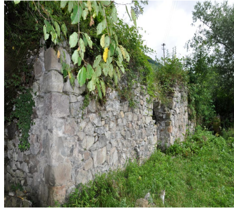
Görsel 2: Aybastı büyük hamam genel görünüş