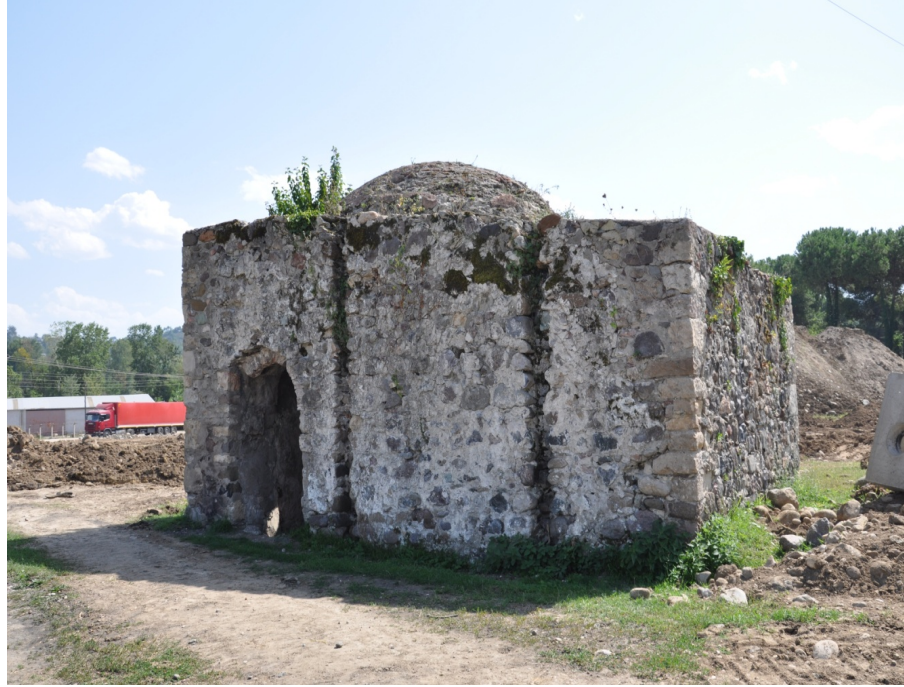
Görsel 15: Ordu Eskipazar Küçük hamam genel görünüşü (restorasyondan önce)

Eskipazar Küçük Hamam (Görsel 14) ve Büyük Hamam (Görsel 15) (18-19. yy.) ile Anadolu'daki diğer benzer örneklerle yapılan karşılaştırma ve değerlendirme sonucunda hamamları XIX yy. sonu XX. yy. başlarına tarihlemek mümkün olacaktır. Adı anılan ailenin de bu dönemlerde bölgede yaşadığı belirtilmektedir. Aybastı Küçük ve Büyük Hamam'ın Ordu Eskipazar Küçük ve Büyük Hamam ile sadece tarih olarak değil, özellikle plan, mimari ve malzeme açısından yakın benzerlikleri bulunmaktadır. Bu doğrultuda hamamların belki de aynı usta veya usta grubu tarafından tasarlanmış veya hamamların yapılmış olma ihtimalini de düşündürmektedir.