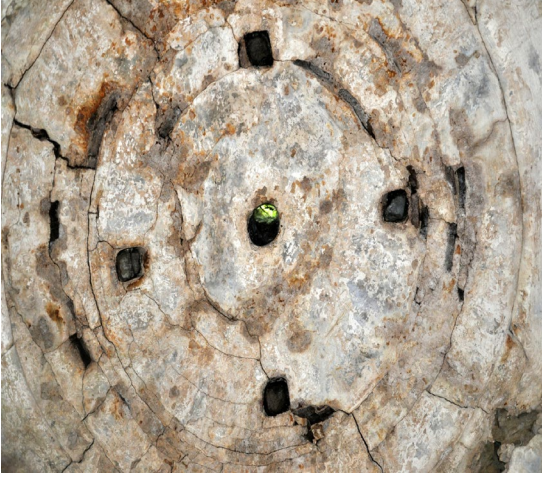
Görsel 5: Halvet hücresi kubbe görünüş