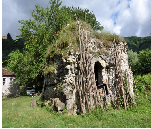
Görsel 10: Küçük hamam genel görünüş

Küçük Hamam, Ordu ili Aybastı İlçesi Sefalık Köyünde Hazinedaroğulları'na ait konağın bahçesinde, konağın kuzeyinde yer almaktadır. Hamamın üzerinde herhangi bir kitabe mevcut değildir, bu nedenle kesin inşa tarihi bilinmemektedir. Günümüzde kullanılmayan küçük ölçekli tek fonksiyonlu hamam metruk ve üst örtüsü kısmen yıkılmış durumdadır.