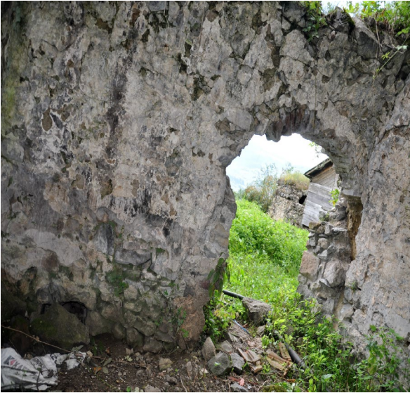
Görsel 3: Büyük hamam ılıklik genel görünüş