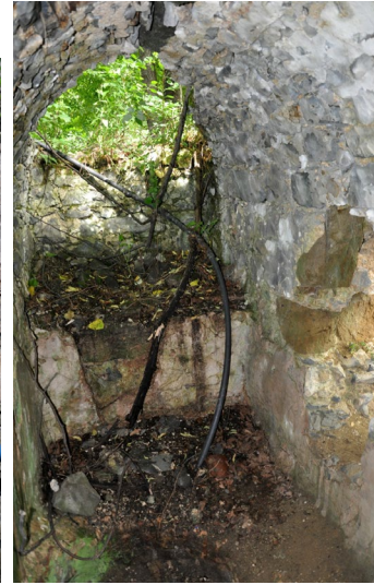
Görsel 8: Külhan su deposu

Büyük Hamam'ın külhan ve su deposu (Görsel 8) sıcaklığın kuzey duvarı ile halvet hücresinin batı duvarı hizasında dikdörtgen bir planla uzanmaktadır. 1,55x4,25 m.