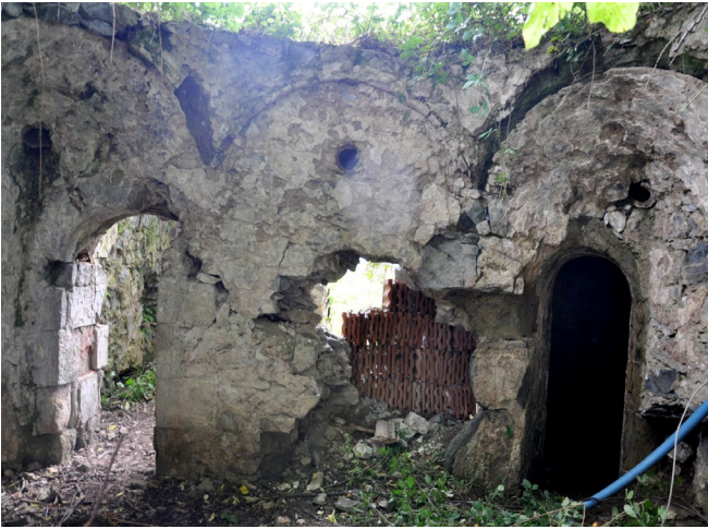
Görsel 7: Büyük hamam sıcaklık genel görünüş

Kuzeybatıda yerleştirilen halvet hücresi giriş kısmında kapıdan sonra içerisi yaklaşık 2.43x2.45 m. ölçülerinde kare bir plana sahip olup üzeri tromplarla geçilen küçük bir kubbe (Görsel 5) ile kapatılmıştır. Yuvarlak ışık gözleri açılan kubbenin altındaki halvet hücresinin külhanla birleşen doğu duvarı üzerinde sıcaklıktaki gibi daha dar tutulan iki lüleli kurna ayna taşı yer almaktadır. İçerisi tamamen sıvalı olan halvet hücresinin cehennemlik kısmı kaldırılmış ve burası tahrip edilmiştir. Halvet hücresinin kuzey ve doğu duvarı üzerinde farklı iki seviyede uzanan su künkleri burada da açıktadır. Sıcaklığın ve halvet hücresinin iç duvar dokusundan ayrıca bacası şimdi kalmayan tüteklikler de görülmektedir.