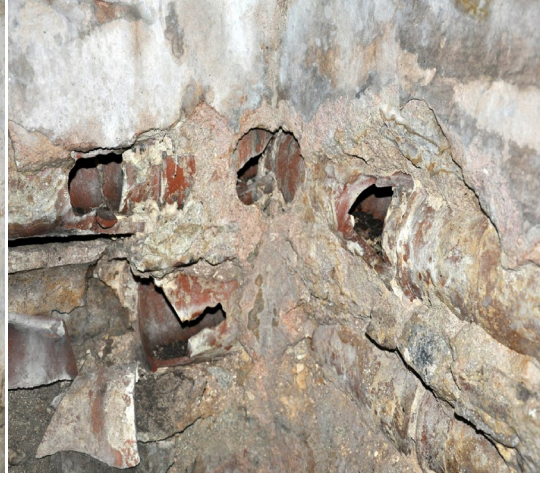
Görsel 6: Sıcaklık künkler görünüş

Kuzeybatıda yerleştirilen halvet hücresi giriş kısmında kapıdan sonra içerisi yaklaşık 2.43x2.45 m. ölçülerinde kare bir plana sahip olup üzeri tromplarla geçilen küçük bir kubbe (Görsel 5) ile kapatılmıştır. Yuvarlak ışık gözleri açılan kubbenin altındaki halvet hücresinin külhanla birleşen doğu duvarı üzerinde sıcaklıktaki gibi daha dar tutulan iki lüleli kurna ayna taşı yer almaktadır. İçerisi tamamen sıvalı olan halvet hücresinin cehennemlik kısmı kaldırılmış ve burası tahrip edilmiştir. Halvet hücresinin kuzey ve doğu duvarı üzerinde farklı iki seviyede uzanan su künkleri burada da açıktadır. Sıcaklığın ve halvet hücresinin iç duvar dokusundan ayrıca bacası şimdi kalmayan tüteklikler de görülmektedir.