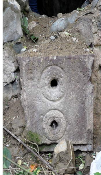
Görsel 4: Sıcaklıkta kurna taşı