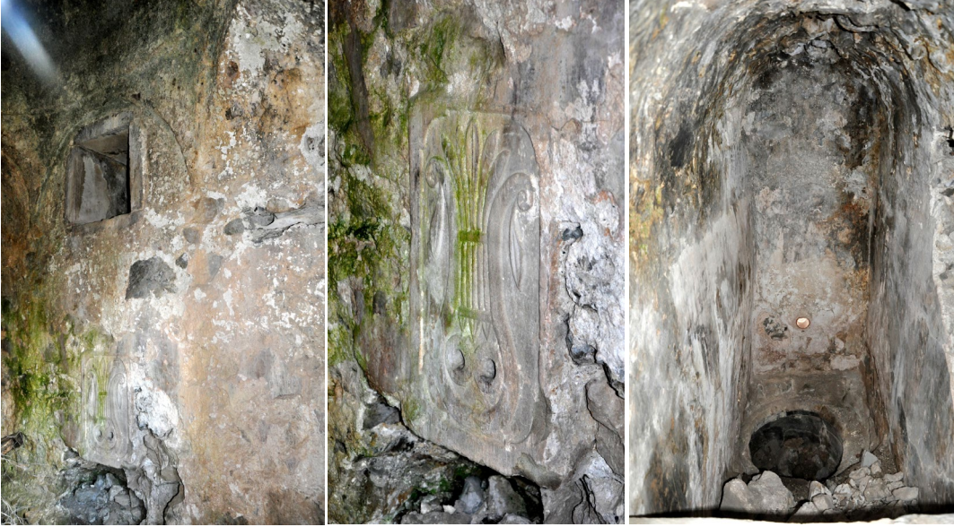
Görsel 11: Hamamın iç kısmı

yüzeyinde mono blok bir kurna ayna taşı yer almaktadır. 0,36x0,56 m. ölçülerindeki ayna taşının (Görsel 12) üzerinde XIX. yy. işaret eden üslup özelliği ile uçları volütler yapan stilize yaprak motifleri rölyef olarak işlenmiştir. Sıcaklığın batısında 0,60 m. genişlikte 0,64 m. derinlikte külhan ile bağlantılı bir pencere açılmaktadır. Dikdörtgen bir plana sahip olan doğu-batı doğrultusunda uzanan külhan ve su deposu içten yaklaşık 0,85x3,15 m. ölçülere sahiptir. Bu bölümün üzeri beşik tonozla örtülmüştür fakat örtü kısmen yıkılmış vaziyettedir. Su deposunun batı cephesi duvarı önünde 0,90 m. çapında bir ocak nişi ile alt kısmında kemerli külhan ağzı girişi bulunmaktadır (Görsel 13).