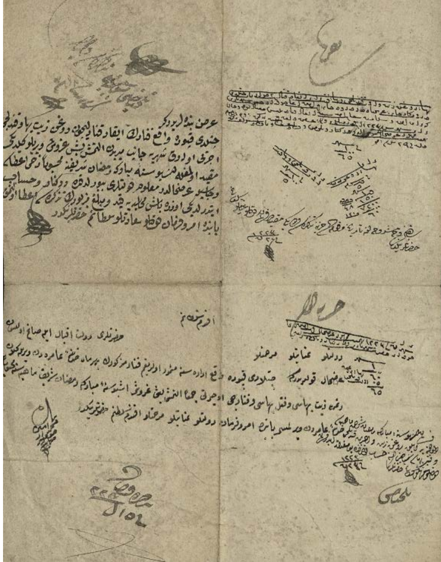
Ek-1. Çatalkapıda bulunan fenerlerin kandilleri için verilen revgan-zeyte dair. (BOA. AE. SMST.IV. 7-553)