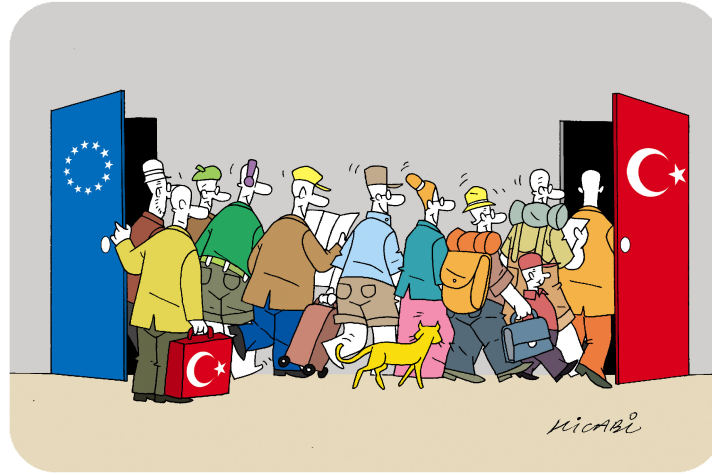
ekil 1: “Türkiye'nin Avrupa'yla Kar ıla ması” konulu Don Quichotte Uluslararası Karikatür Yarışması'nın birincisi olan bu karikatür, Türkiye'nin, Avrupa Birli i vatandaşlarının yo un göçü ile kar ıla aca una dikkati çekiyor.

ya lı Avrupalıların, literatürde rahatlı a dayalı göçler (amenity migration), ya lı göçleri (elderly migration) ya da emekli göçleri (retirement migration) olarak adlandırılan nüfus hareketleri için hedef bölgeler olan, spanya kıyıları ve adalarından ba layan ve di er güney Avrupa ülkelerinin Akdeniz kıyılarından olu an güzergâhına, Türkiye de eklenmi tir. Artan bu ilginin bir ifadesi olarak 2004 yılında uluslararası bir karikatür yarışmasında birincilik ödülünü, Türkiye'nin üyeli inin ardından Türkiye vatandaşlarının Avrupa Birli i ülkelerine de il, Avrupa Birli i vatandaşlarının Türkiye'ye akan edece ini anlatan bir çalı manın almı olması ilginç bir geli medir ( ekil 1).