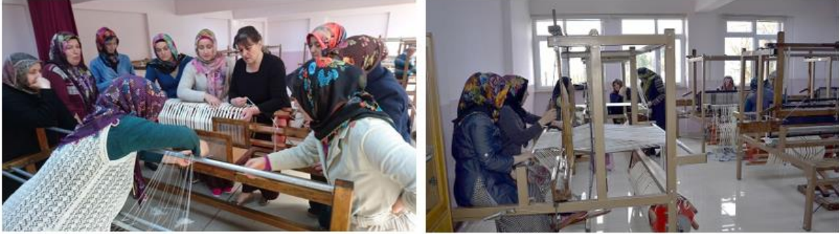
Resim 3. Çekmene Can Veren Has Eller Projesi Atölye Çalışmaları

(Meydan Gazetesi, 2017). Ayrıca proje ekibi ve ailelerine Ankara Anıtkabir gezisi düzenlenmiştir (Milliyet Gazetesi, 2017). Proje ürünlerinden örnekler şehir içinde belediyeye ait bir dükkânda sergilenmiş ve kent halkıyla proje bilgileri paylaşılmıştır.