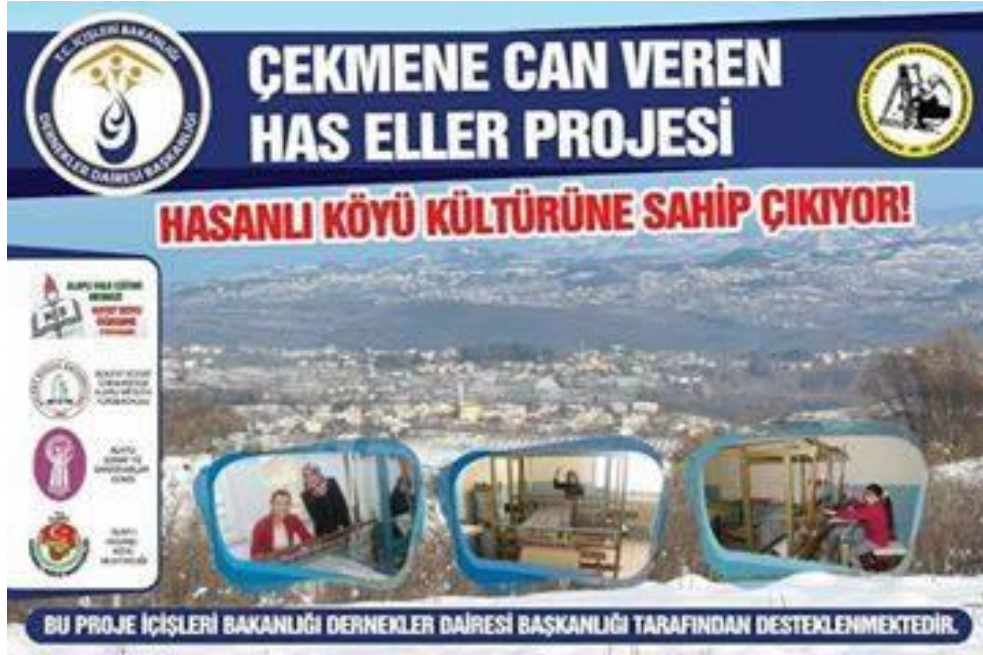
Resim 2. Proje Tanıtım Afışı

ve üzeri nüfus içerisinde on bin kişiye düşen yüksek lisans ve doktora sahibi nüfusun oranı 68 iken Türkiye ortalaması 134'tür. Çizelge 4'te görüldüğü gibi, Zonguldak ülke illeri sosyoekonomik gelişmişlik sıralamasında 29. durumdadır.