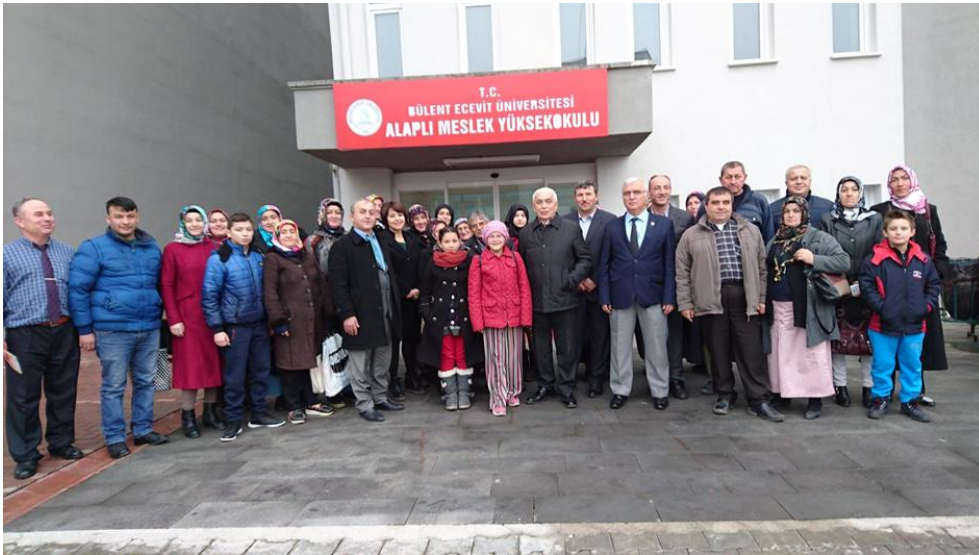
Resim 4. Bülent Ecevit Üniversitesi Alaplı Meslek Yüksekokulu Çekmene Can Veren Has Eller Projesi Eğitim Toplantısı

Çekmene Can Veren Has Eller projesinin amacı; yok olan değerlerin yeniden kazanılması, kadınların işgücü piyasasına katılımının yükseltilmesi ve kadın istihdamının artırılmasıdır. Proje kapsamında yaşları 18 ile 55 arasında değişen işsiz ve dar gelirlili 37 kadına eğitim verilerek kadınların meslek sahibi olmaları ve iş gücüne katılmaları sağlanmaktadır.